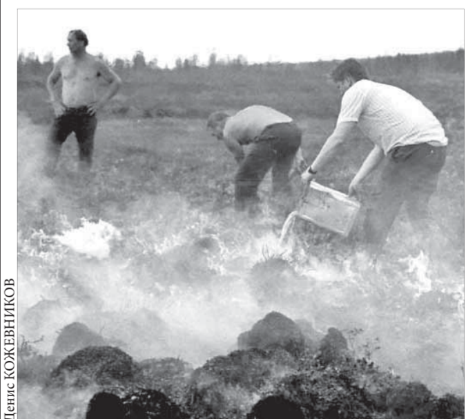
Пожар в тундре проще предотвратить, чем тушить

Лица, виновные в нарушении требований Правил пожарной безопасности в лесах, несут ответственность в соответствии с законодательством Российской Федерации.