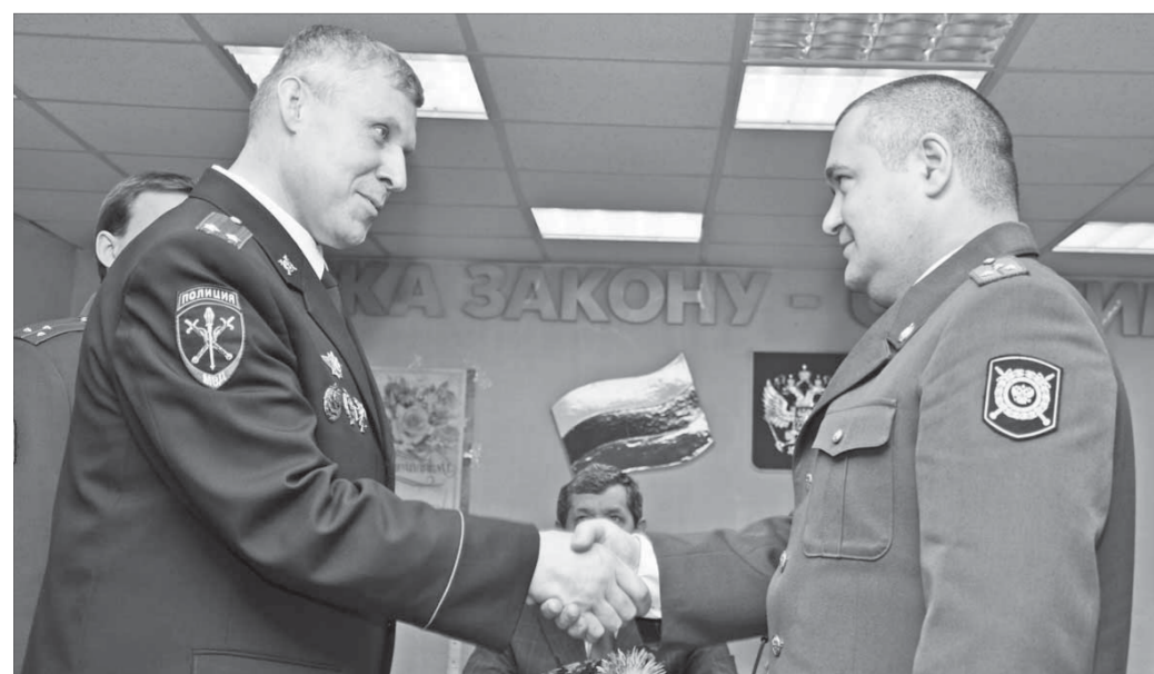
Будешь, старлей, капитаном

Норильской полиции исполнилось 72 года. В честь годовщины создания органа правопорядка норильские полицейские в торжественной обстановке поздравили друг друга с днем рождения и отметили лучших сотрудников горотдела и ветеранов полиции.