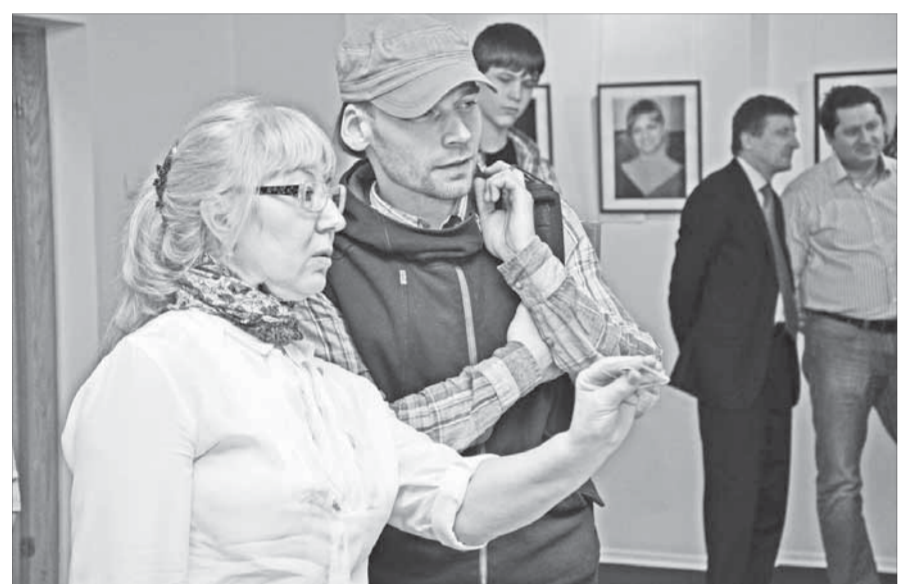
Как же экскаватору это удалось?

В один из рабочих дней на площадке АТО «ЦАТК» развернулся настоящий перформанс. Холст, размер которого соответствует габаритам ковша