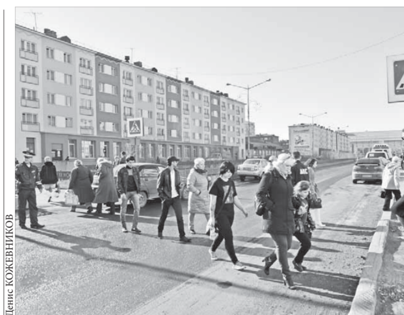
Из-за ДТП в районе Ленинского, 42, образовалась автомобильная пробка

В Норильске осложнилась дорожно-транспортная обстановка: с приходом тепла автомобилей на улицах стало больше. Возросло и число аварий, в том числе с участием пешеходов.