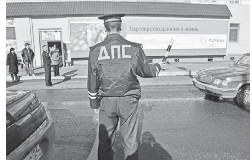
Автоинспекторам какое-то время пришлось регулировать движение у пешеходного перехода