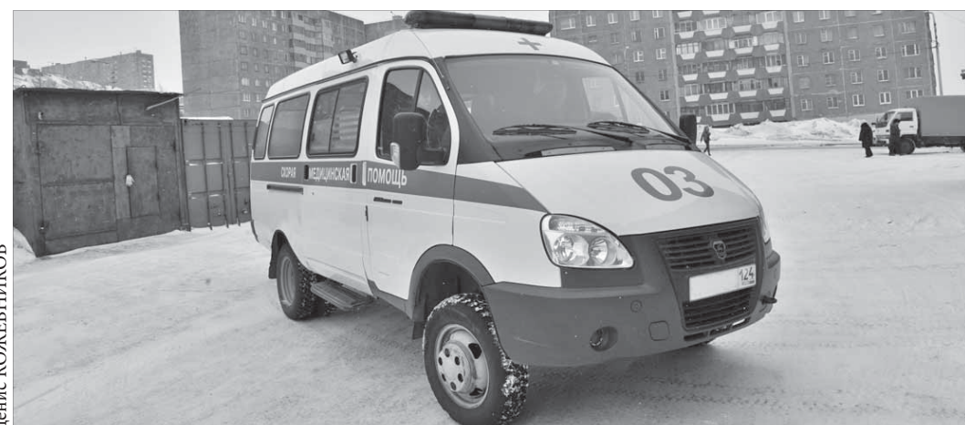
Скорая помощь совершила феноменальный поступок

Норильская скорая помощь оказалась в нужное время в нужном месте. Так можно назвать историю, которая произошла ночью 7 мая. Врачи стали не только свидетелями преступления, но еще преследовали и поймали злоумышленника. Они действовали почти как бойцы спецназа.