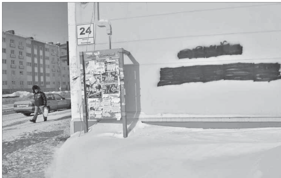
Даже самые добрые надписи на фасадах – преступление

На расширенном совещании в администрации Норильска в очередной раз обсуждали проблему порчи фасадов. Решение есть: отныне управляющие компании будут протокольно фиксировать каждый случай рисования на фасадах зданий, нарушителей