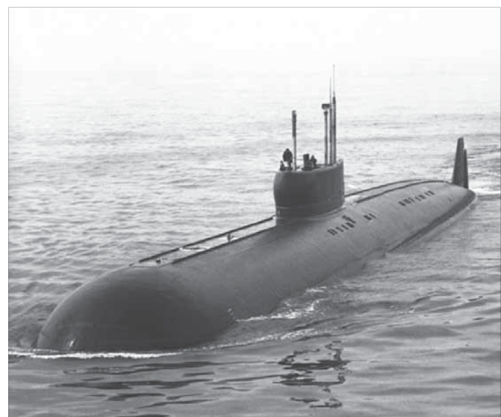
«Ленинский комсомо́л» заявил о себе в 1957 году

В Мурманске решается судьба первой советской атомной подводной лодки «Ленинский комсомо́л».