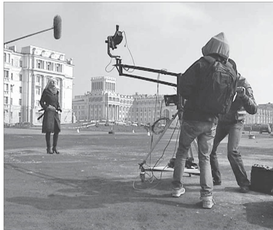
Команда "Зеркала времени" за работой