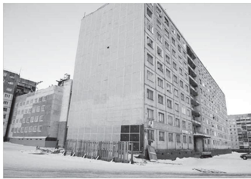
На ремонт торцов в прошлом году выделили 12 млн рублей

Будут проведены и ремонтные работы в кайерканских «гостинках» по улице Шахтерской, 5, 9, 11 и 18. В прошлом году из муниципального бюджета было выделено около 12 миллионов рублей на ремонт торцов зданий. Субподрядчик считал бетон старое покрытие, расчистил швы и начал промывать панели.