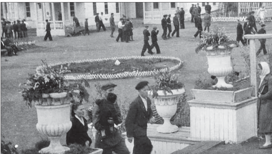
Стадион «Динамо» летом. Конец 1940-х – начало 1950-х гг.

20 июля 1958 года в Норильске впервые отметили День металлурга.