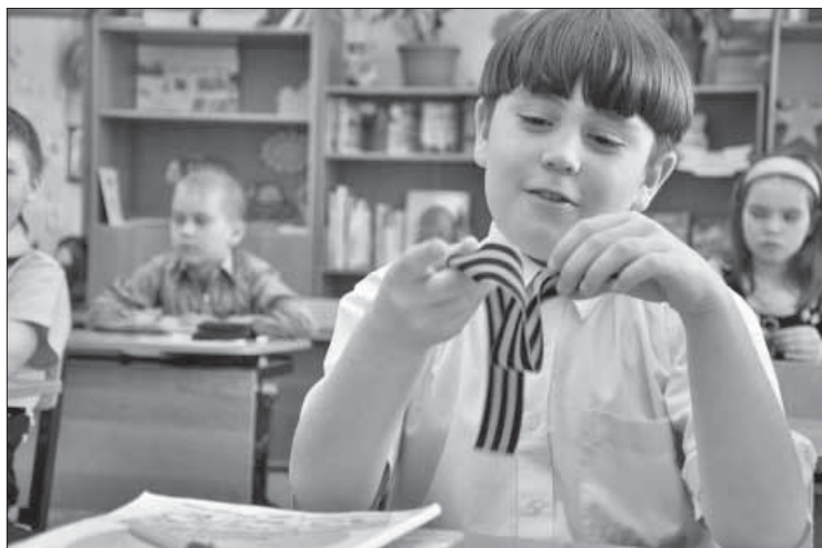
Привяжу бантом на ранец

От "Заполярного вестника" все ученики получили в подарок георгиевские ленточки и тут же повязали их на одежду. На во-