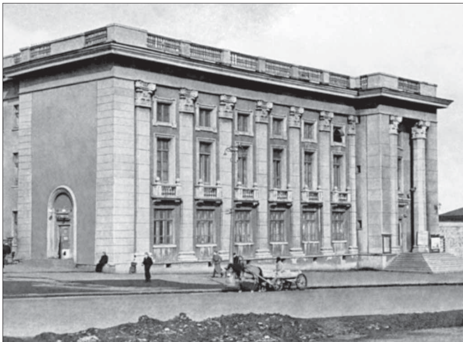
Дом инженерно-технических работ – ДИТР – торжественно открылся 31 декабря 1942 года