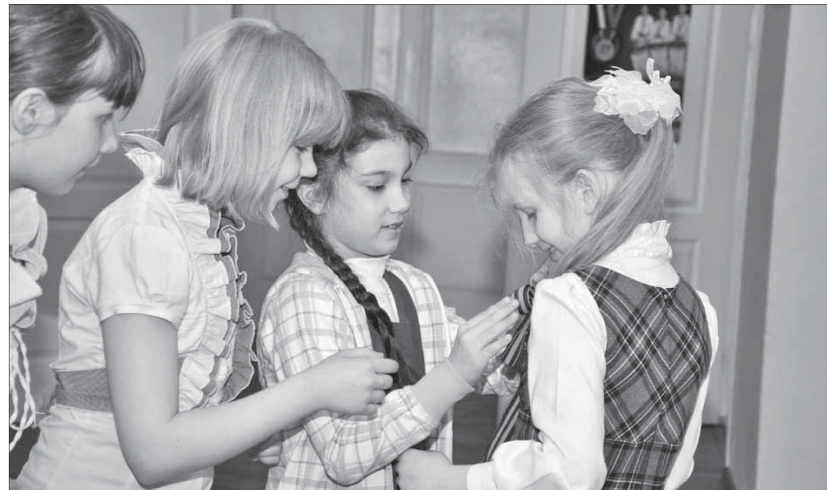
Георгиевские ленточки словно памяти нить между поколениями

Мальчишки и девчонки, рассекавшие в выходной на роликах по Театральной площади, тоже с охотой повязывали оранжево-черные ленты.