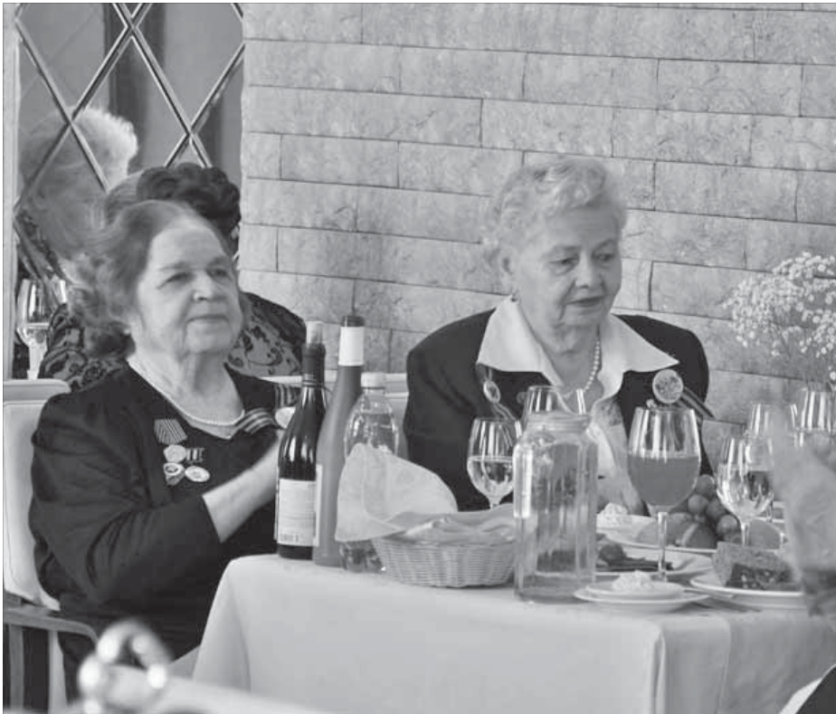
Радость Победы 1945 года до сих пор заставляет замирать сердца