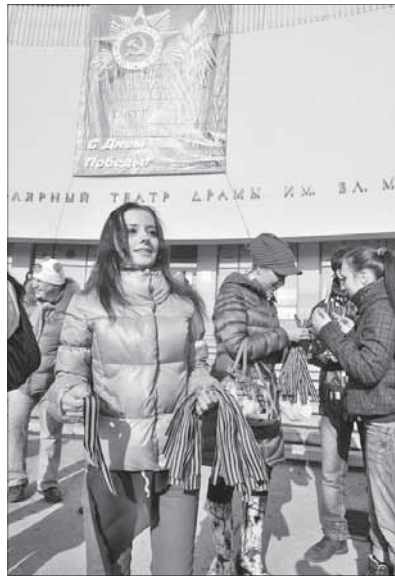
Какое счастье, что нет войны

Раздавая ленточки и поздравляя норильчан с наступающим праздником, корреспонденты "Заполярного вестника" интересовались, читают ли горожане нашу газету и что хотели бы в ней увидеть.