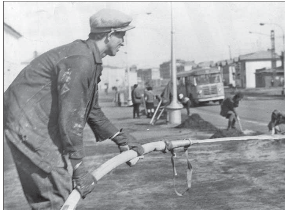
Субботник в Старом городе. Май 1959 года

Особой заботой в летние месяцы была борьба с кишечными инфекциями, в том числе с дизентерией, которые тогда были в Норильске не редкостью. Проводили санитарную очистку уборных, затягивали сеткой от мух окна и двери магазинов и киосков, обустроили мусоросборники. Берега ручьев, прилегающих к территории города, расчищали и хлорировали. Среди горожан проводили просветительскую работу специально организованные Горздравотделом бригады из участковых врачей и санитарных уполномоченных. Около 500 санитарных постов были организованы для постоянного поддержания чистоты на