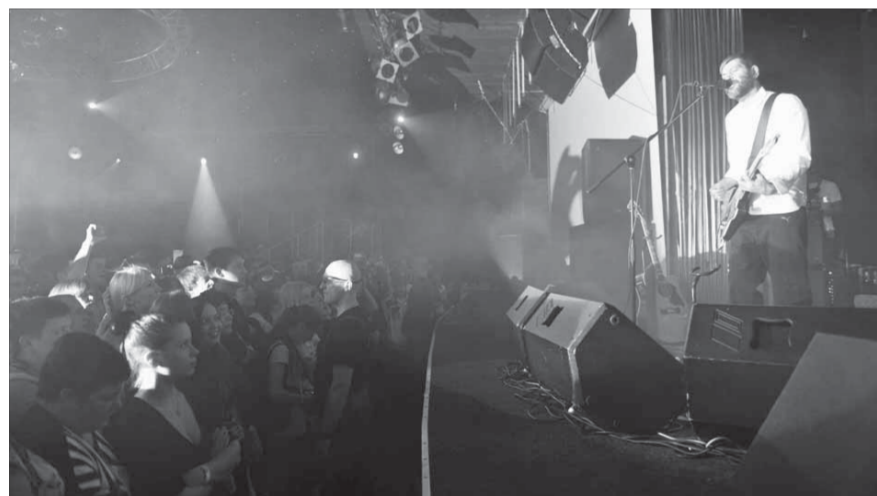
Норильчане не хотели отпускать музыкантов со сцены

В киноконцертном зале “Синема-АРТ-холл” прошел единственный концерт рок-группы “Сплин”. Поклонники вспомнили лучшие песни своего поколения и вживую оценили новый альбом музыкантов “Обман зрения”.