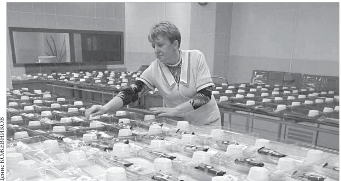
NordStar старается учесть пожелания всех пассажиров