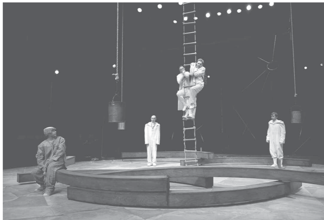
Фестивальная публика очень тепло приняла самую северную постановку “Ковчега”