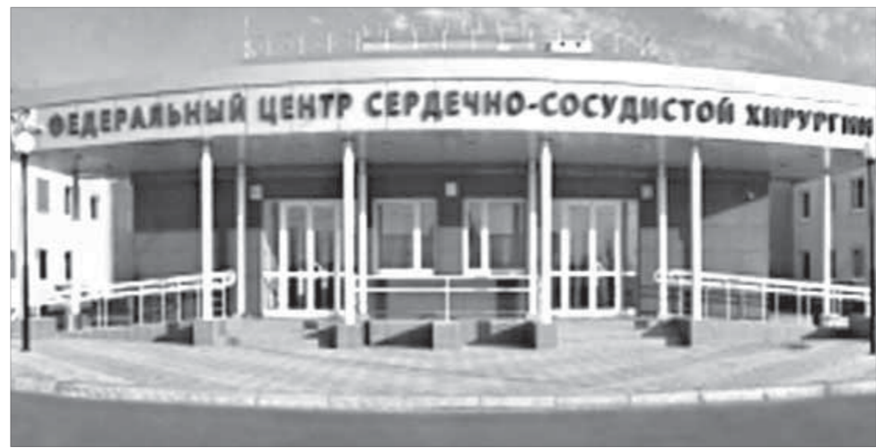
Недавно в центре была проведена десятитысячная операция на сердце

Курс акций ОАО “ГМК “Норильский никель” – 5176 рублей. ОАО “Полюс Золото” – 962,1 рубля.