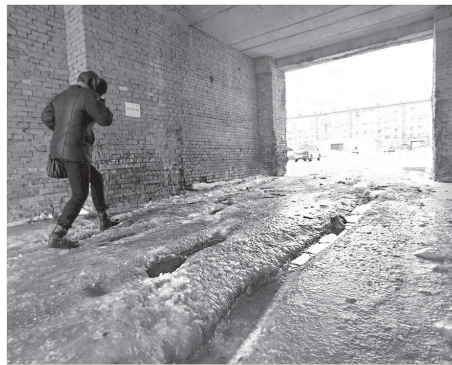
Ни на машине проехать, ни человеку пройти

Нарушение системы естественного водоотвода превратило арки во дворах едва ли не в самые труднопроходимые места в городе. Оперативно решать проблему могут только отбойные молотки.