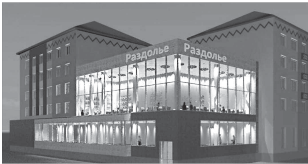
Идея нового кафе навеивает ностальгию: когда-то здесь было “От двух до пяти”

В частности, не принято решение по созданию “Аллеи славы почетных граждан города Норильска”. Члены совета и управление архи-