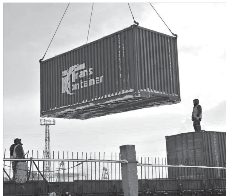
До начала навигации власти, вероятно, сумеют решить проблему с контейнерами

Для северян могут сохранить малотоннажные контейнеры под перевозку домашних вещей.