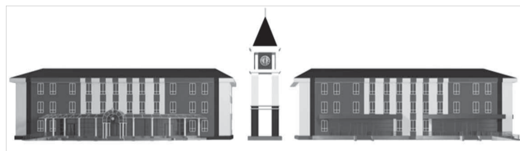
Проект с башней на бульваре Влюбленных отправили на доработку