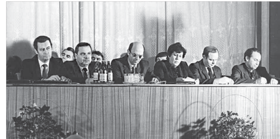
Бессознательное совещание по организации бытового обслуживания населения. Норильск. 1988 год

Курс акций ОАО «ГМК «Норильский никель» – 4936 рублей. ОАО «Полус Золото» – 911 рублей.