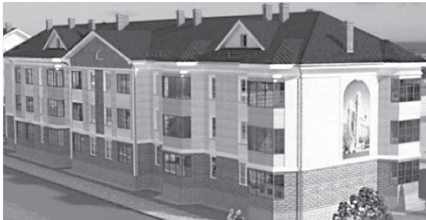
По улице Мира, 8, планируют строить трехэтажный дом