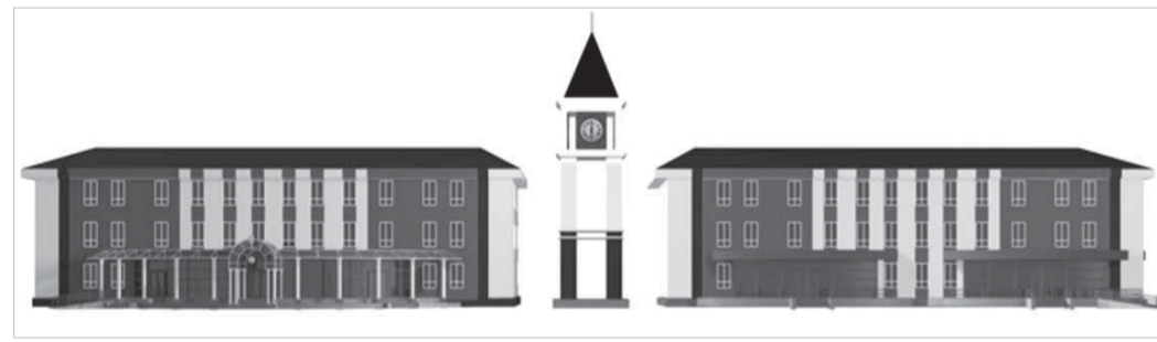
Проект с башней на бульваре Влюбленных отправили на доработку