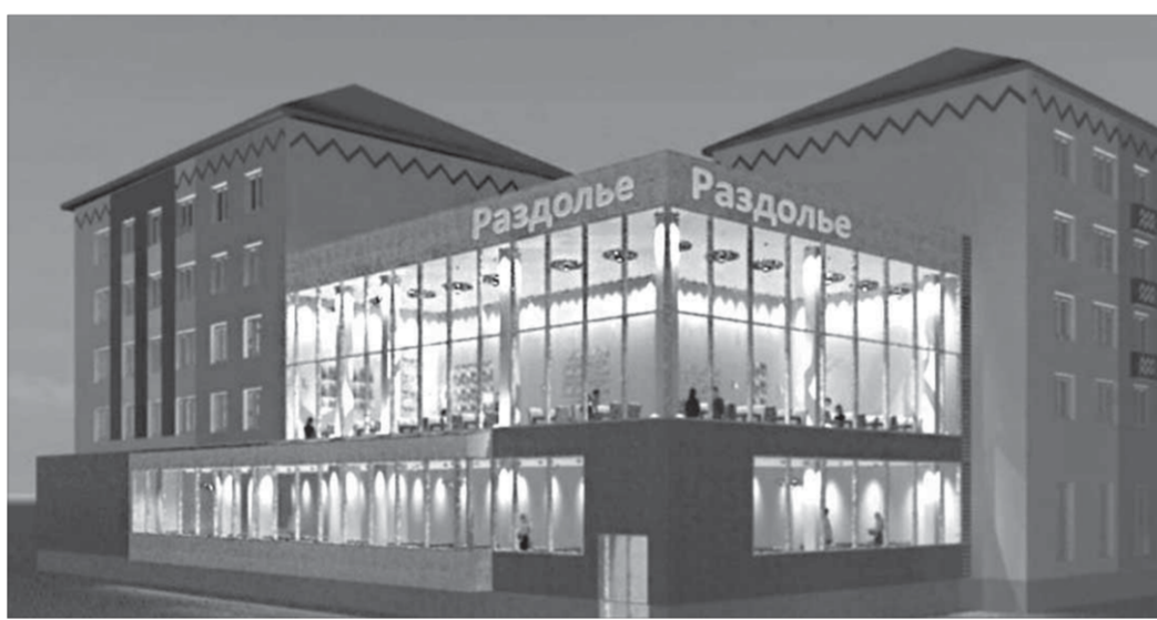
Идея нового кафе навеивает ностальгию: когда-то здесь было “От двух до пяти”

В частности, не принято решение по созданию “Аллеи славы почетных граждан города Норильска”. Члены совета и управление архи-