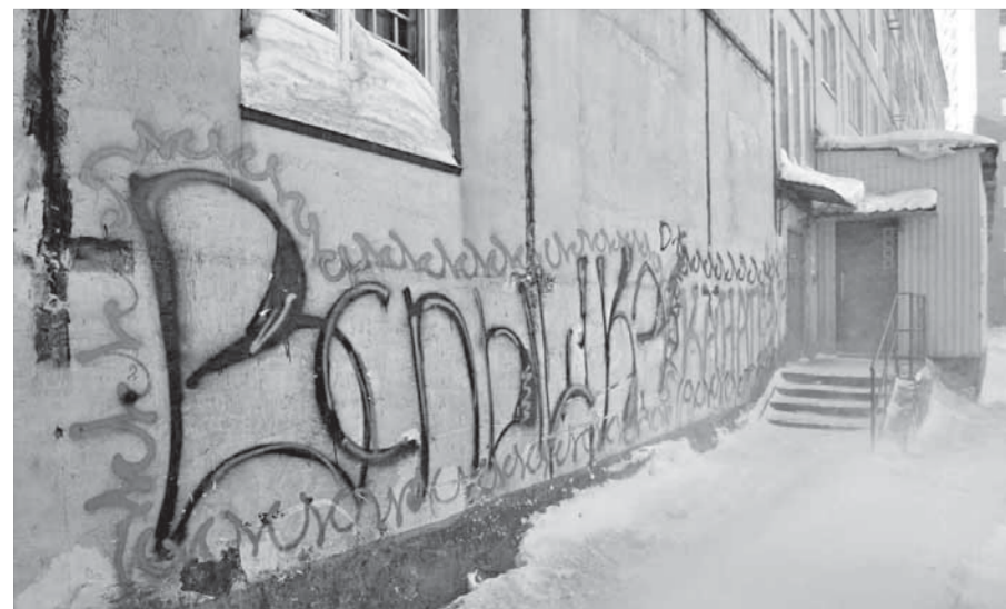
Стоит ли пачкать фасады – ремонтируют их за наш счет

Сегодня под защитой отдела вневедомственной охраны находятся свыше двух тысяч квартир и около 400 объектов здравоохранения, культуры, банки и другие учреждения.