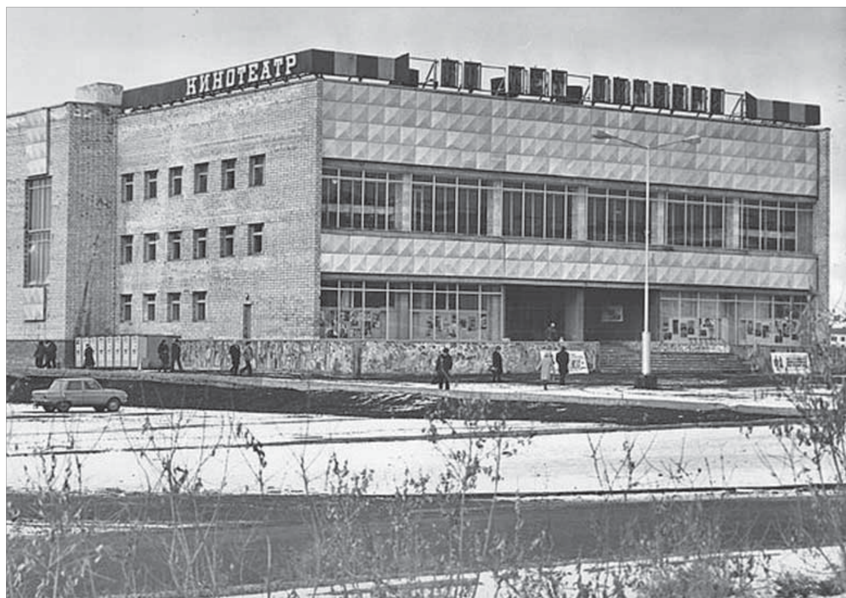
Самый большой на Таймьере кинотеатр «60 лет Октября» (нынешний «АРТ») открыли в 1977 году

Телефоны для справок 46-08-90, 46-01-75.