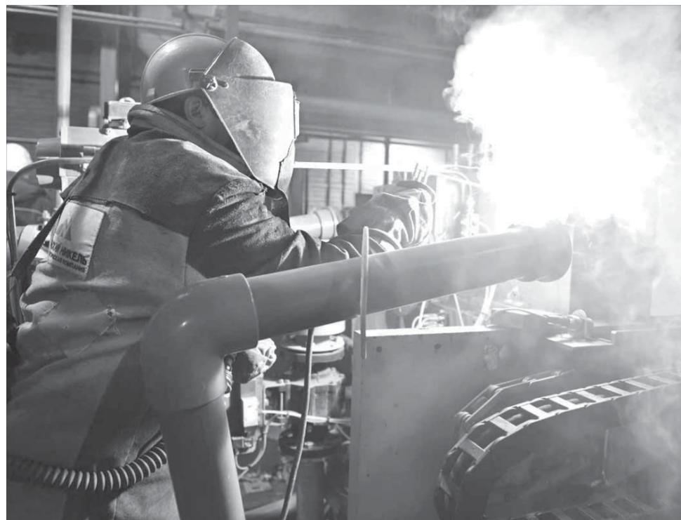
Оборудование должно быть готово к промышленной эксплуатации в конце апреля