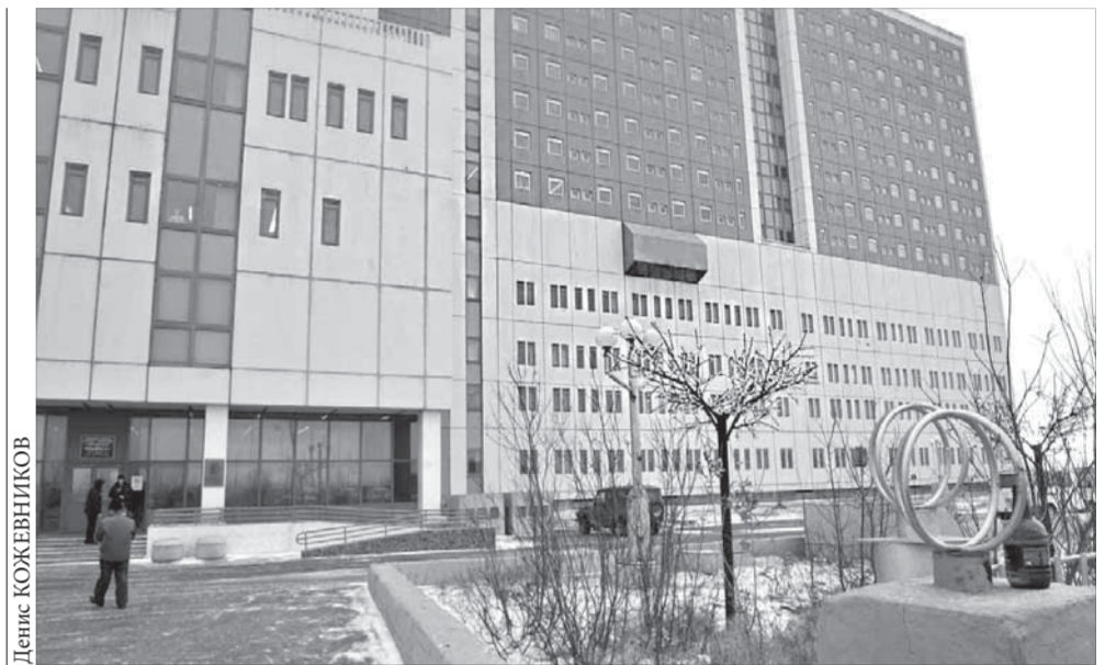
Норильск вошел в число 34 территорий России, где построят перинатальные центры