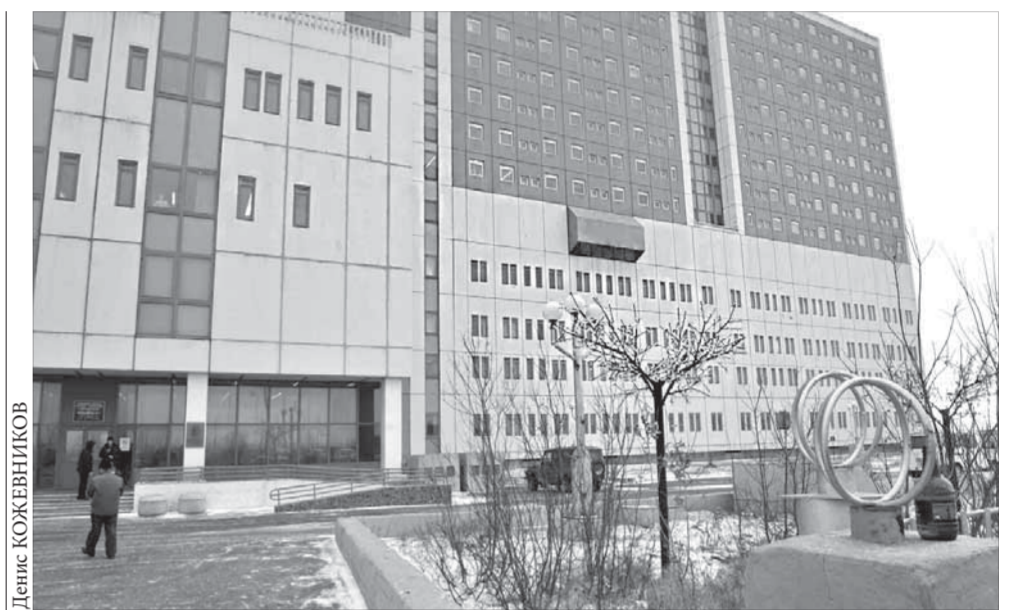
Норильск вошел в число 34 территорий России, где построят перинатальные центры