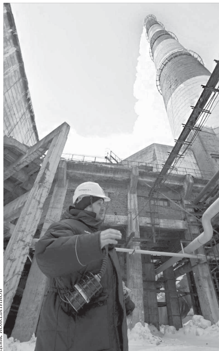
Дополнительный балл проекту принесла экологическая составляющая