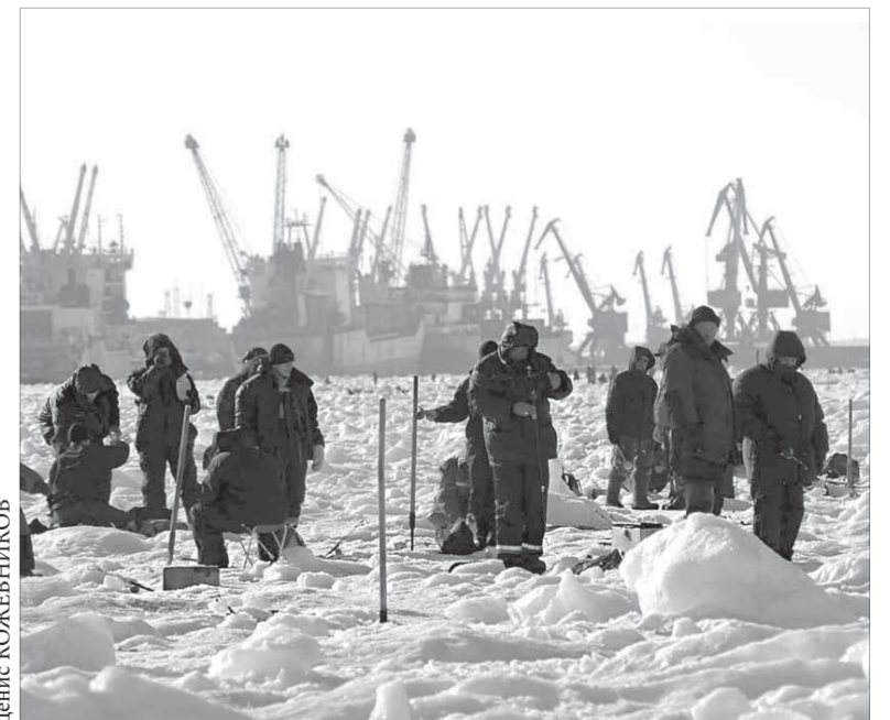
Если не будет рыбы – так и придется стоять над лунками

Курс акций ОАО "ГМК "Норильский никель" – 4830 рублей. ОАО "Полус Золото" – 916,8 рубля.