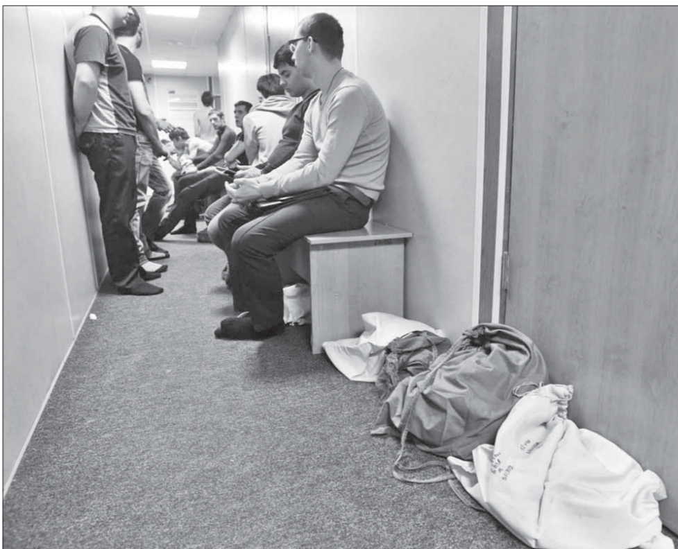
За последние несколько лет в армии произошли существенные изменения, что положительно сказалось на настроении призывников