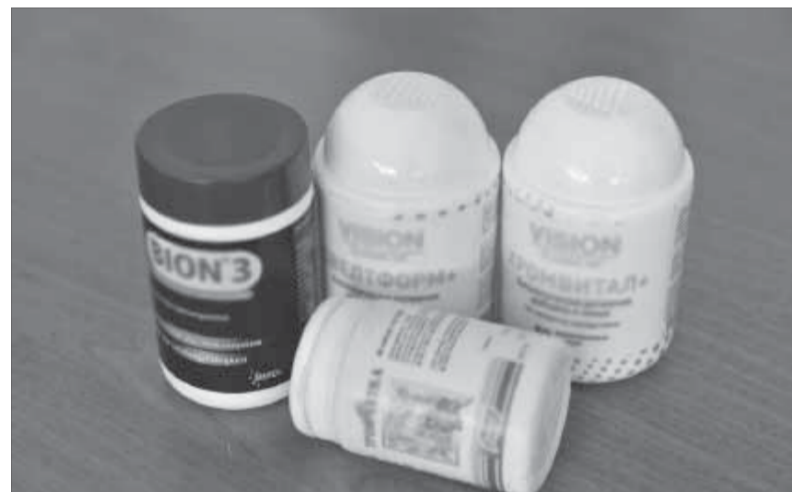
Нужно осторожно относиться к любой многообещающей таблетке