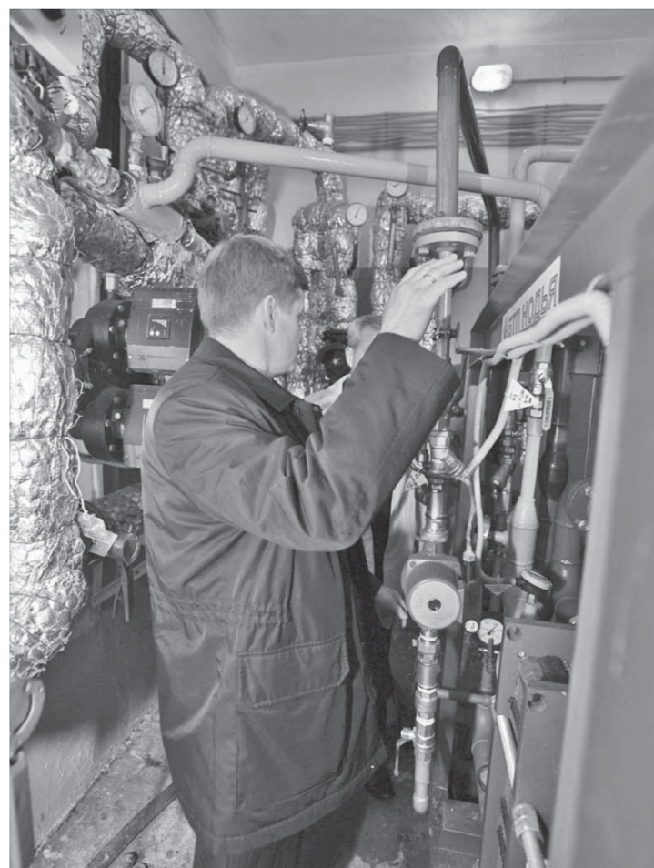
Новая технология понравилась жильцам