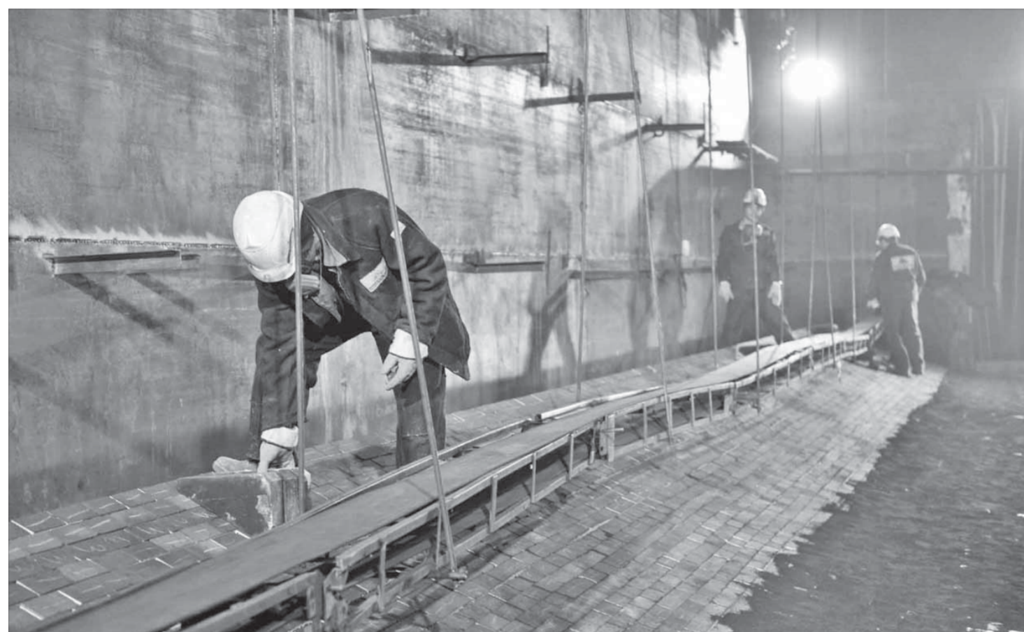
Шов кладки не должен быть больше одного миллиметра. Иначе расплав металла пройдет сквозь него