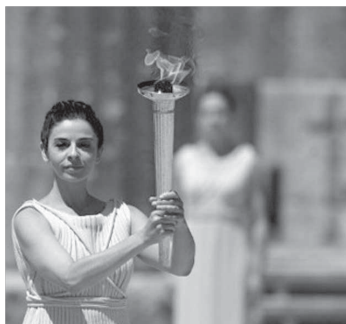
Олимпийский огонь по традиции зажигают в Греции