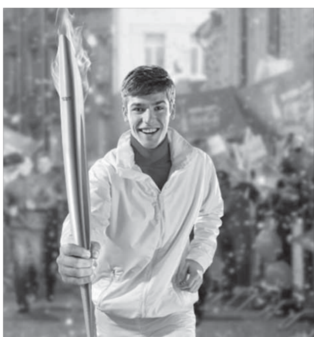
С олимпийским факелом по улицам Норильска пробегут 37 человек