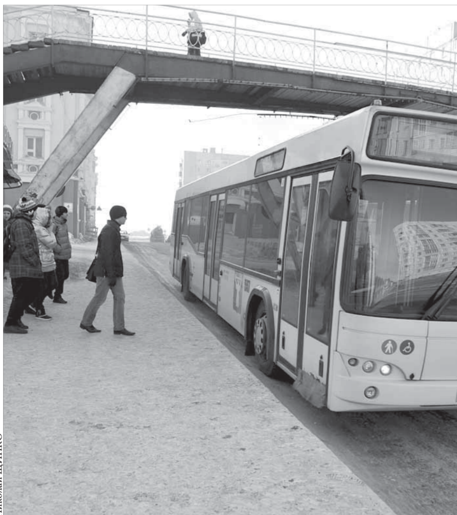
Студентам педагогического колледжа повезло – “лх” остановка теплая и вместительная