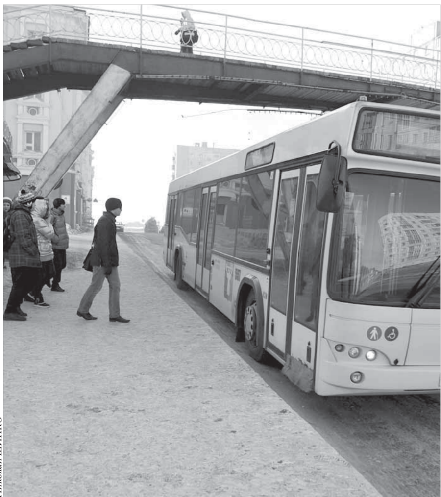
Студентам педагогического колледжа повезло – “лх” остановка теплая и вместительная