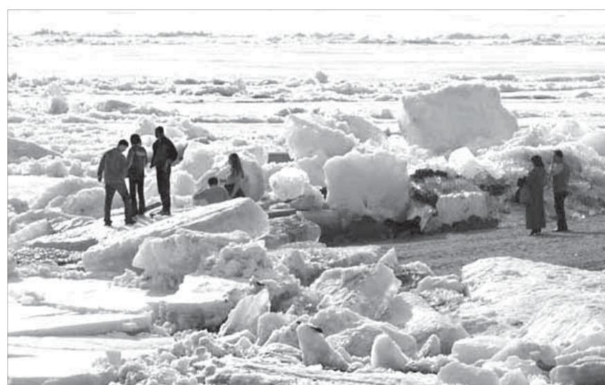
В прошлом году ледоход прошел тихо и почти незаметно