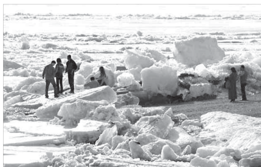
В прошлом году ледоход прошел тихо и почти незаметно

По материалам пресс-службы ГУ МЧС по Красноярскому краю подготовил Андрей СОЛДАКОВ