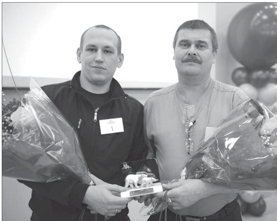
Лучшие среди лучших

По итогам конкурса профессионального мастерства на звание “Лучший наставник – слесарь по эксплуатации и ремонту газового оборудования” первое место завоевали слесари-ремонтники никелевого завода.