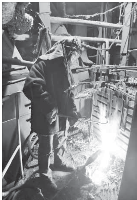
Работа с огоньком

Стабильность предприятия определяется сплоченностью коллектива, в котором каждый человек болеет за общее дело, умеет выполнять поставленные перед ним задачи.