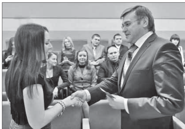
Удостоверения молодые парламентарии получили из рук главы города

Надо полагать, каждый из 15 человек, вошедших в состав совещательного органа, мечтает сделать карьеру в политике. Первую ступеньку они уже преодолели.