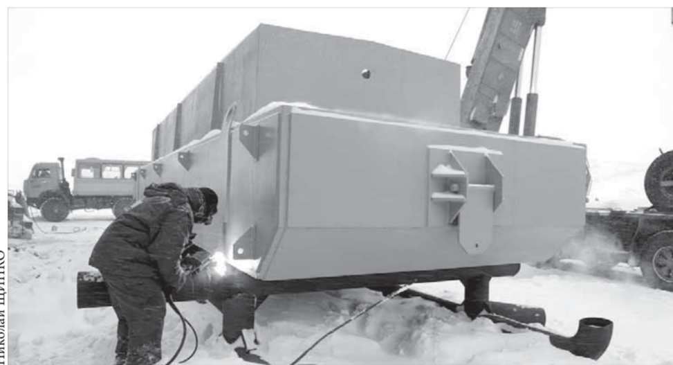
«Усы» закреплены надежно

На механическом заводе ООО «Норильский комплекс» построили «корабль».