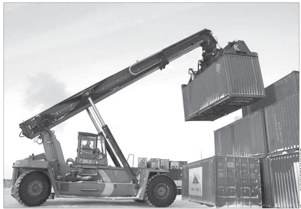
Расходы на отправку контейнеров норильчанам компенсируют