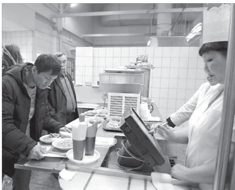
Довольны все: и работники столовой, и посетители