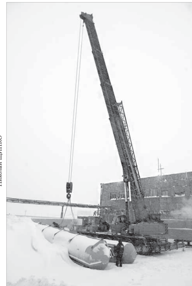
Не каждый кран поднимет 40 тонн