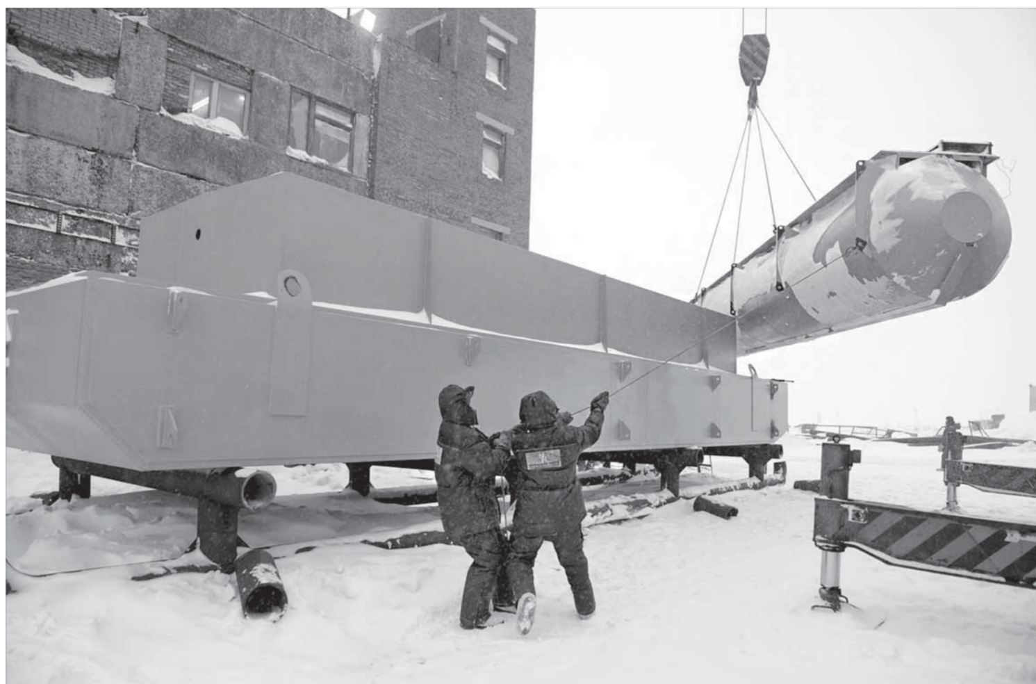
«Надежда» собирает понтон

Медиакомпания «Северный город» проводит отбор кандидатов на должность корреспондента информационного агентства. Анкету можно заполнить в приемной медиакомпании по адресу: ул. Комсомольская, 33а, 3-й этаж. Телефон 46-30-78.