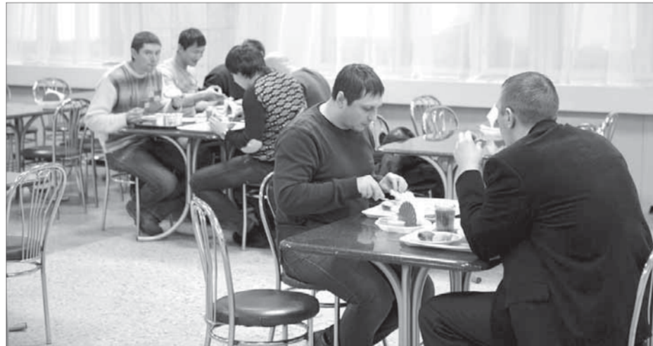
В столовой теперь комфортно. То ли еще будет

Столовая смогла стать участницей программы «Быт на производстве» только после ремонта крыши. Дело в том, что корпоративный проект предполагает об-