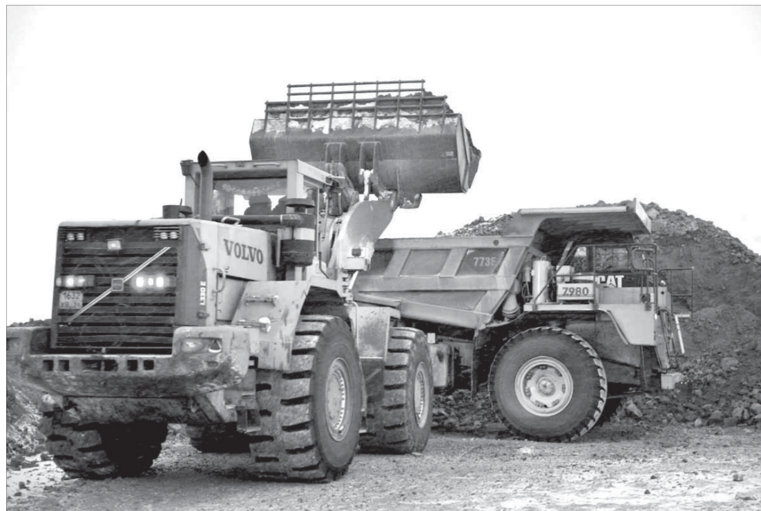
Рудник «Октябрьский» осваивает новую схему доставки руды