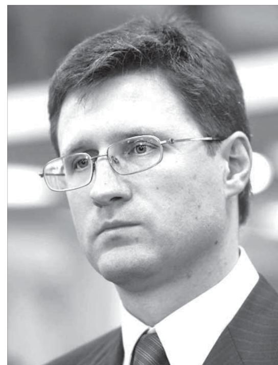
Трудовая биография министра энергетики началась в Норильске

Предполагается, что удостоверение почетного гражданина, диплом и нагрудный знак будут вручены Александру Новаку во время празднования 60-летия присвоения Норильску статуса города. Нового почетного гражданина пригласят на юбилейные торжества.