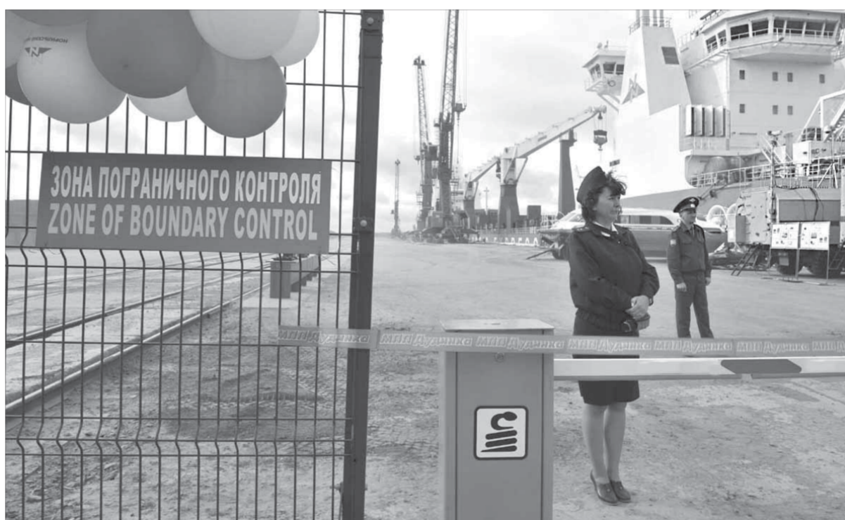
Стражи экономической безопасности России