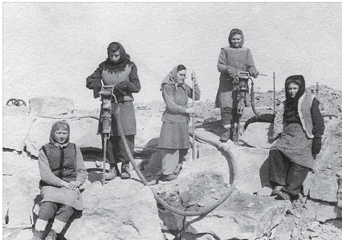
Женщины-узницы на работе

Например, дисциплину и трудолюбие у «политических», классово чуждых эзка, которых было большинство, поддерживали с помощью уголовников, «социально близких» власти заключенных.