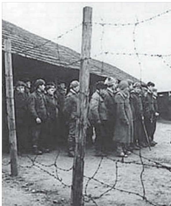
Официально Норильлаг прекратил существование в 1956 году

Курс акций ОАО “ГМК “Норильский никель” – 5974 рубля. ОАО “Полюс Золото” – 1246 рублей.