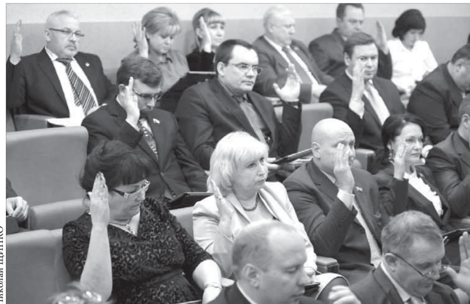
Проголосовали за тишину

“Девятичасовую” тишину предложили установить норильские депутаты. В ходе обсуждения краевого Закона “Об административных правонарушениях” они внесли поправку, устанавливающую, что с 21 до 9 часов нельзя громко включать музыку и телевизор, делать ремонт в квартире и производить другие действия, нарушающие покой граждан. Это предложение в октябре прошлого года было направлено в Законодательное собрание, и в числе поправок, поступивших из других регионов края, его внесли во вторую редакцию документа. Вчера на сессии городского совета депутаты поддержали законопроект с некоторыми уточнениями.