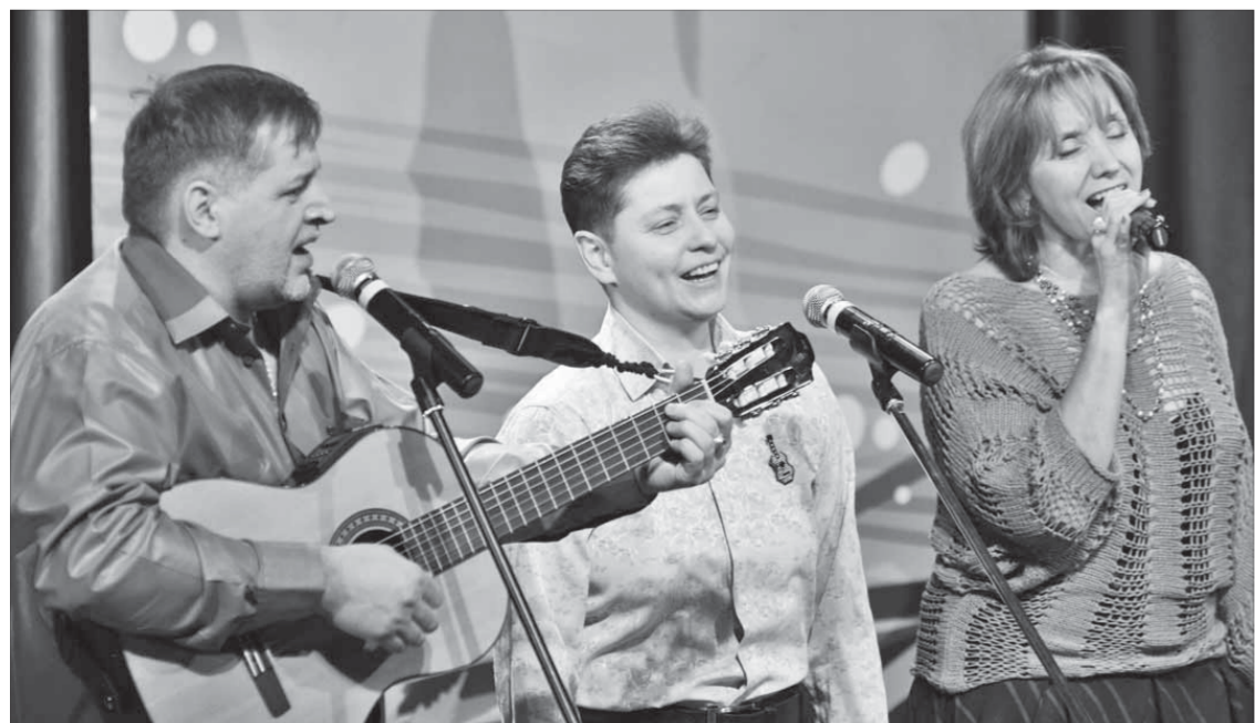
Юбилейный разговор на языке песен

На праздник принято делать подарки. Первый сделала певица Валерия, не приехавшая в Норильск, благодаря чему поклонники авторской песни смогли собраться в Большом зале Городского центра культуры, а не в Малом, как ранее планировалось, и с размахом отметить день рождения одного из самых популярных в Норильске творческих объединений.