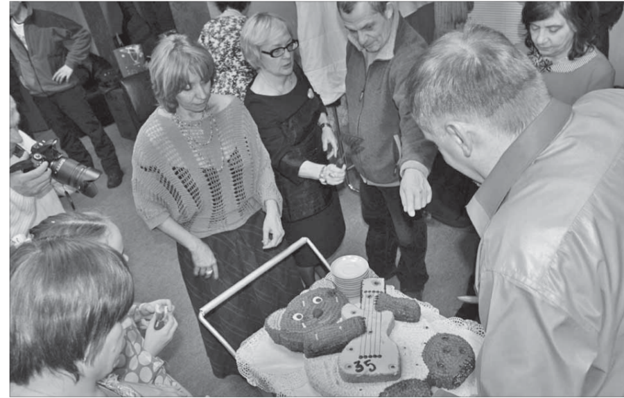
Тортом сначала налюбовались, потом съели