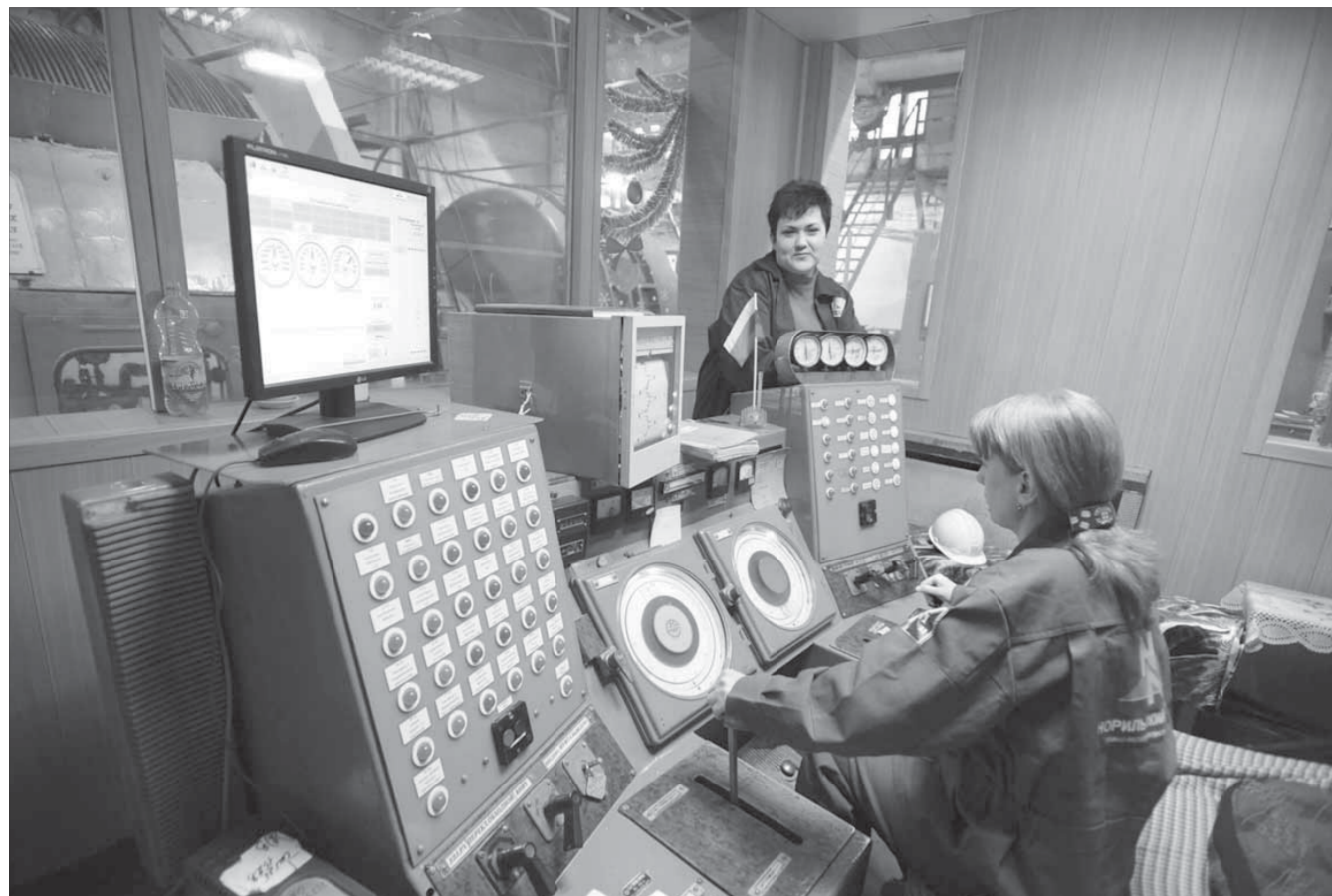
Операторы подъемной машины ствола