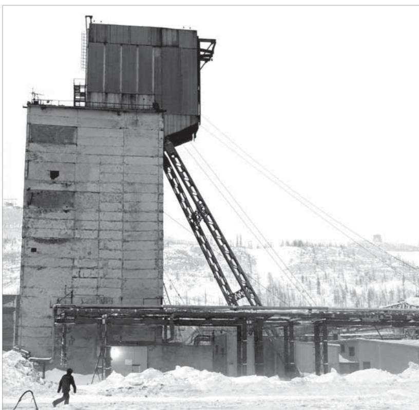
С ВСС началась рудник “Октябрьский”