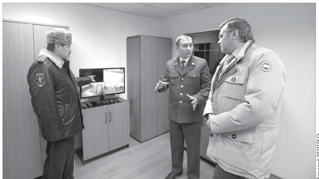
Новый пункт полиции – большая заслуга жителей Оганера

Стоит отметить, что Норильск стал лучшим среди участников по своей группе территорий, в которую также вошли Таймырский, Туруханский и Эвенкийский районы. На реализацию проектов всех четырех муниципальных образований было предусмотрено 2 млн рублей, из них большую часть средств – 58,1% (1,1 млн рублей) – выделили Норильску.