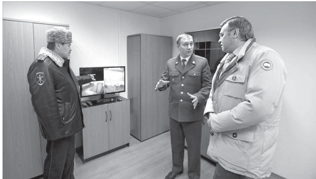
Новый пункт полиции – большая заслуга жителей Оганера

Стоит отметить, что Норильск стал лучшим среди участников по своей группе территорий, в которую также вошли Таймырский, Туруханский и Эвенкийский районы. На реализацию проектов всех четырех муниципальных образований было предусмотрено 2 млн рублей, из них большую часть средств – 58,1 % (1,1 млн рублей) – выделили Норильску.