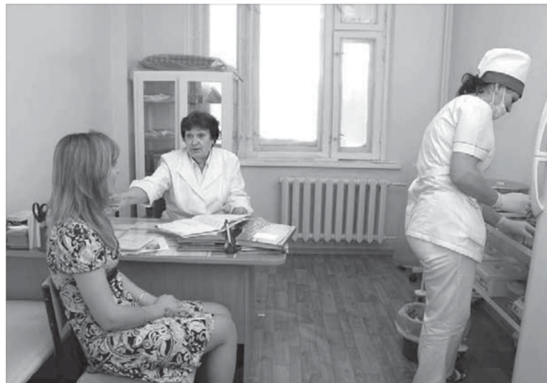
Главное – выявить заболевание на ранней стадии

Всеобщая диспансеризация, с одной стороны, обязательна. Но с другой стороны, никто не сможет заставить гражданина пройти данное обследование без его желания.