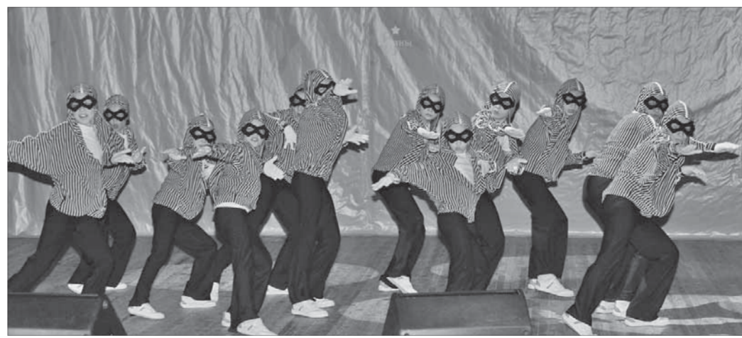
Ярко и сильно выступил на фестивале ансамбль "Шкода"