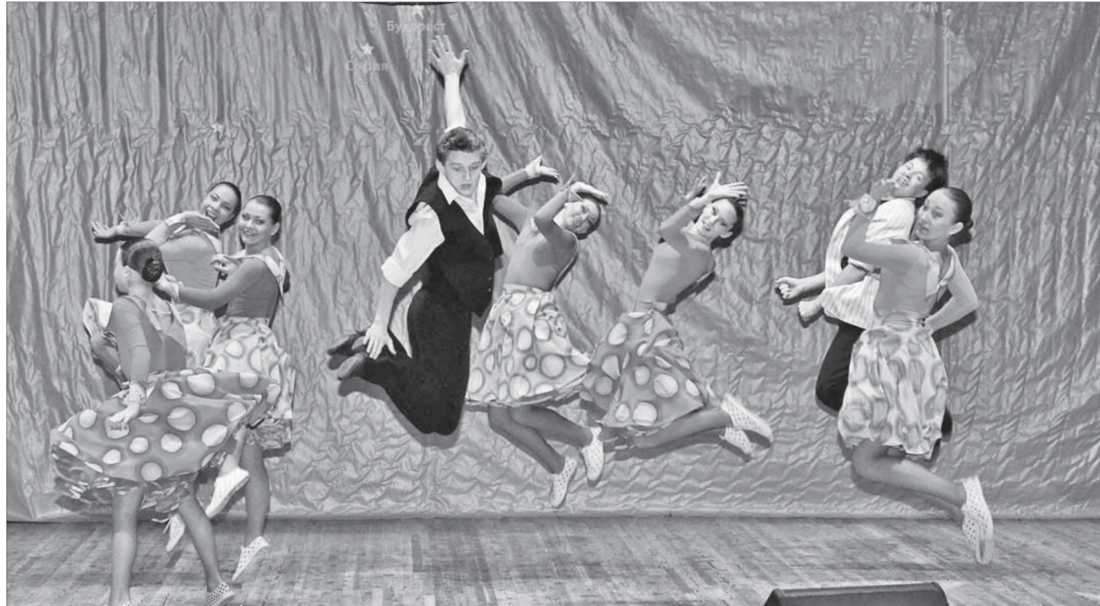
В "Болеро" модернизировали рок-н-ролл