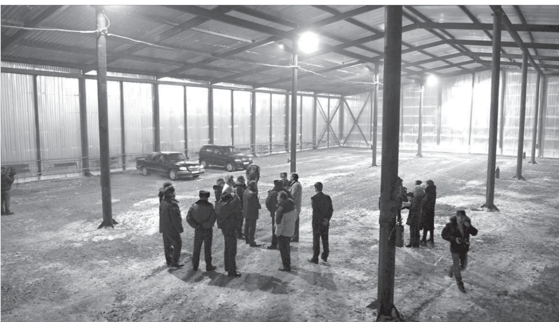
На полутора тысячах квадратных метров места хватит всем