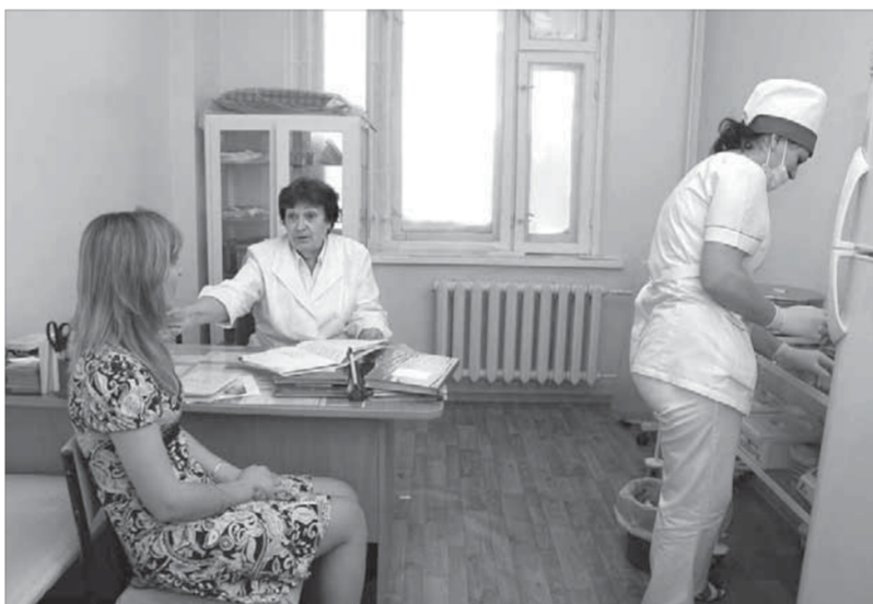
Главное – выявить заболевание на ранней стадии

Всеобщая диспансеризация, с одной стороны, обязательна. Но с другой стороны, никто не сможет заставить гражданина пройти данное обследование без его желания.