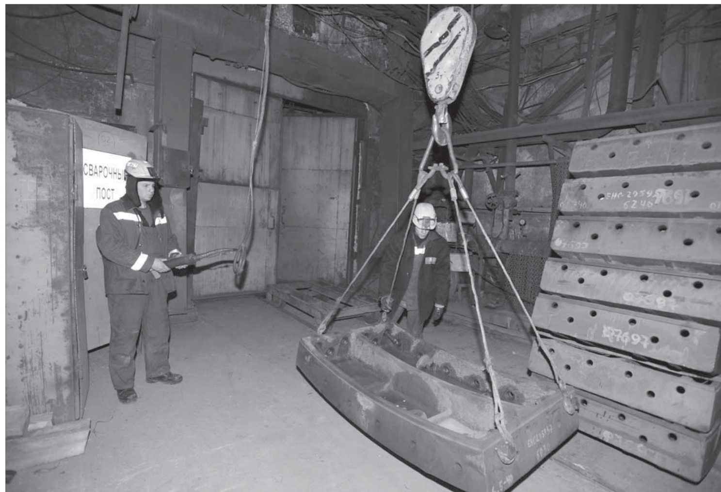
Ремонтные работы у грузовой клетки ствола