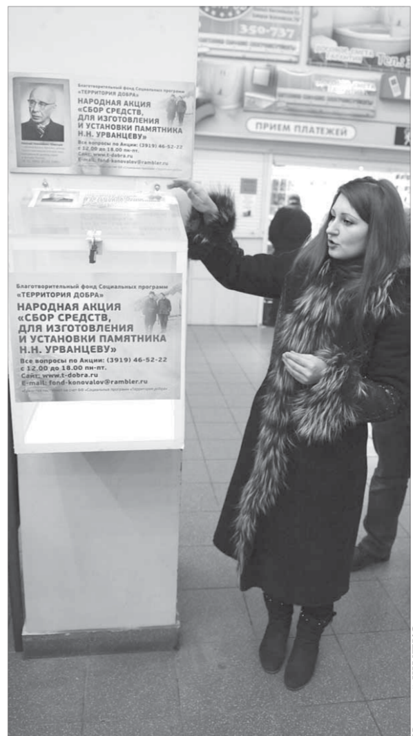
Здесь проводится народная акция