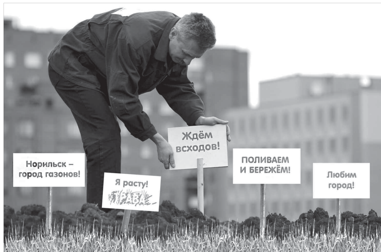
Немного юмора в хорошем деле никогда не повредит