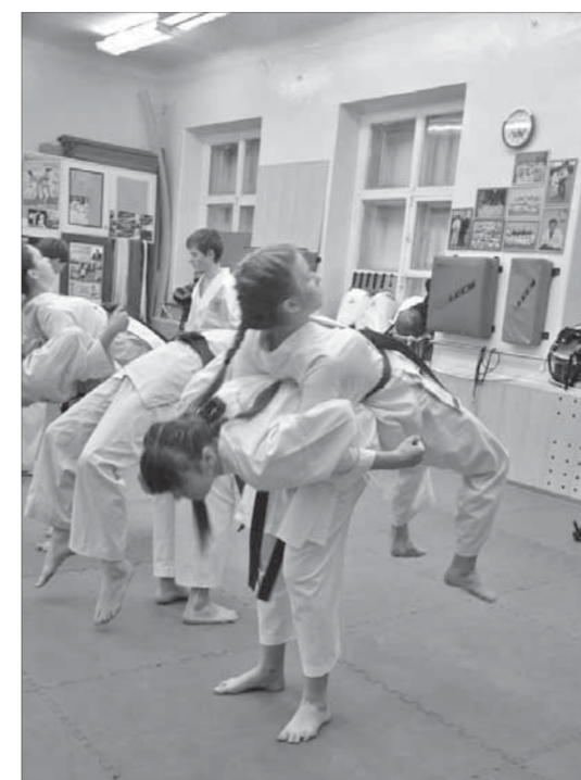
У девочек свои планы на карате

Матч женских команд пройдет в "Арктике" 3 марта. Предварительное время – 14.00.