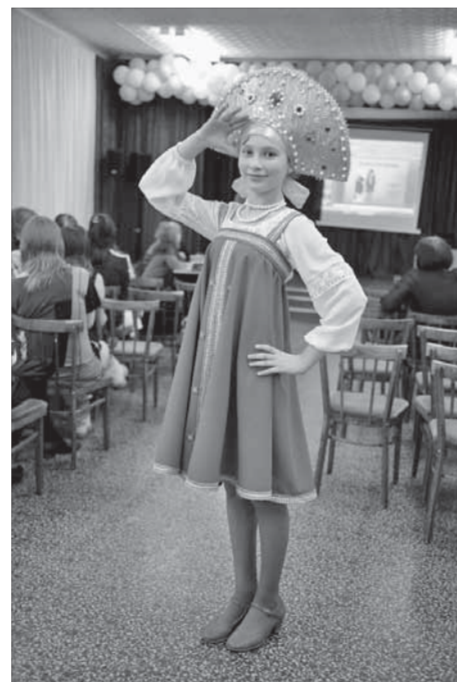
Русский свадебный костюм был таким