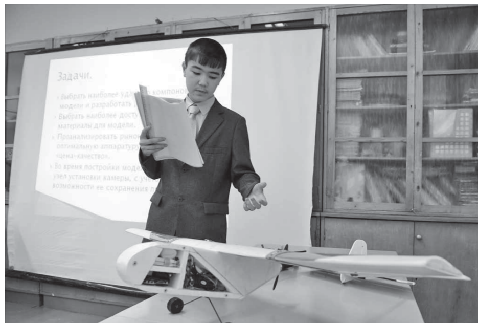
Радиоуправляемая модель пригодится для аэрофотосъемки

Аттестаты об основном общем образовании и полном общем образовании с отличием будут одинаковыми — красного цвета (раньше цвета были разные — зеленый и вишневый). Размер аттестата в развороте, ранее составлявший 215x305 мм, теперь будет составлять 233x163 мм.