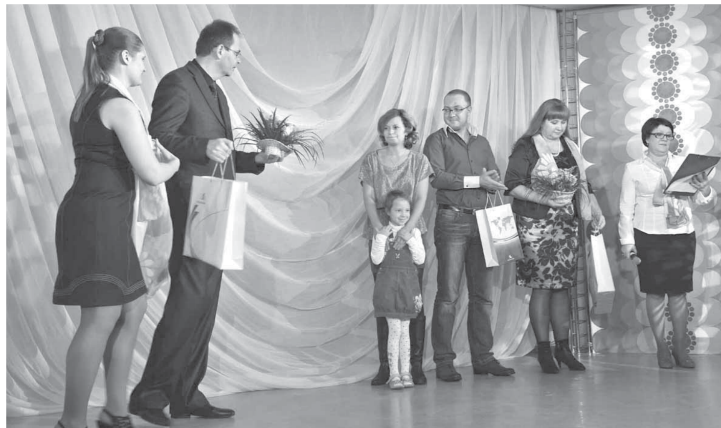
Коллеги приветствуют семью Заморских