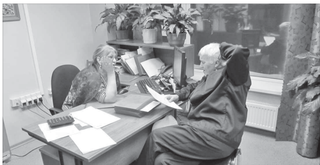
Отношение к работе – неформальное