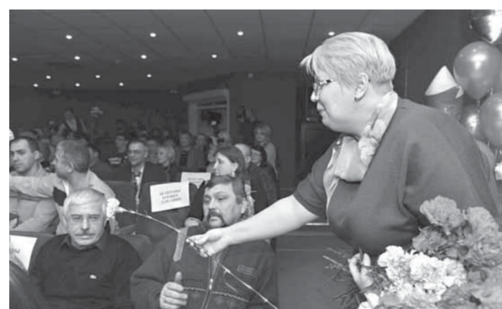
Цветы от "Женского взгляда"