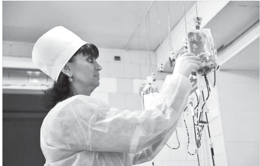
За 2012 год было заготовлено более четырех тонн крови