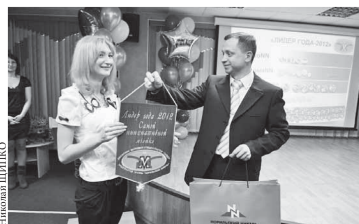
Молодые специалисты настроены на развитие