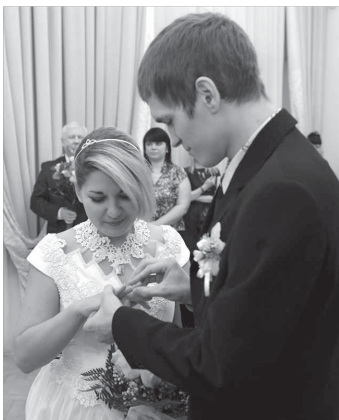
Трудно совладать с волнением