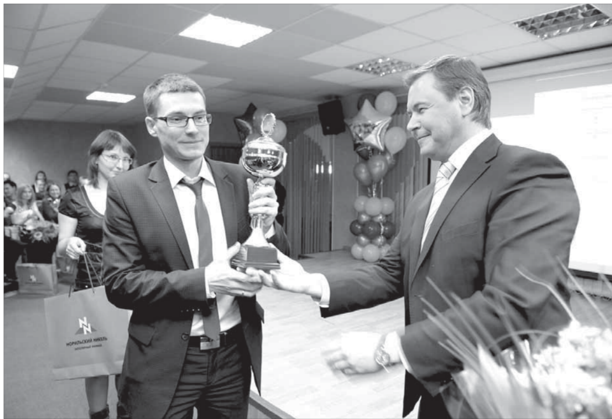
Активность молодых специалистов оценили по достоинству