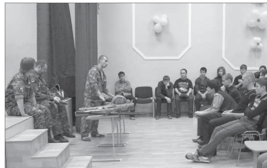
Старшеклассники с интересом посещают уроки патриотического воспитания

Курс акций ОАО "ГМК "Норильский никель" – 5960 рублей. ОАО "Полюс Золото" – 966,5 рубля.