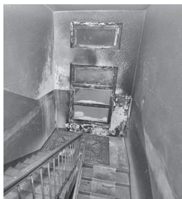
Новые стекла вставили оперативно

– В этом случае уже разбирательств никаких не будет, как говорится, не пойман – не вор, и доказать,