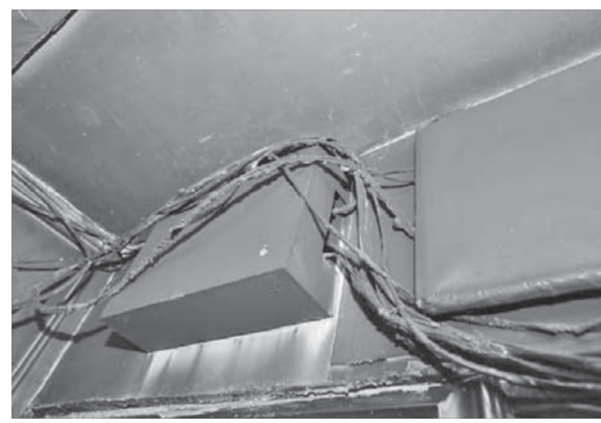
Проводка нуждается в замене