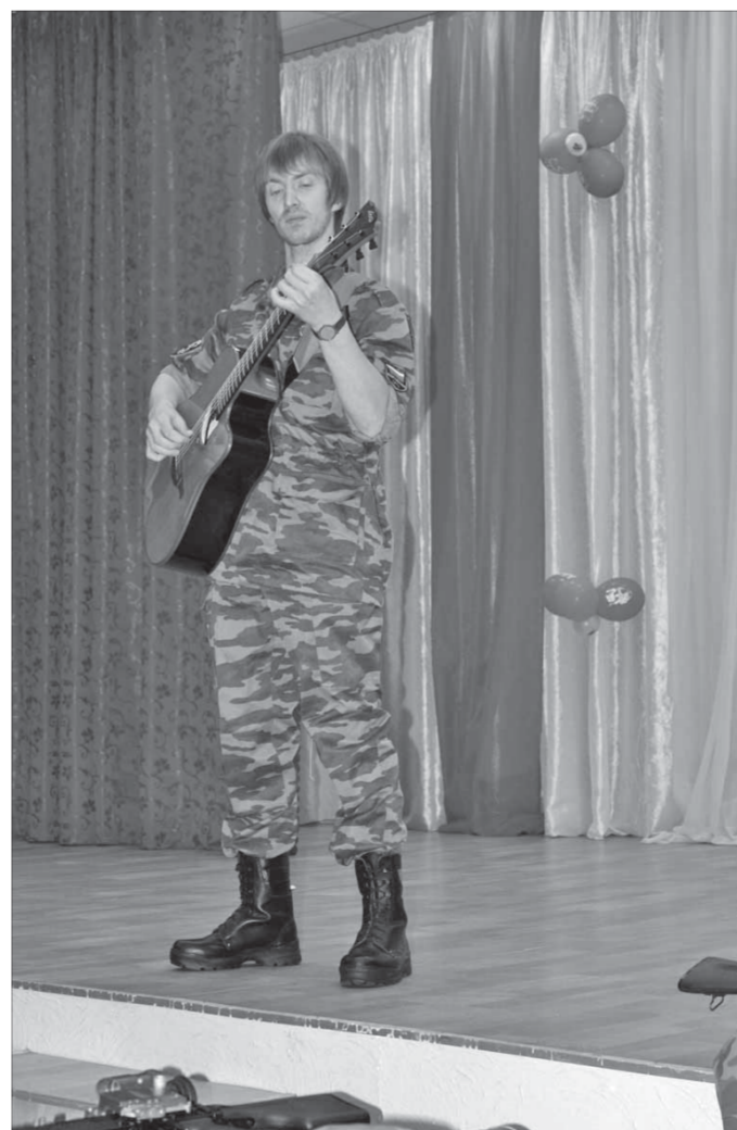
Солдатские песни под гитару – лучший способ достучаться до сердец

Отдел по работе с населением управления социальной политики администрации города Норильска осуществляет выдачу справок для оформления социальной стипендии и других видов социальной помощи учащимся федеральных государственных образовательных учреждений начального профессионального образования, студентам федеральных государственных образовательных учреждений высшего и среднего профессионального образования, обучающимся по очной форме обучения. Право на получение социальной стипендии и других видов социальной помощи имеют студенты из малообеспеченных семей, среднедушевой доход в которых не превышает величину прожиточного минимума, установленную правительством Красноярского края для северных территорий в соответствии с социально-демографическими группами членов семьи.