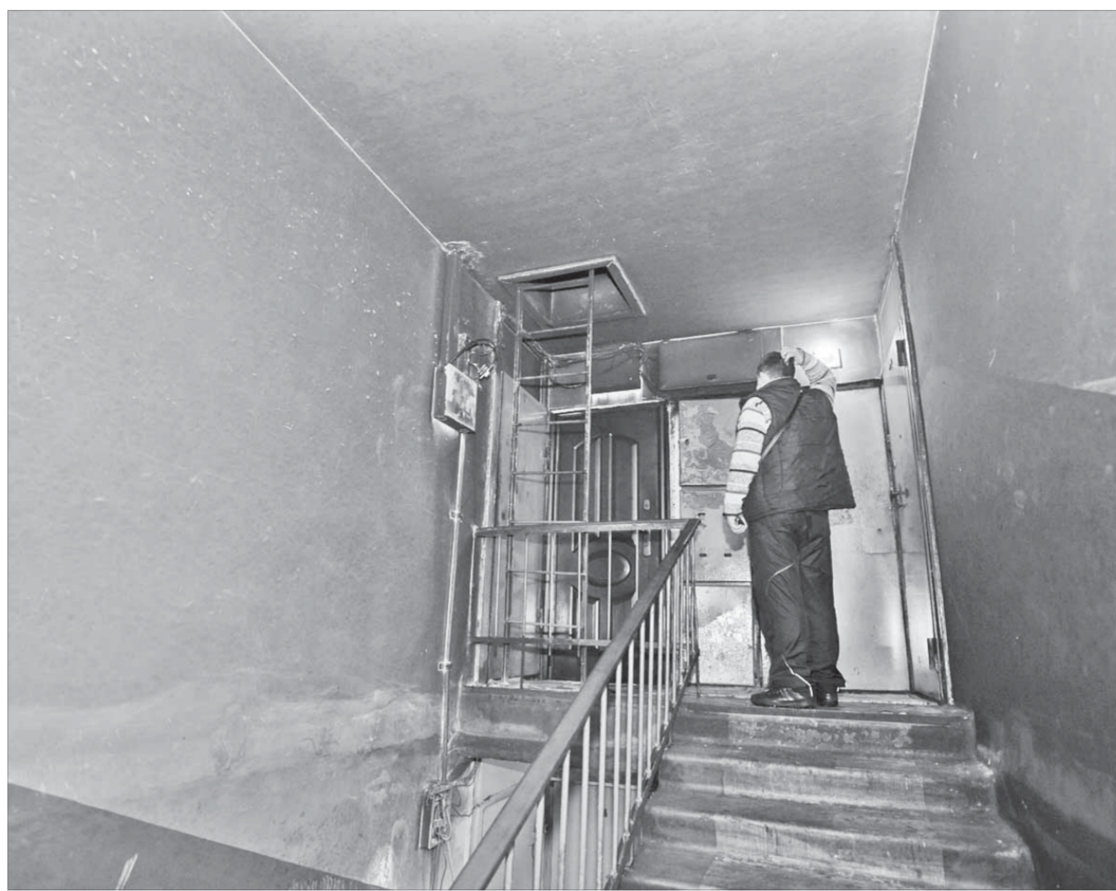
Диван и ковер сторели дотла