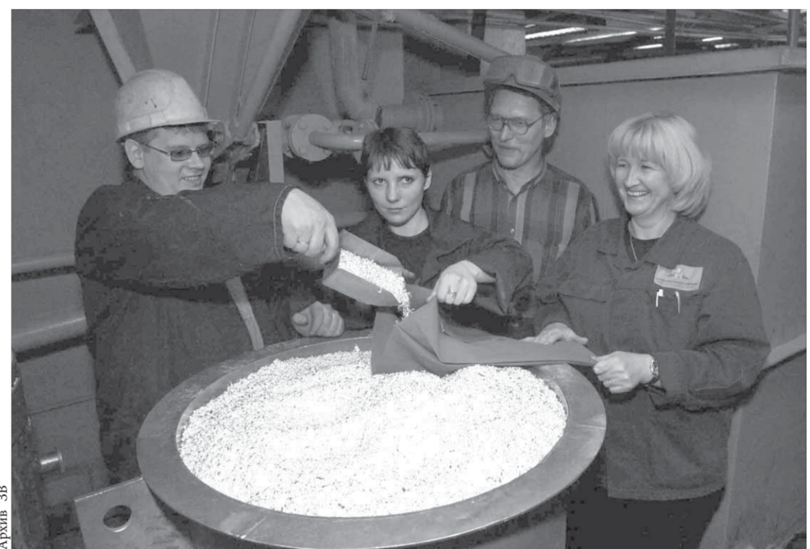
Серебром в гранулах Норильск уже не удивишь, на очереди золотые, палладиевые и платиновые слитки