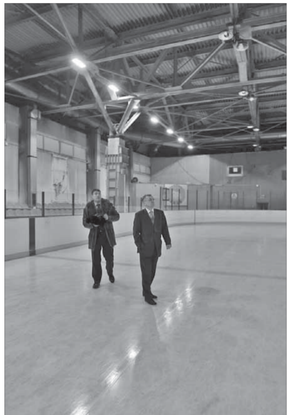
У проверяющих нареканий нет

Одним из объектов, где было установлено новое освещение, стал каток "Умка" в Талнахе. Раньше ледовое поле освещали дуговые ртутные лампы (ДРЛ).