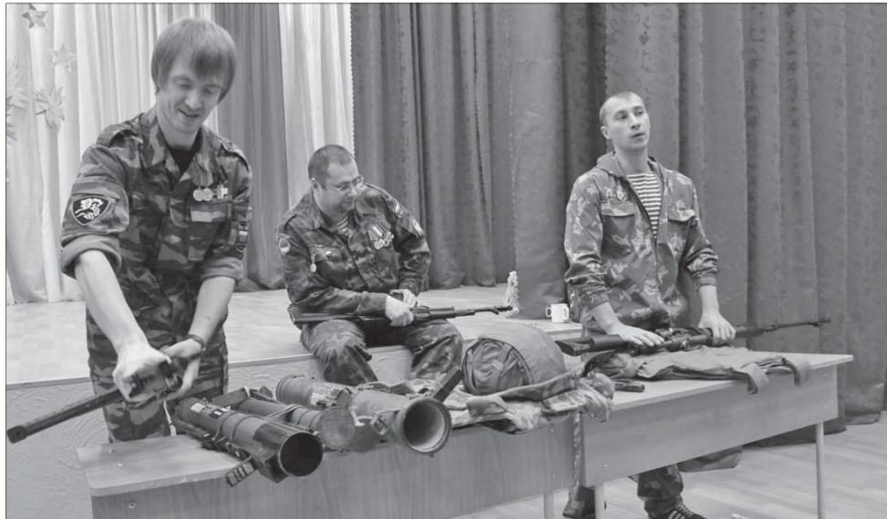
На классные часы бывшие солдаты приносят макеты оружия

тов. Юноши с огромным любопытством изучают макеты оружия. Всем интересно подержать в руках пусть даже ненастоящие пистолеты, винтовку и гранатомет. Не без интереса разглядывают оружие и старшечки-классники. Все с удовольствием примеряют настоящие бронезилицы.