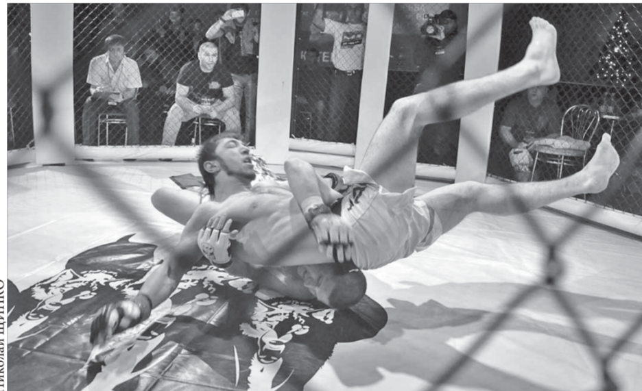
Зрелищность поединков – вне сомнений