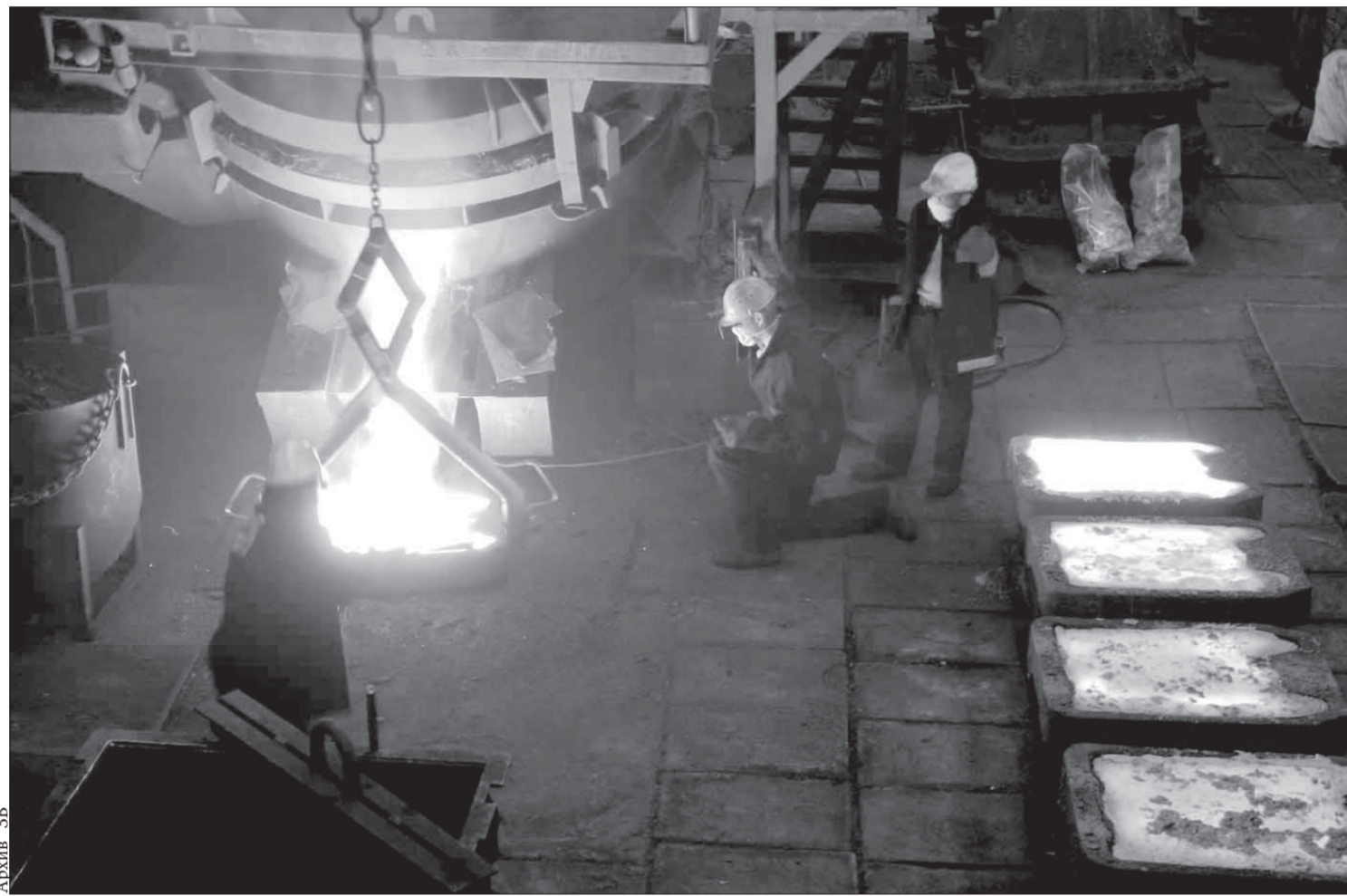
Характерной чертой технологии металлургического цеха является его многооперационность

Серией мужских встреч стартовали соревнования по волейболу в зачет 52-й спартакиады Заполярного филиала. Традиционно основной площадкой волейбольных баталий является спортивный комплекс БОКМО. Всех желающих насладиться волейболом здесь ждут с 14.30 по субботам и с 12.30 по воскресеньям.