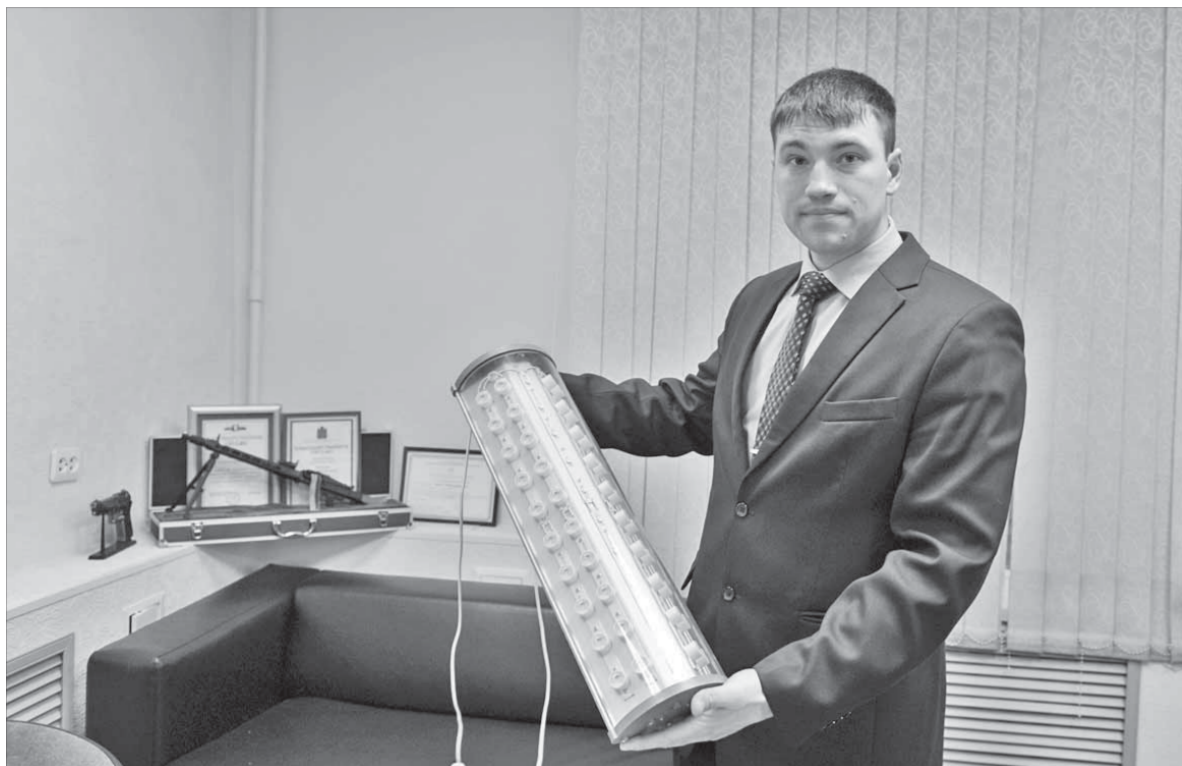
Единственный минус светодиодных светильников – цена