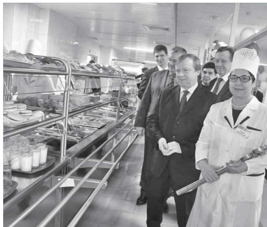
Для посетителей столовая распахнет свои двери в середине января