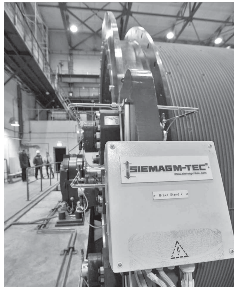
По оценке специалистов, Seimag – совершенное оборудование