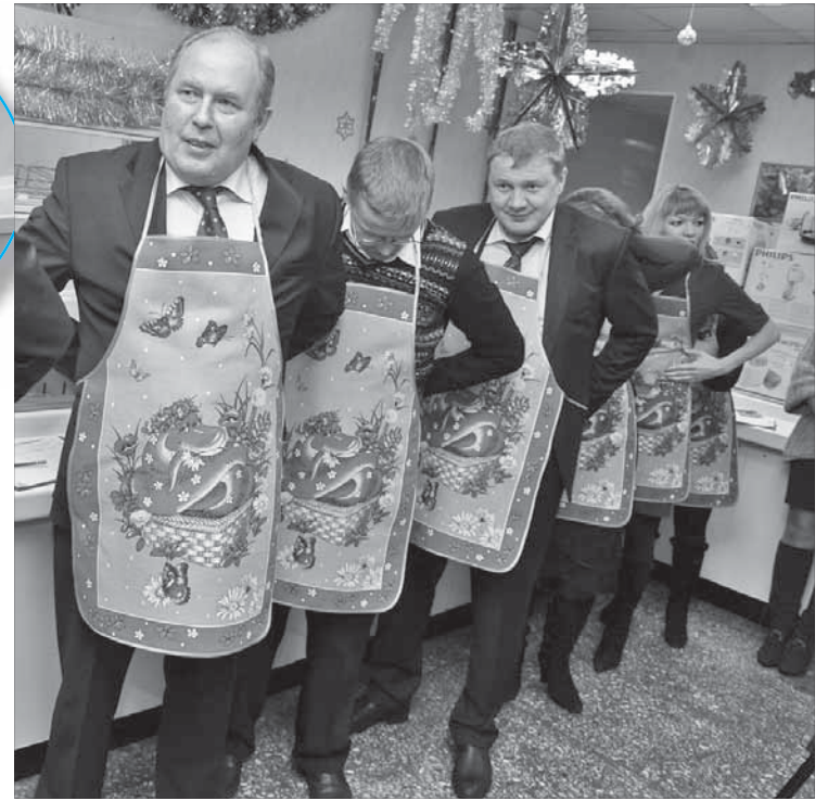
Быть в жюри такого конкурса и увлекательно, и вкусно

– В райском саду должно быть много фруктов и ягод, – говорит она. – Мы использовали малину, клубнику, бруснику, кумкват. Украсили композицию листиками свежей мяты. Из редьки и моркови сделали павлина. Добавили вафельно-сливочные “райские яблочки” и, конечно, змея-ис-