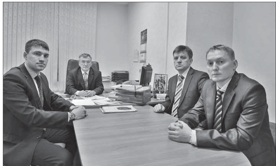
Сильная половина отдела энергетика