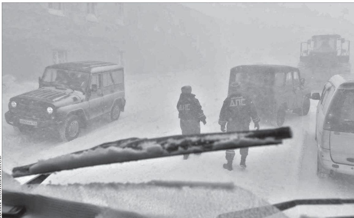
Разбирательство с транспортом