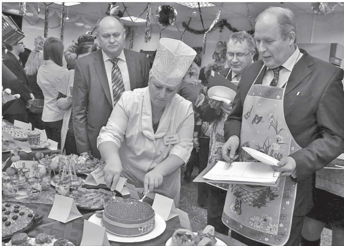
“Лукошко икры” все попробовать захотели

Победителям достались призы от компании “Норильскгазпром”. Гости конкурса, устроив репетицию новогоднего застолья, попробовали все кушанья, которые им понравились. По традиции некоторые из представленных на конкурсе блюд займут центральное место на праздничных столах газовиков в главную ночь наступающего года.