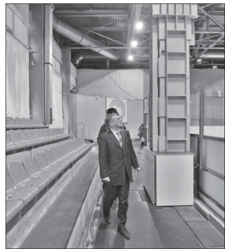
Установка светодиодных светильников под контролем специалистов

– Профессиональный праздник энергетиков – это день, который объединяет множество людей. Ведь кто такие энергетика? Это не просто люди одной специальности! Это специалисты многих профессий, цель которых одинакова: нести людям тепло и свет. И эта миссия делает профессию энергетика и романтической, и величественной, и очень ответственной. Поэтому хочется пожелать в этот замечательный праздник, дорогие коллеги, чтобы тепла и света хватало и в доме, и в семье. Чтобы труд был достоин оценен. Пусть все задуманное сбывается и жизнь улыбается чаще!