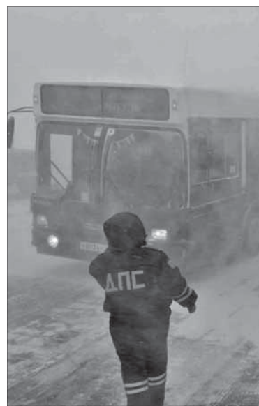
ДПС на посту

До установки светофоров на пересечении второстепенных дорог с главной в качестве временной меры решено разместить дорожные знаки, запрещающие выезд в определенных условиях. Администрация города рассчитывает на понимание со стороны руководителей предприятий, расположенных в этой части промплощадки, и призывает их проводить разъяснительную работу с сотрудниками.