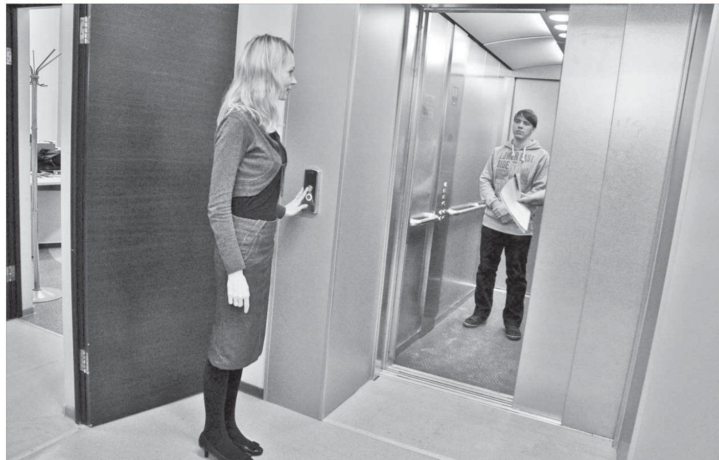
Новый лифт – радость для журналистов