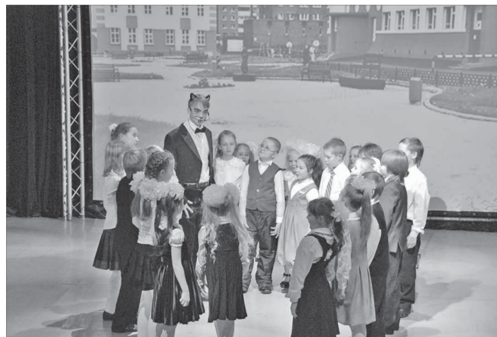
И Кот, и все артисты в гимназии - ученики

Гимназия №4 - одно из инновационных учебных заведений города, которое дает качественное образование. Педагогический коллектив гимназии - лауреат всероссийских конкурсов "Школа года", "Академическая школа", "Лучшие школы России", двукратный победитель национального проекта "Образование". Недавно в стенах Городского центра культуры гимназия отпраздновала свой двадцатилетний юбилей.