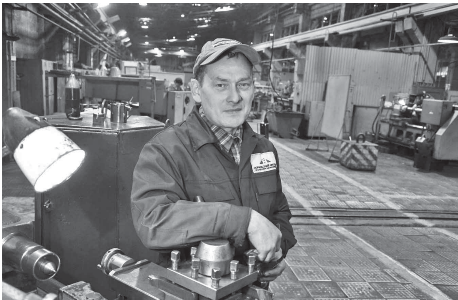
Героев нужно знать в лицо