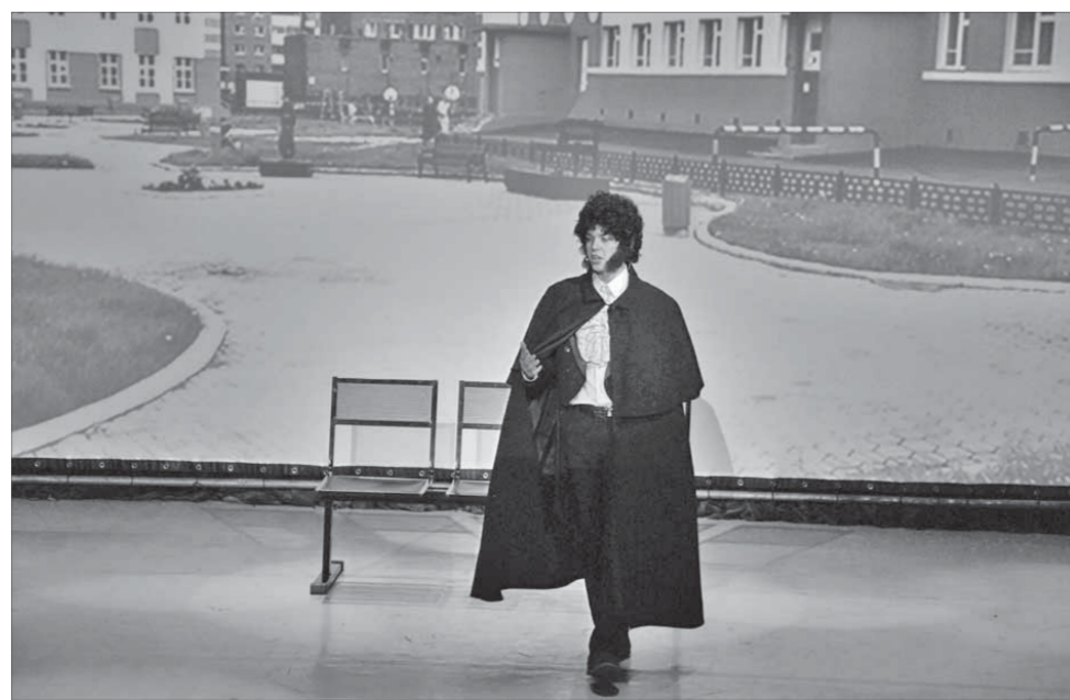
Главным персонажем мюзикла стал светоч отечественной литературы

Выпускному классу праздник запомнился больше всего, ведь учебный год для них в школе последний. Одиннадцатые классы пожелали своей "четверке" процветания, долгих лет, удачи, счастья, спсобных учеников, благополучия, успеха, новых побед. А учителями - оставаться такими же добрыми, позитивными, терпеливыми и, конечно, любимыми.