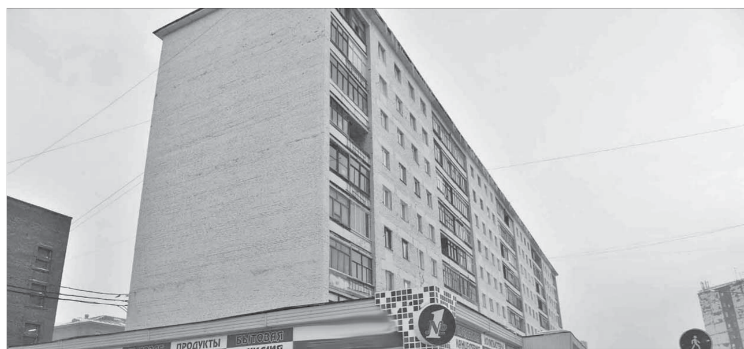
Потерпеть три недели