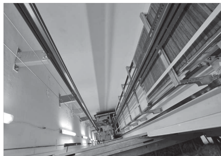
Заново восстановленная шахта лифта