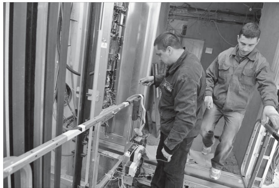
Монтаж нового лифта