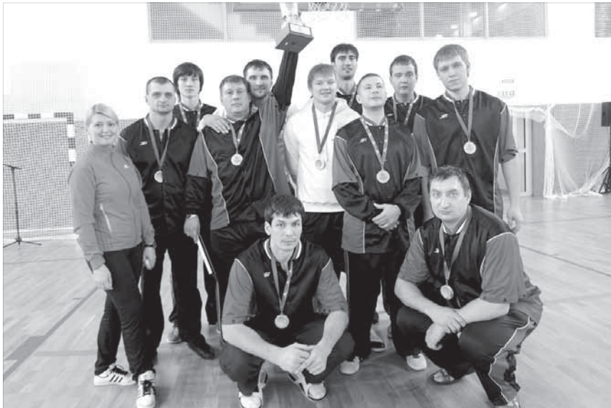
Наши привезли в Сочи баскетбол

В Сочи завершился корпоративный турнир среди команд группы ГМК "Норильский никель" по баскетболу.