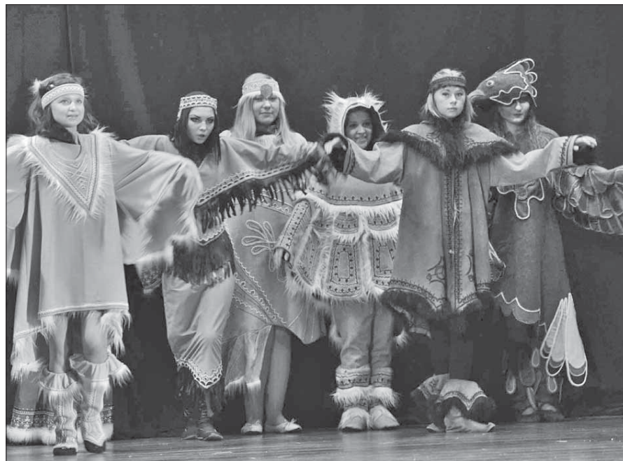
О Севере любимом