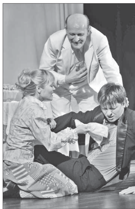
Дудинцы Чехова играют