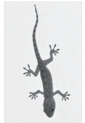
Вдруг это заколдованный принц?

Китайцы ничего не понимают, думают, что ребенок играет. Мы давимся от смеха на берегу, а с моря доносится бодрое: “Я тону... нихао... сесе”.