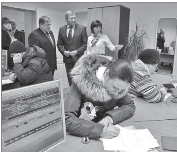
Прием граждан идет по принципу одного окна