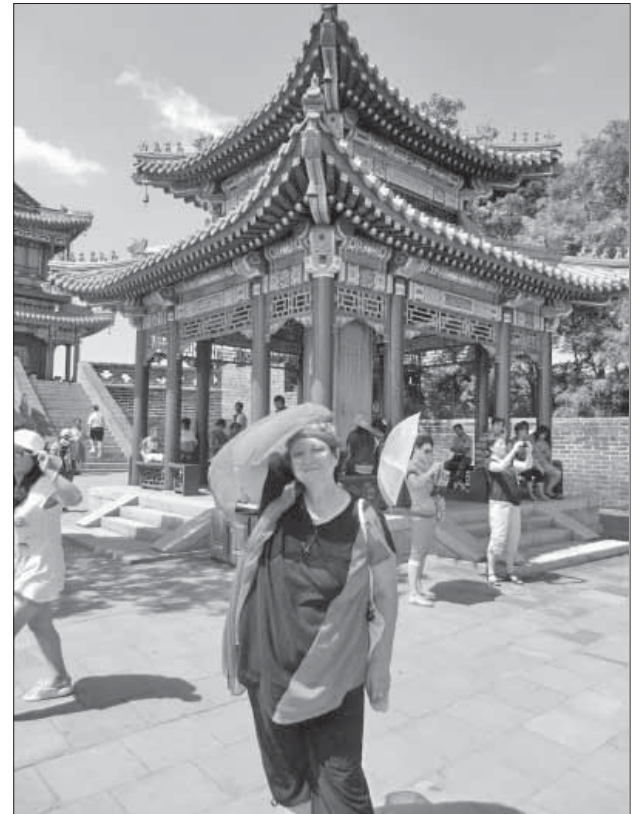
Великая китайская жара