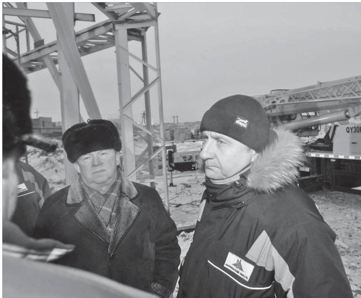
Директор ЗФ оценил темпы реконструкции на предприятиях

По плану реконструкция скипового ствола №3 должна завершиться в июле следующего года. Стоимость работ – более двух миллиардов рублей.