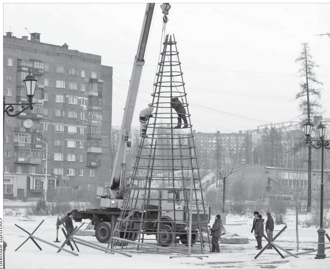
Установкой елки в Талнахе в этом году занимается ООО "Талнахты"

По предварительной версии, причиной трагедии стала детская шалость: когда пенсионер уснул, мальчик взял зажигалку и начал с ней играть.