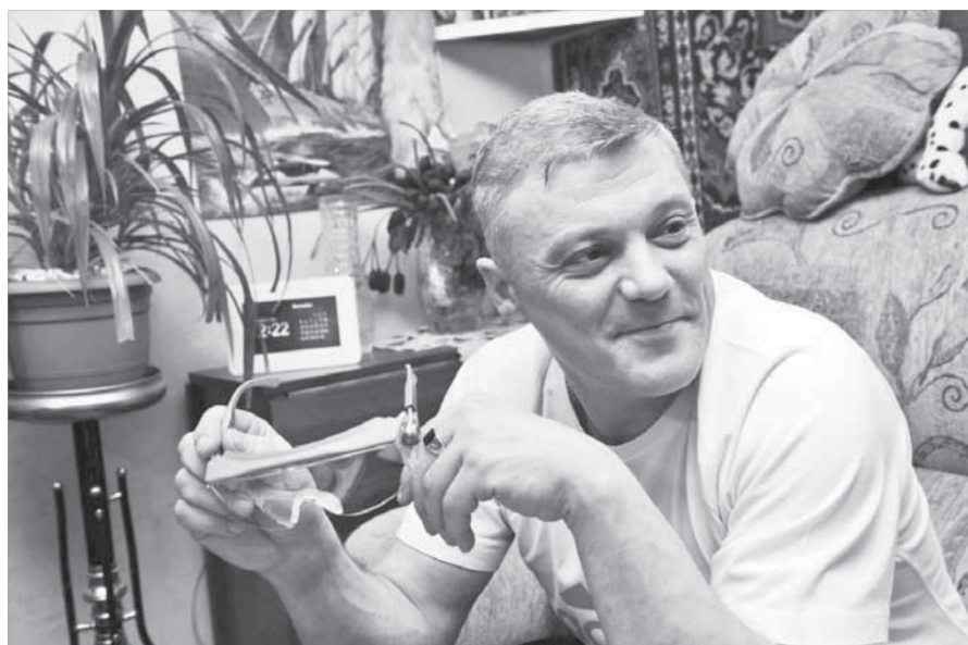
Защитные очки на работе нужны постоянно