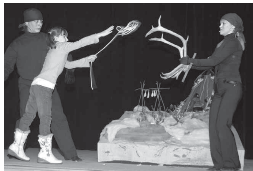
Арканить оленя сложно, но интересно