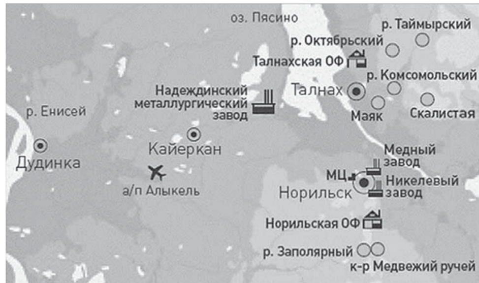
Система жизнедеятельности Норильского промрайона требует взвешенного, ответственного подхода

"Норильский никель" в прошлом году утвердил Стратегию производственно-технического развития на период до 2025 года, которая предусматривает строитель-