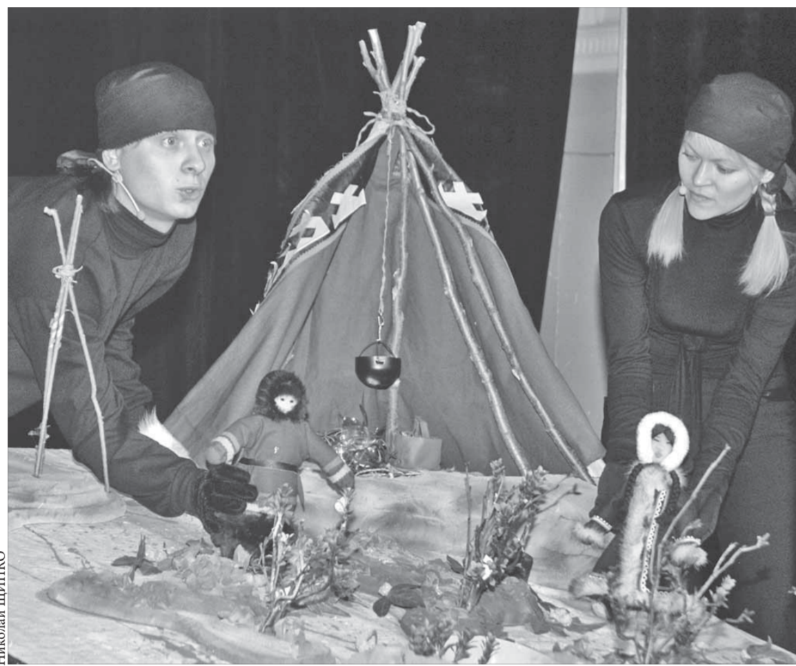
Ялико и Малик открыли юным зрителям северные традиции