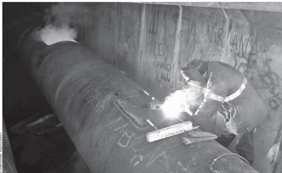
Восстановительные работы на трубопроводе завершены

Более подробную информацию норильчане могут получить в аварийных службах управляющих компаний по месту жительства. В случае бездействия управляющих компаний – в диспетчерской службе управления городского хозяйства по номеру 46-31-31. Телефон работает круглосуточно.