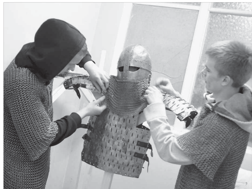
В клубных объединениях всегда есть чем заняться

Культурно-досуговый центр «Юбилейный» подготовил для норильчан массу разнообразных мероприятий. Помимо любящихся ежегодных праздников посетителей ждет ряд новых проектов, стать участником которых может каждый.