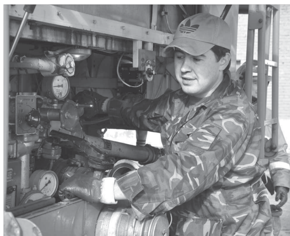
У каждого пожарного свой круг обязанностей

комплекс “ГРОТ”, позволяющий оттачивать навыки в условиях, близких к реальным.