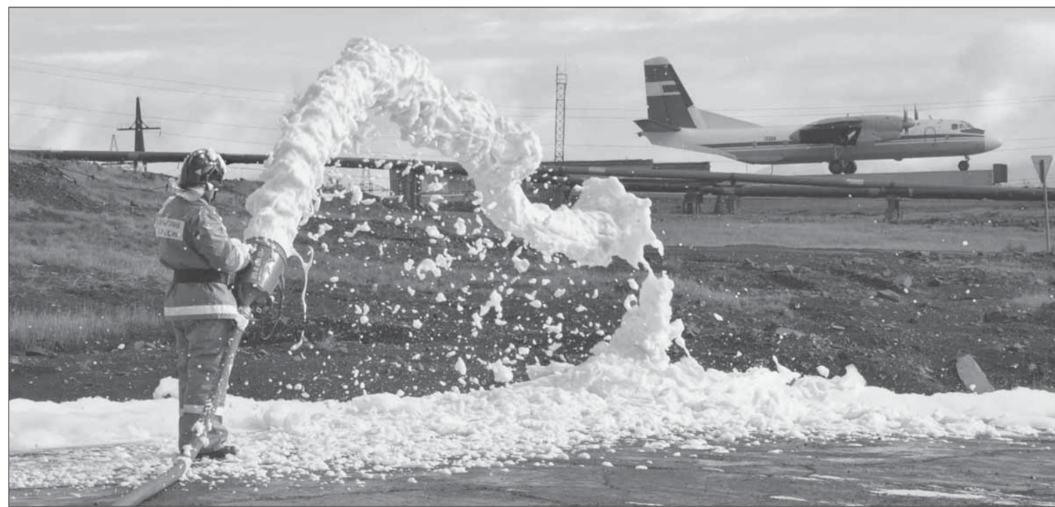
Боевое развертывание с подачей пены со ствола

Рособрнадзор утвердил минимальный порог баллов по всем предметам для сдачи Единого государственного экзамена на 2013 год. По обязательному предмету – русскому языку – необходимо набрать не менее 36 баллов, по математике – не менее 24. Минимальные баллы для предметов по выбору установлены следующие: физика, химия – 36 баллов, информатика и ИКТ – 40, биология – 36, история – 32, география – 37, обществознание – 39 и литература – 32 балла.