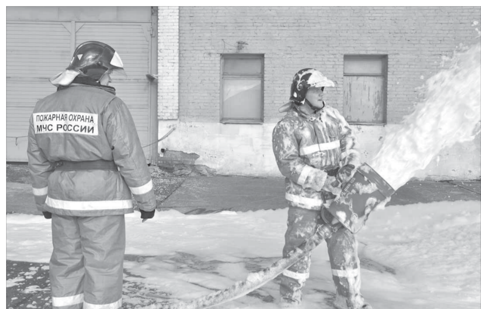
Даже во время учений расчет действует так же, как во время реального пожара