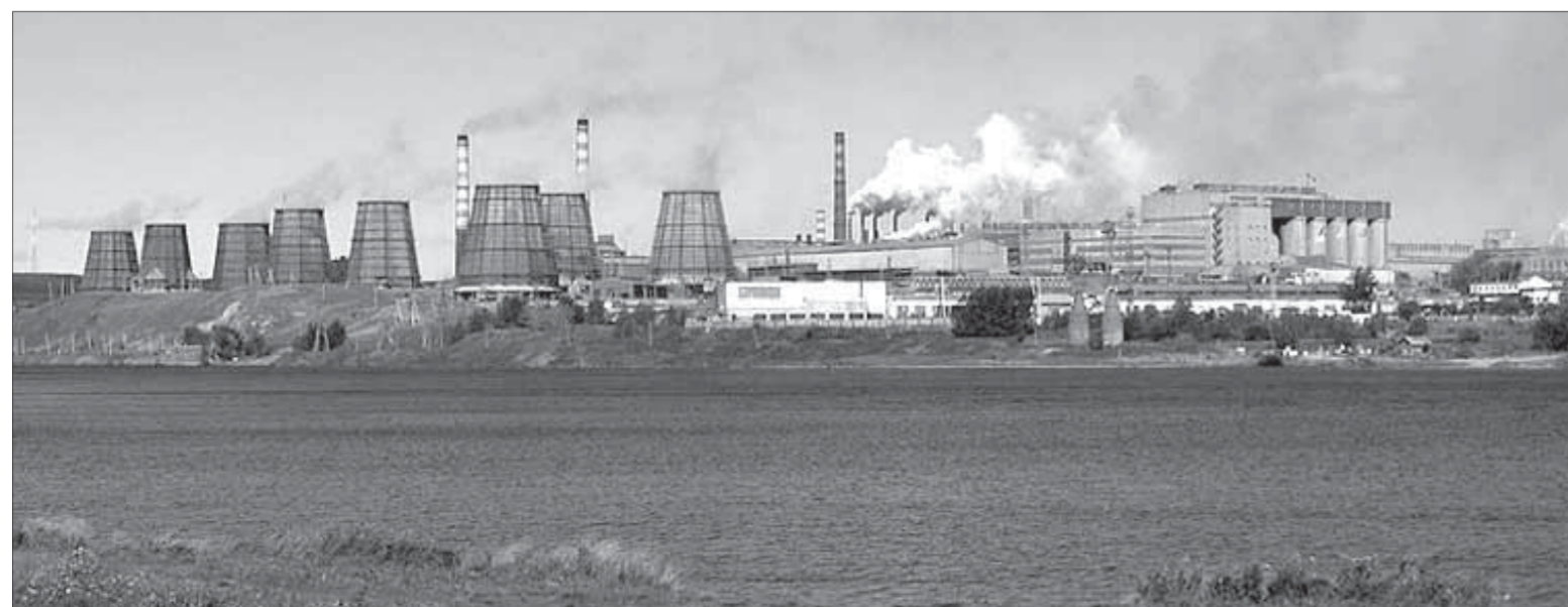
Жители Красноуральска боятся закрытия градообразующего предприятия

Данную информацию руководителям и индивидуальным предпринимателям необходимо учитывать при планировании работ и выполнении заявок на перевозки автомобильным транспортом в зимний период-2012/13.