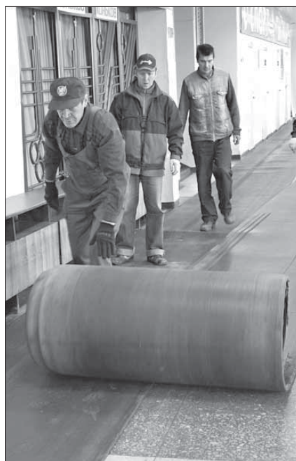
Резина нужна для беспрепятственного хождения на коньках