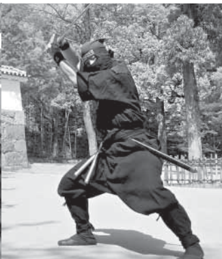
Ниндзя, но не черепашка