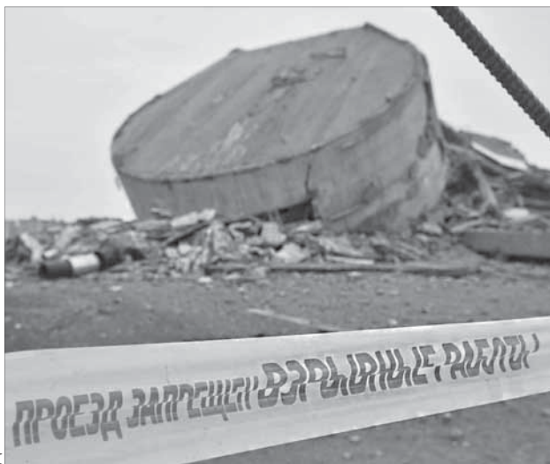
... так оно выглядит сейчас