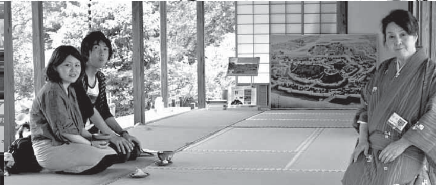
Вежливость – отличительная черта японцев