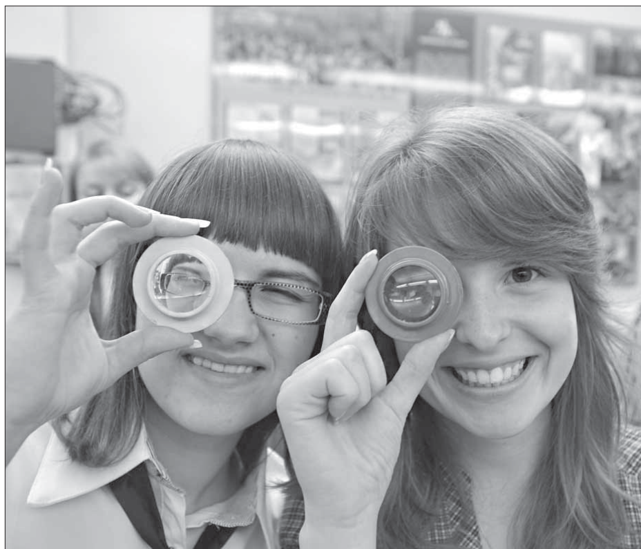
Выучить физику не составит труда

– Я думаю связать свою будущую жизнь с компанией, – призналась девушка, – это очень перспективно, и здесь есть возможности для карьерного роста. Меня лично привлекает металлургия. Очень интересное направление. Хотя с выбором факультета я пока не определилась. Это серьезное решение. Ведь профессию выбираешь на всю жизнь.