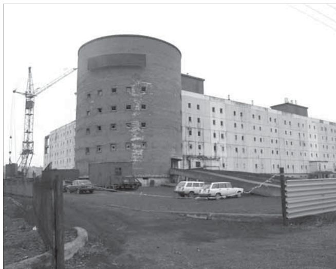
Так здание выглядело до взрывов...

А особенно – побед над своими слабостями, чтобы каждый стал еще сильнее и лучше!