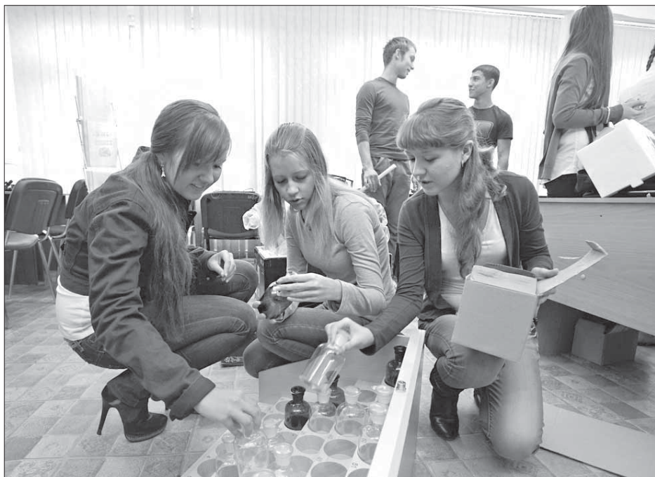
Оборудование для лабораторных работ позволит лучше узнать химию