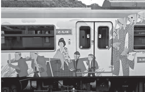
Транспорт в Японии очень красочный

道 猫 始 道 愛 幸 駁 樂 春 道 愛 幸 駁 仏 想 女 花 風 春 道 愛 幸 駁 仏 想 仏 想 女 花 風