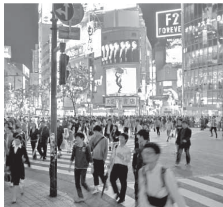
Редкий случай, когда на улицах мегаполиса народ

– Когда мы ездили на Фудзияму, – рассказывают норильчане, – в местном ресторанчике хозяйка заведения также не разговаривала по-английски. И не было на английском меню. Однако хозяйка очень ловко объяснила посетителям все на языке жестов. А здесь девушка – молодая, работающая в токийском заведении, где среди посетителей много европейцев... И – полное непонимание.