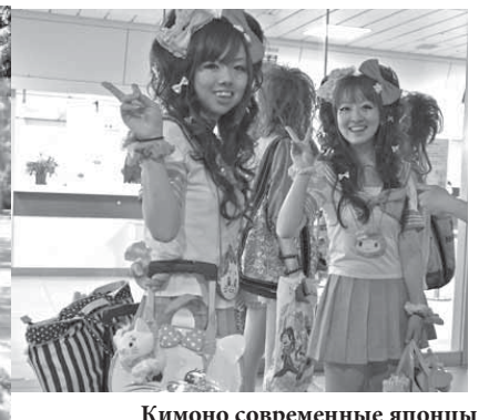
Кимоно современные японцы надевают редко