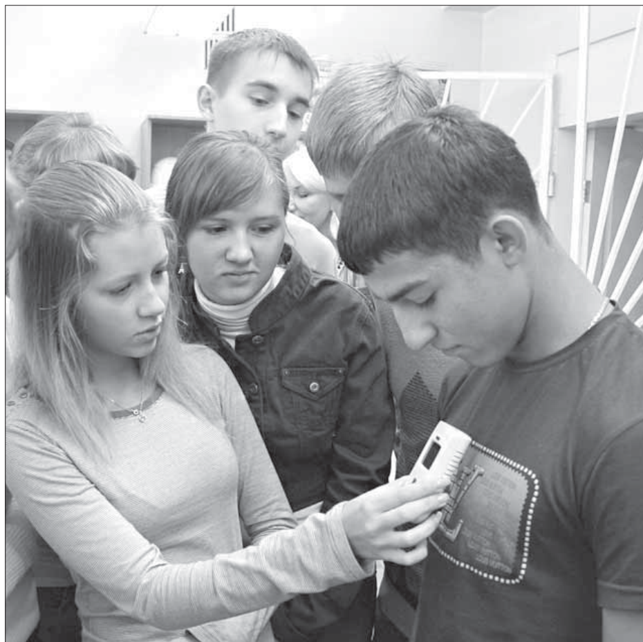
Прибор для определения уровня радиации школьники тут же опробовали на себе