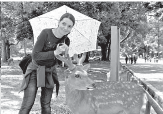
Достопримечательность Нары – это олени