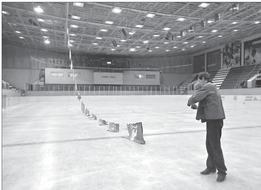
Накануне торжественного праздника "Арктику" украсили флагами