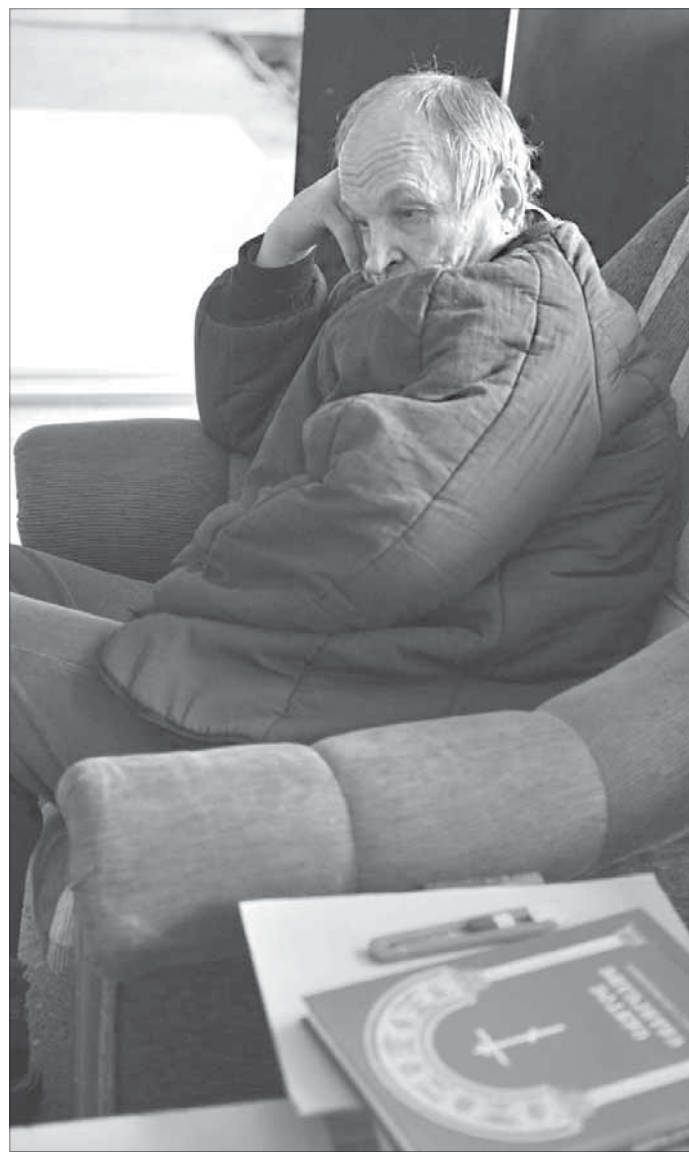
Люди, которые приходят в “Лествицу”, меняются