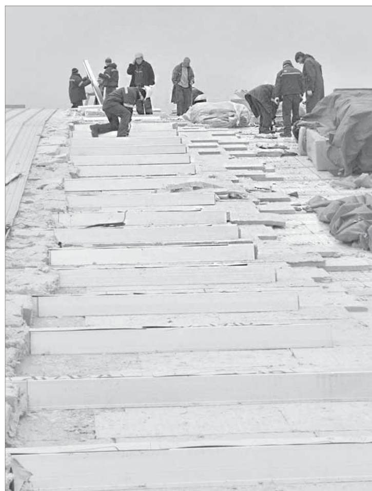
Строители “Арены” работают слаженно

Но главной отличительной особенностью – эксклюзивным, как выражаются строители, приобретением для жителей заполярного города станет акварарк. Он расположится на трех уровнях, что создаст для посетителей уникальную атмосферу водопадов, горок и