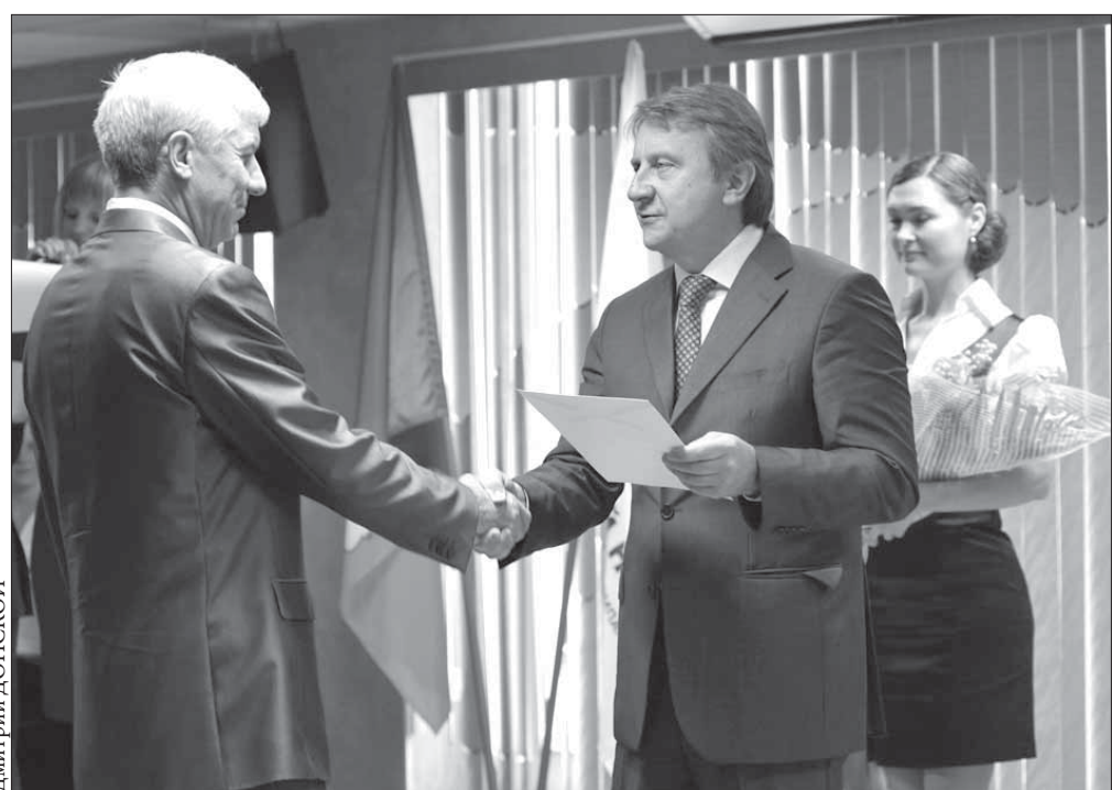
Награды самым достойным

В канун профессионального праздника – Дня шахтера прошло торжественное награждение заслуженных работников предприятий группы "Норильский никель".