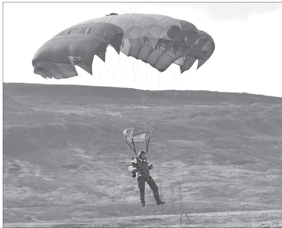
Точно приземлиться могут только мастера высшего класса

В случае пребывания гражданина Казахстана на территории Российской Федерации свыше 30 дней он обязан встать на учет по месту пребывания в территориальном органе ФМС России в соответствии с законодательством Российской Федерации.