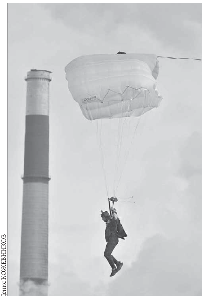
Аэромобильную технологию спасения МЧС позаимствовало у Воздушно-десантных войск

Об угрозе сворачивания производства на СУБРе также предупреждают эксперты: рудник полностью зависит от ситуации на Богословском алюминиевом заводе, расположенном в Красноуральске. А ситуация там, как известно, аховая.