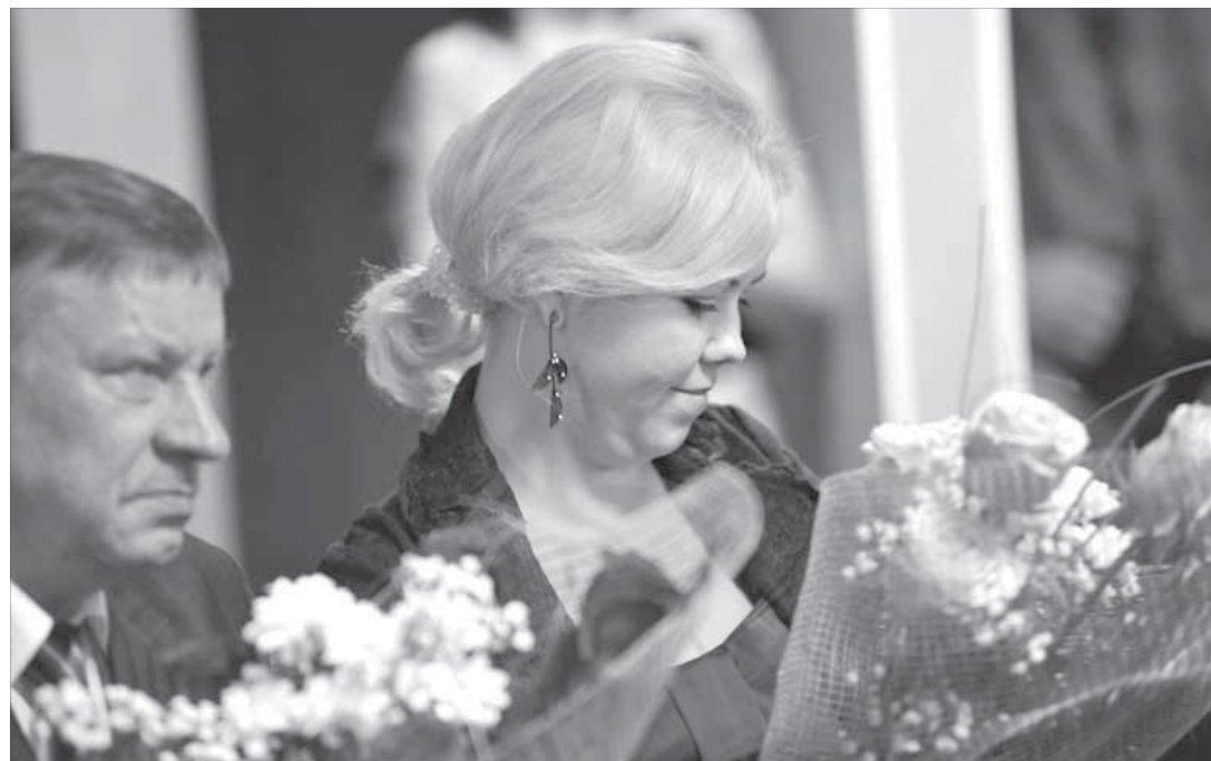
Немаловажную роль в горном производстве играют женщины