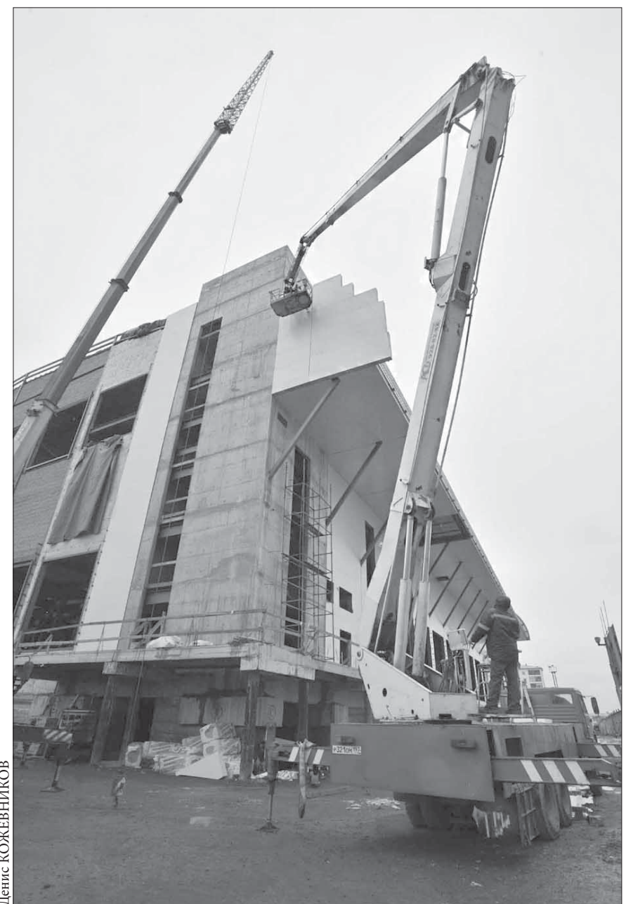
Внешний вид "Арены-Норильск" меняется на глазах