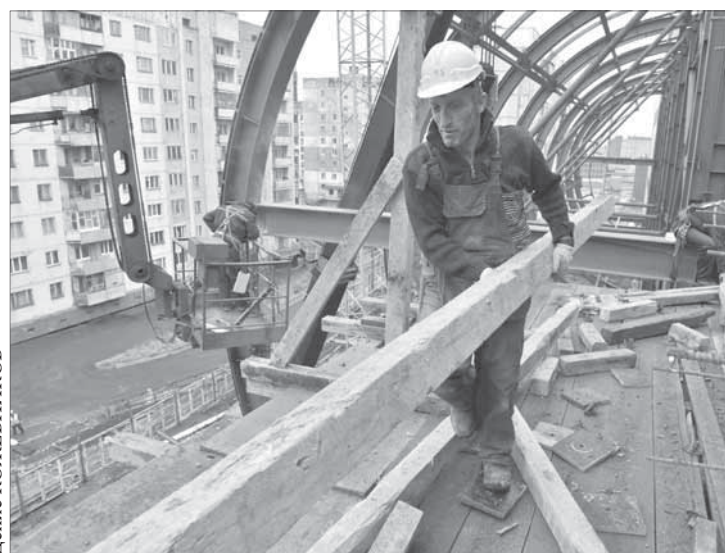
Сроки перед строителями стоят жесткие