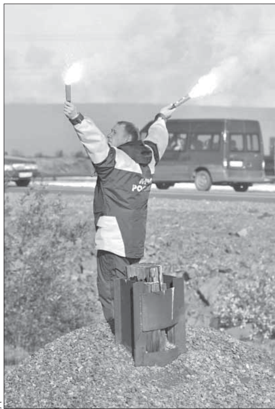
По сигнальным фальшфейерам летчики видят место высадки десанта

Ил-76 пролетает над нами, и кажется, что ничего не произошло. Но через несколько