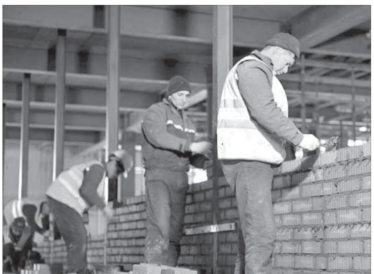
Комплекс возводится на всех уровнях одновременно

Все это норильчане увидят уже через год. Ализамин с коллегами в этом не сомневаются: объект будет сдан в срок.