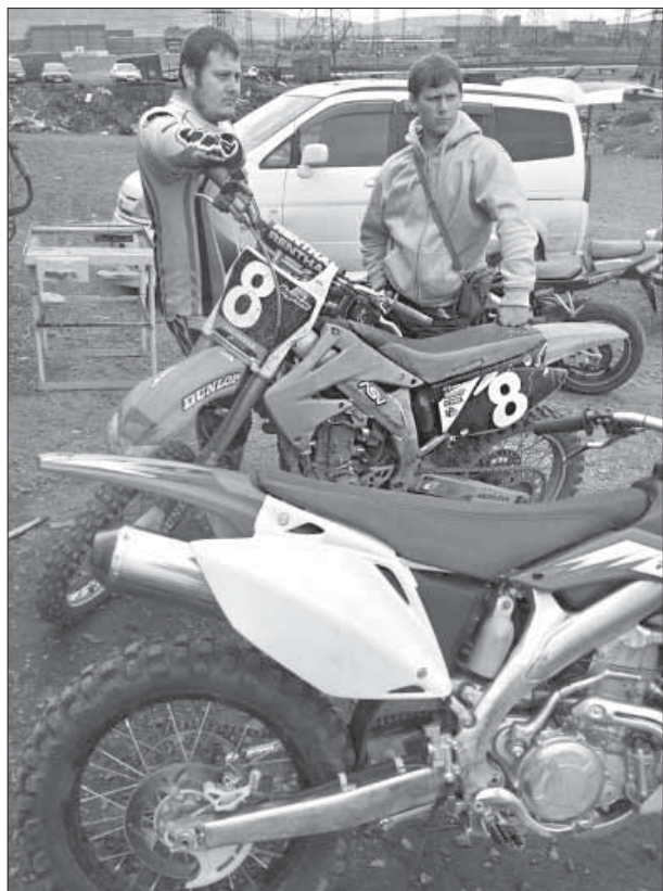
Мотоцикл стал для клуба большим приобретением

Новенький мотоцикл стал отличным поводом навесить старых знакомых редакции. Других возможностей увидеться с мотогонщиками в стенах клуба текущий год не предоставил. Чему есть свои причины. Известно, что на протяжении многих лет спортивно-технический клуб, которым некогда наш город по праву гордился, выживал исключительно за счет энтузиазма руководителей и самих спортсменов. Последние пять лет, когда участь автошколы была неизвестной на бумаге, но предпринятой на деле (за коммунальный долг здание даже пытались обесточить!), гараж клуба был единственным местом, откуда жизнь не собиралась уходить ни под каким предлогом. Почти каждый вечер вне зависимости от времени года здесь стучал молоток, работала болгарка, заводился и пел свою мелодию мотоциклетный мотор.