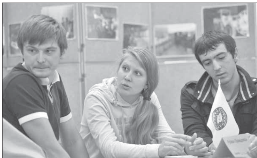
Каждая версия обсуждалась жарко

...Подобные турниры планируется проводить и дальше. Ведь что как не совместная работа руководителей практики и студентов, а также хорошее времяпровождение поможет сблизить их интересы, направленные на одну общую цель – качественную подготовку будущих квалифицированных специалистов компании.