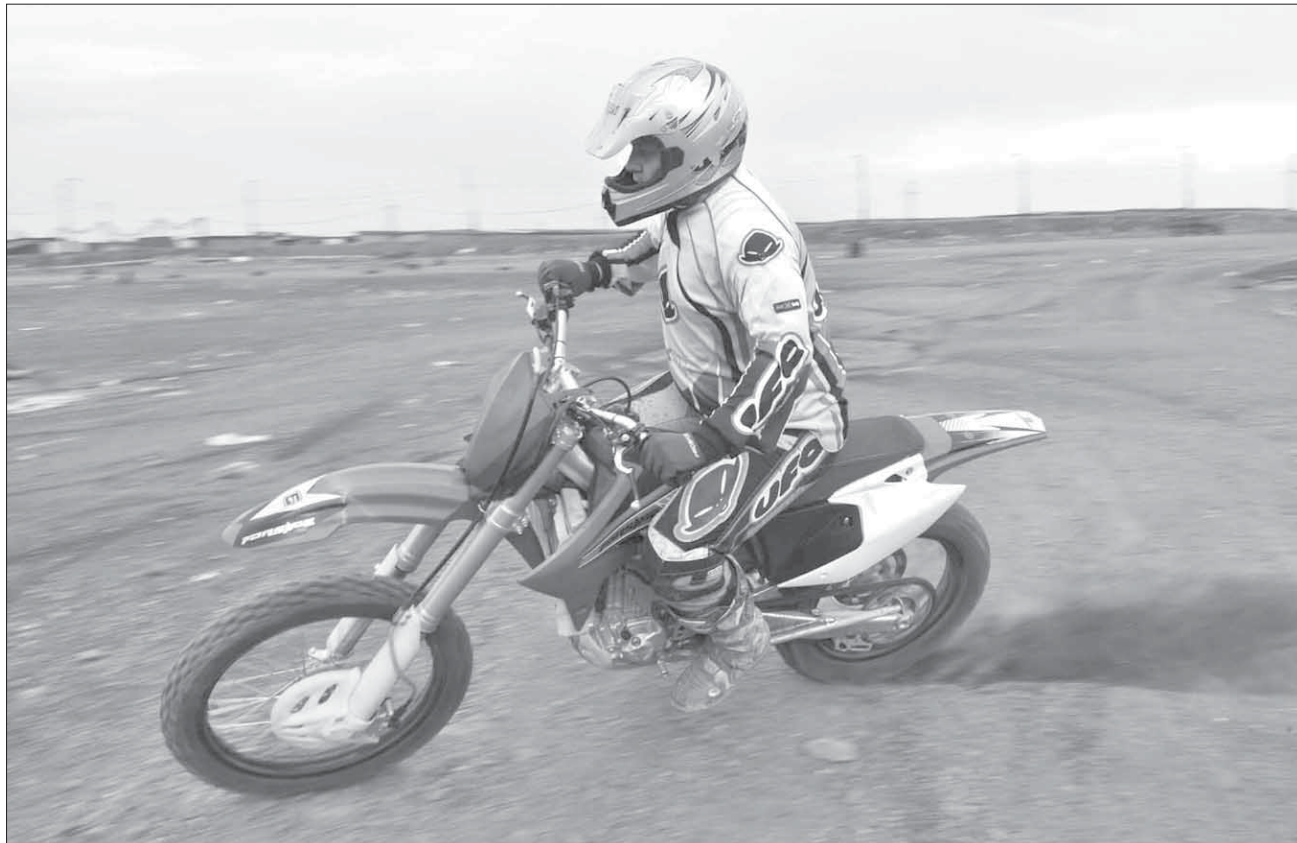
Рев мотоцикла – чарующий звук