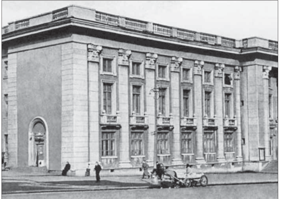
Здание ДИТРа, позднее ДК металлургов и шахтеров. Проработал аккордеонистом с 1962-го по 1965 г.