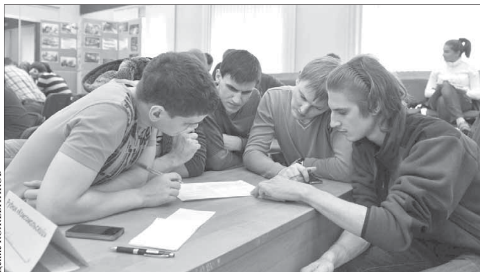
Командная работа приносит результат