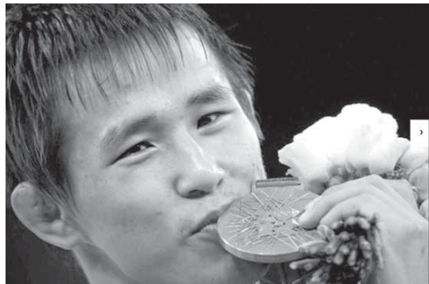
Впереди новые победы