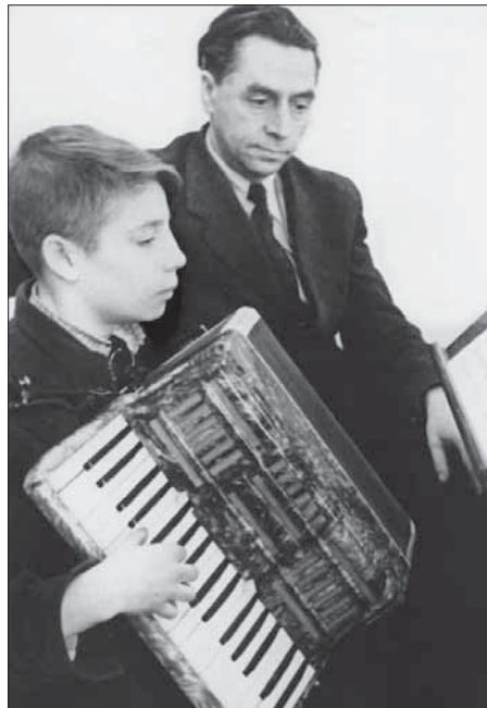
На уроке музыки у папы. 1958 г.