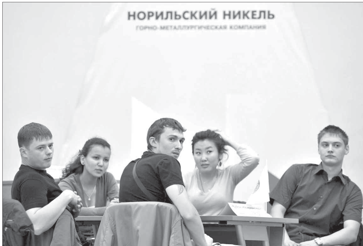
Внимание – вопрос!