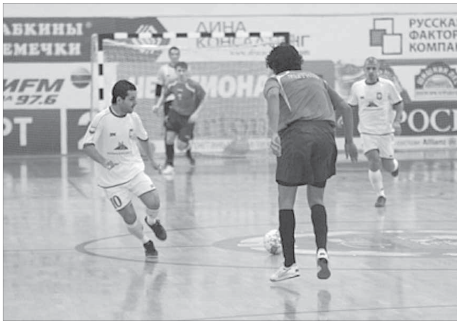
Северянам не хватило удачи, а шансы были

Вчера вечером во втором туре Dina Open Cup "Норильский никель" встречался с питерским "Политехом".