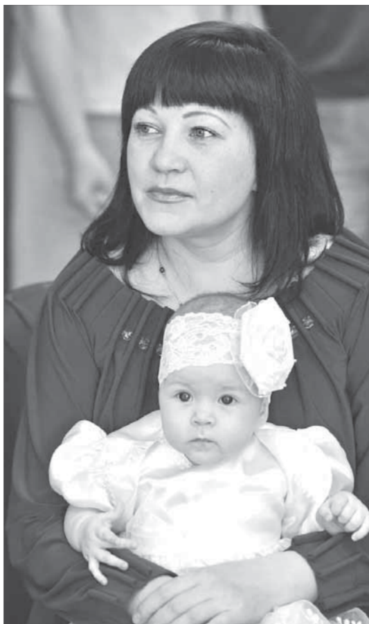
Светлана с пятилетней дочерью

По закону средствами материнского капитала можно распоряжаться частично или в полном объеме для улучшения жилищных условий (это может быть погашение кредитов, в том числе ипотечных, компенсация покупки квартиры или строительства дома), а также для получения об-