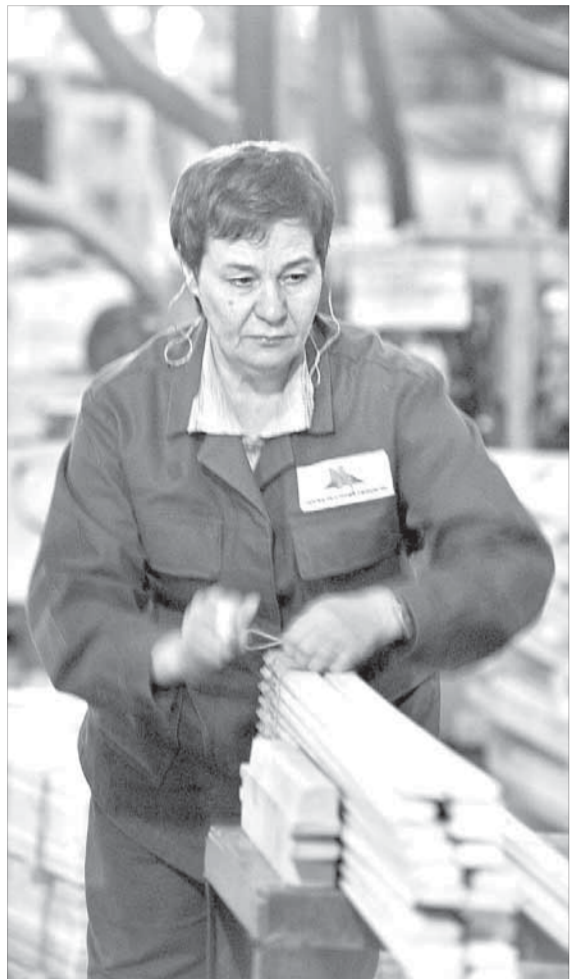
Под музыку работа спорится