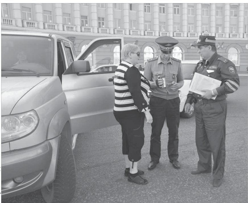
Не поспоришь – факт нарушения налицо