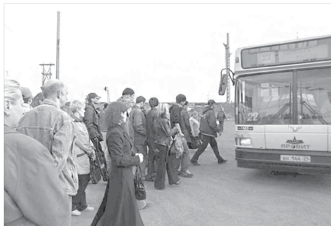
Автобусы иногда приходится ждать долго