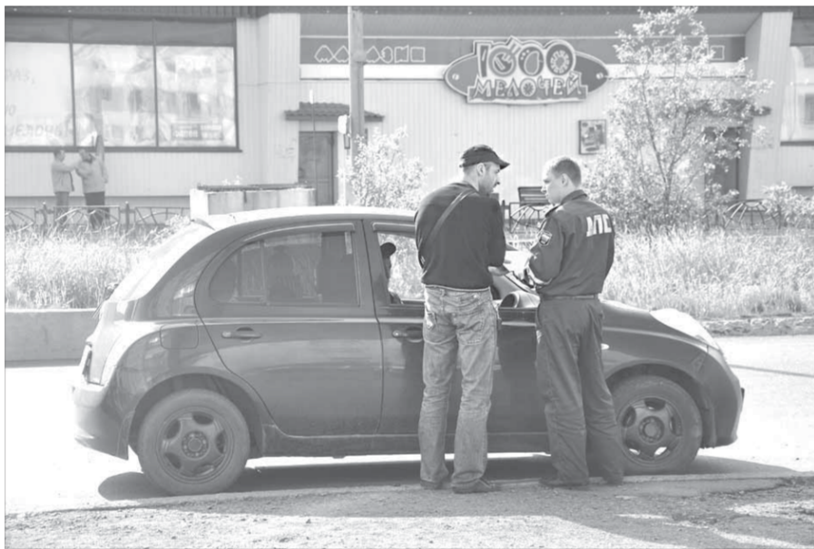
Тонировку лучше снимать самостоятельно