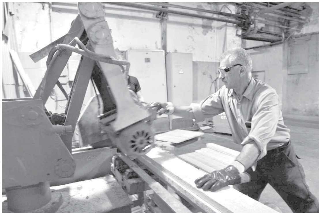
Участок стабильно перевыполняет планы