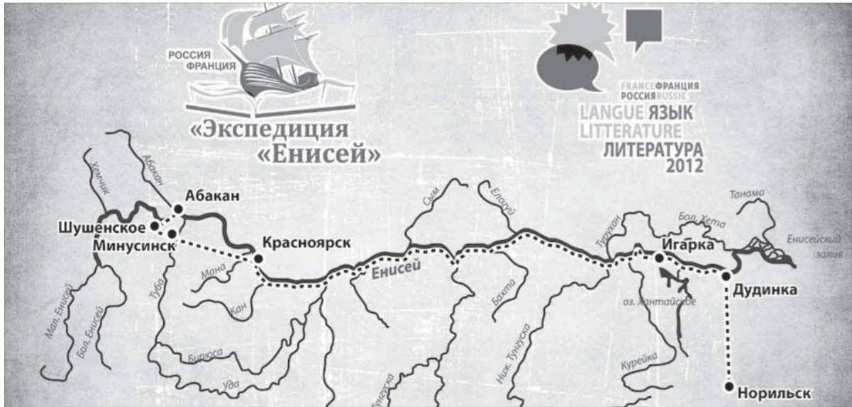
Карта маршрута писательской экспедиции – 2012