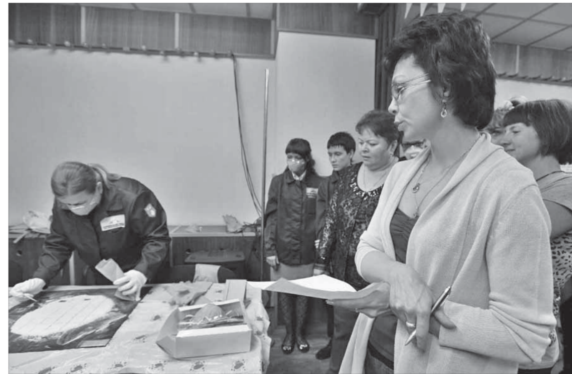
Жюри оценивало строго, но справедливо