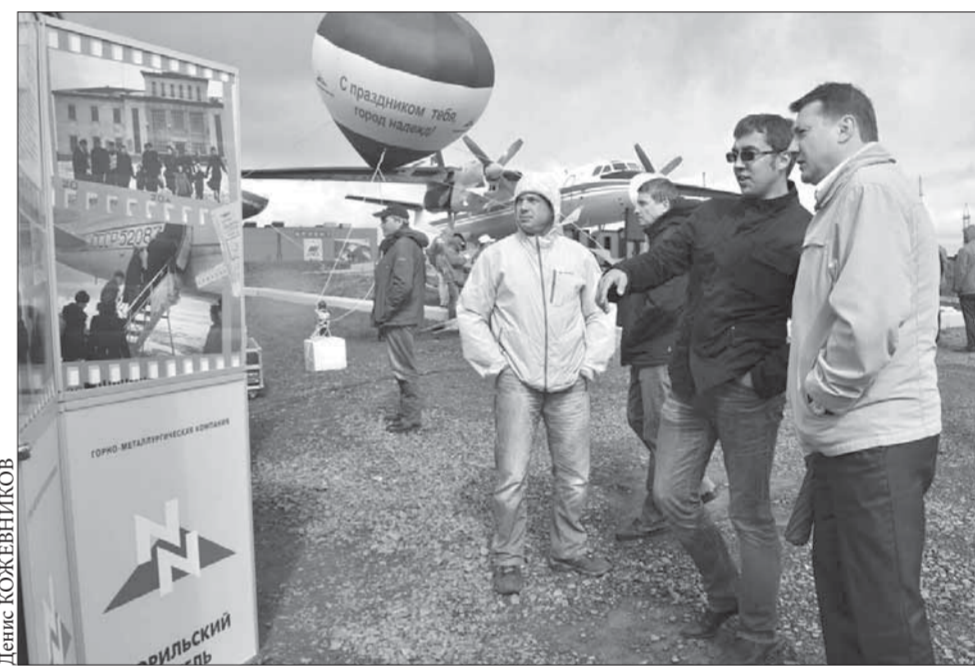
История аэропорта – века Норильска