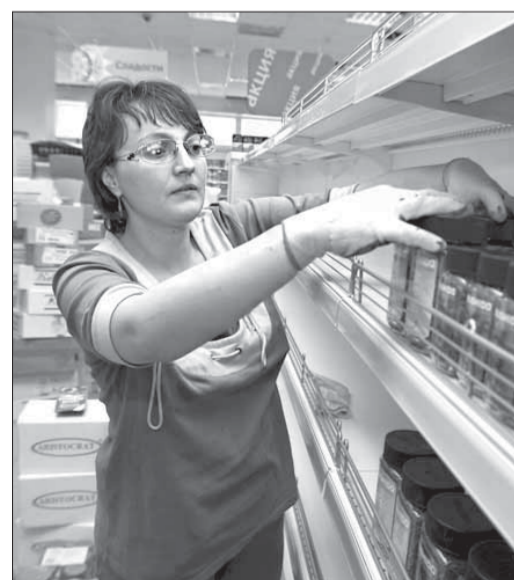
В “Подсолнухе” заняты выкладкой товара

В субботу, в дни празднования Дня металлурга и Дня горда, в Кайеркане откроется первый в этом районе магазин под брендом “Подсолнух”.