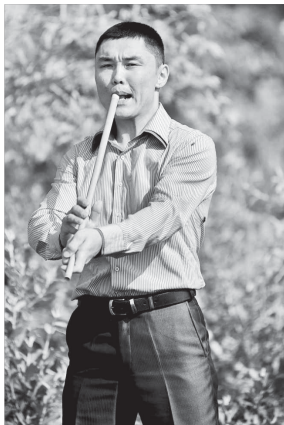
Звуки кура на таймырской земле