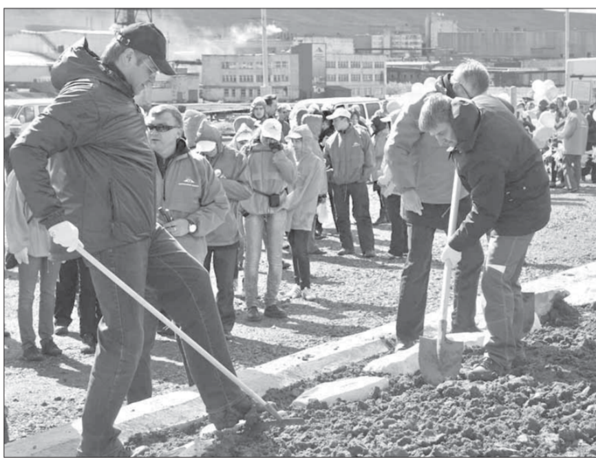
Последний штрих за руководством