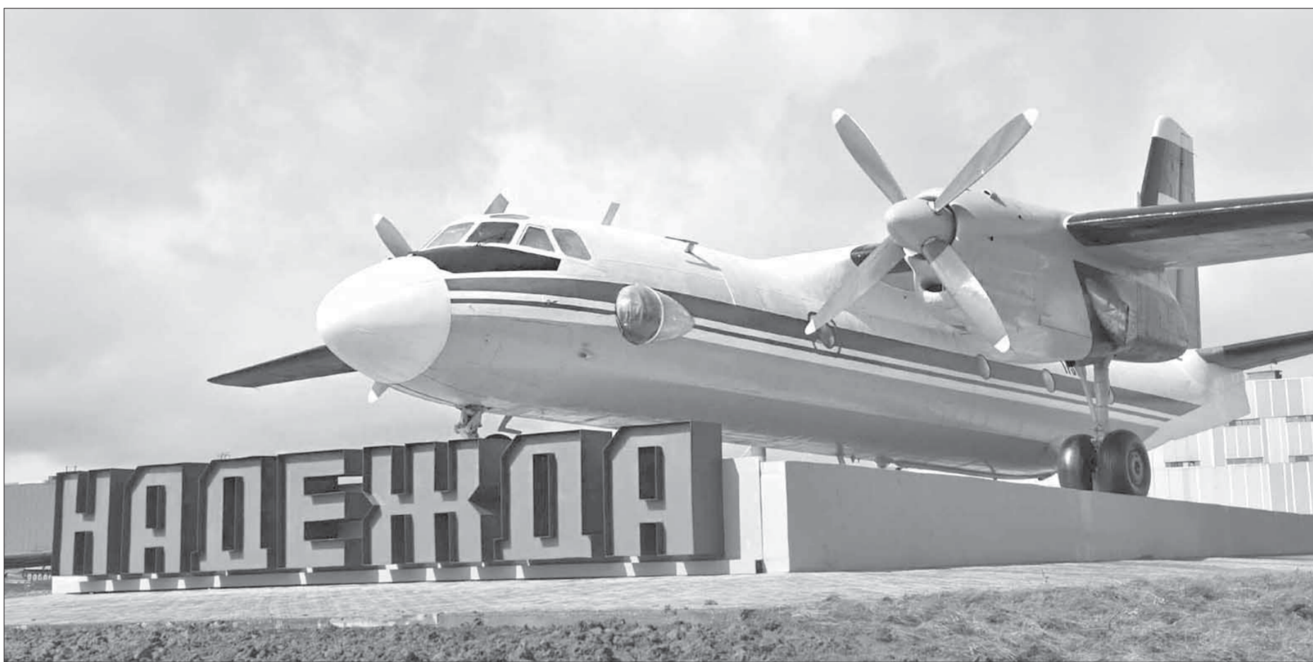
Быть тебе символом “Надежды”, самолет!

Самолет – это не только символ связи времен, но и символ связи с материком. Эти параллели здесь, несомненно, существуют, так или иначе просматриваются. Именно поэтому мы можем сказать: это не памятник и не монумент, а символ наших судеб и нашего города.