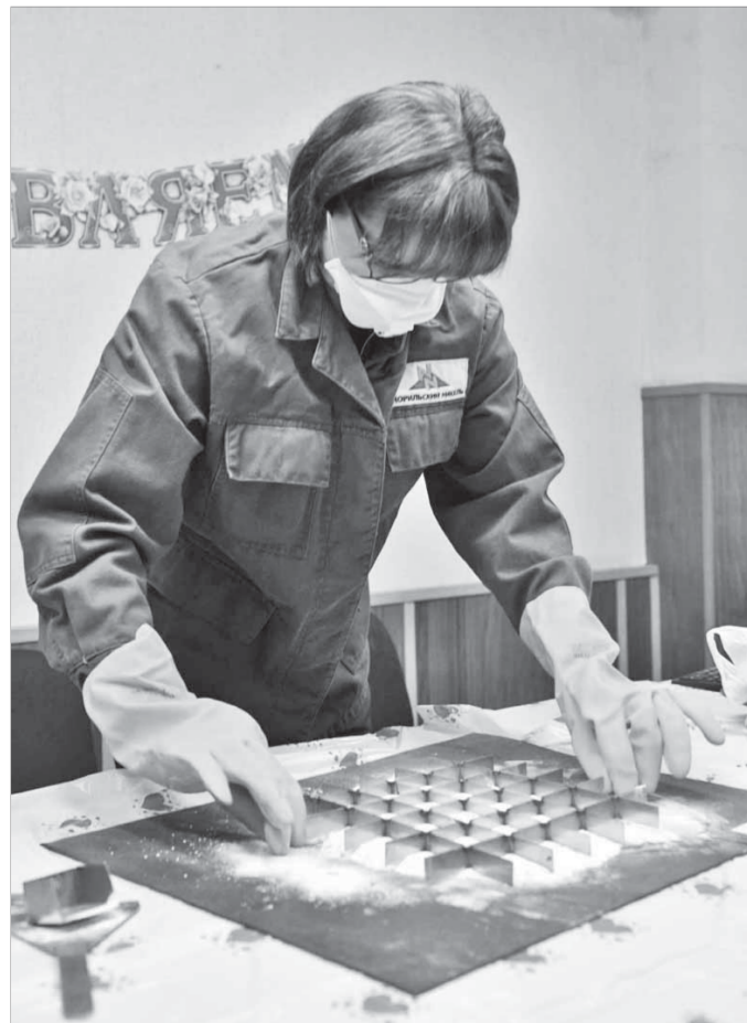
Дрожь волнения трудно унять

Третий конкурс – творческий. Здесь девушкам предложили блеснуть голосом и слогом. Кто-то декламировал собственные стихи, а кто-то пел частушки. Известная крестьянская забава Руси нашла себя и в металлургических интерпретациях. Некоторые из предложенных на суд жюри и на радость болельщиков просто убивали наповал – действительно очень смешно.