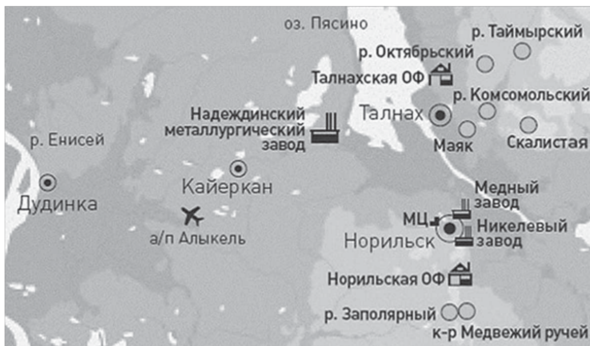
“Норильский никель” обладает необходимой инфраструктурой для разработки месторождений