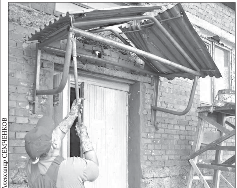
Всего на территории НЖЭК 230 козырьков

Курс акций ОАО "ГМК "Норильский никель" – 5397 рублей. ОАО "Полус Золото" – 1051 рубль.