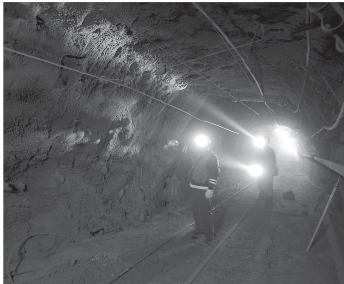
“Норильский никель” в течение четырех лет проводил исследования месторождений, выполнив таким образом всю подготовительную работу

Департамент геологоразведки постоянно изучает минерально-сырьевую базу ведущих производителей меди и никеля, а также делает обзоры по регионам, обладающим перспективами выявления крупных месторождений меди и никеля. В круг наших интересов входят такие страны, как Аргентина, Бразилия, Перу, Чили, Зимбабве, Намибия и другие. Но это не значит, что мы готовы сразу что-то приобретать. Просто нам надо понимать, что там находится и что нас ожидает. А дальше все зависит от экономических показателей того или иного проекта.