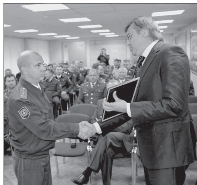
Их мало, но они с жезлами

Вчера норильские полицейские чествовали своих коллег – инспекторов дорожного движения. Повод достижений: 3 июля исполнилось 76 лет с момента создания в нашей стране службы ГАИ.