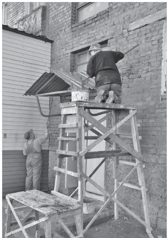
Лето для коммунальщиков – время ударного труда