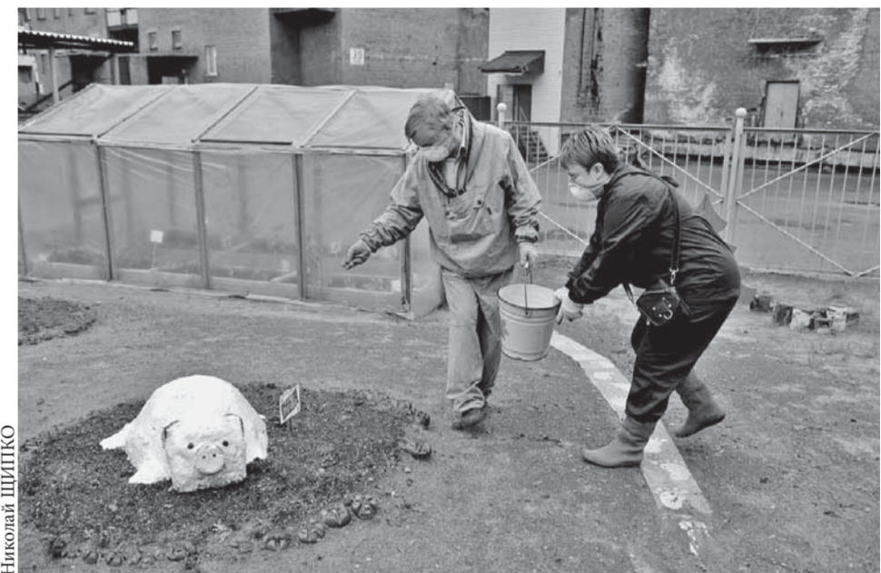
На площадке детского сада "Василек" не только засеяли газоны, но и поставили теплицу