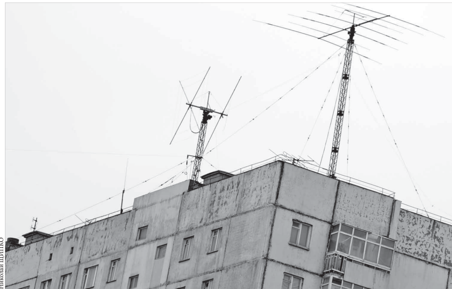
Из необходимых городу 2964 антенн остались целы и работают 1850

Дискретный анализатор позволяет обнаружить рак кишечника на ранних стадиях. Преимущество анализатора, аналогичных которому в России сейчас менее десятка, заключается в том, что он полностью автоматизирован, в течение часа обрабатывает до 300 образцов и пациенту перед сдачей анализов не нужно соблюдать особую диету. Для того чтобы пройти обследование, нужно обратиться к своему терапевту. Все граждане, достигшие 50-летнего возраста, могут пройти его без специальных показаний. Люди моложе получают направление на исследование при наличии хронических воспалительных заболеваний, язвенных процессов желудка и кишечника, аутоиммунных и других заболеваний кишечника. Также обследоваться следует гражданам, в семье у которых были выявлены случаи рака или полипоза кишечника.