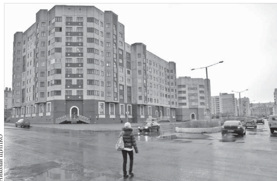
Норильску жить и развиваться. Перспектива просчитана до 2020 года

рамках которого будет существовать экономика, политика, социальная сфера заполярного города. В документе обозначена среднесрочная перспектива, до 2015 года, и более отдаленный период – 2020 год. Предполагается, что к этому времени Большой