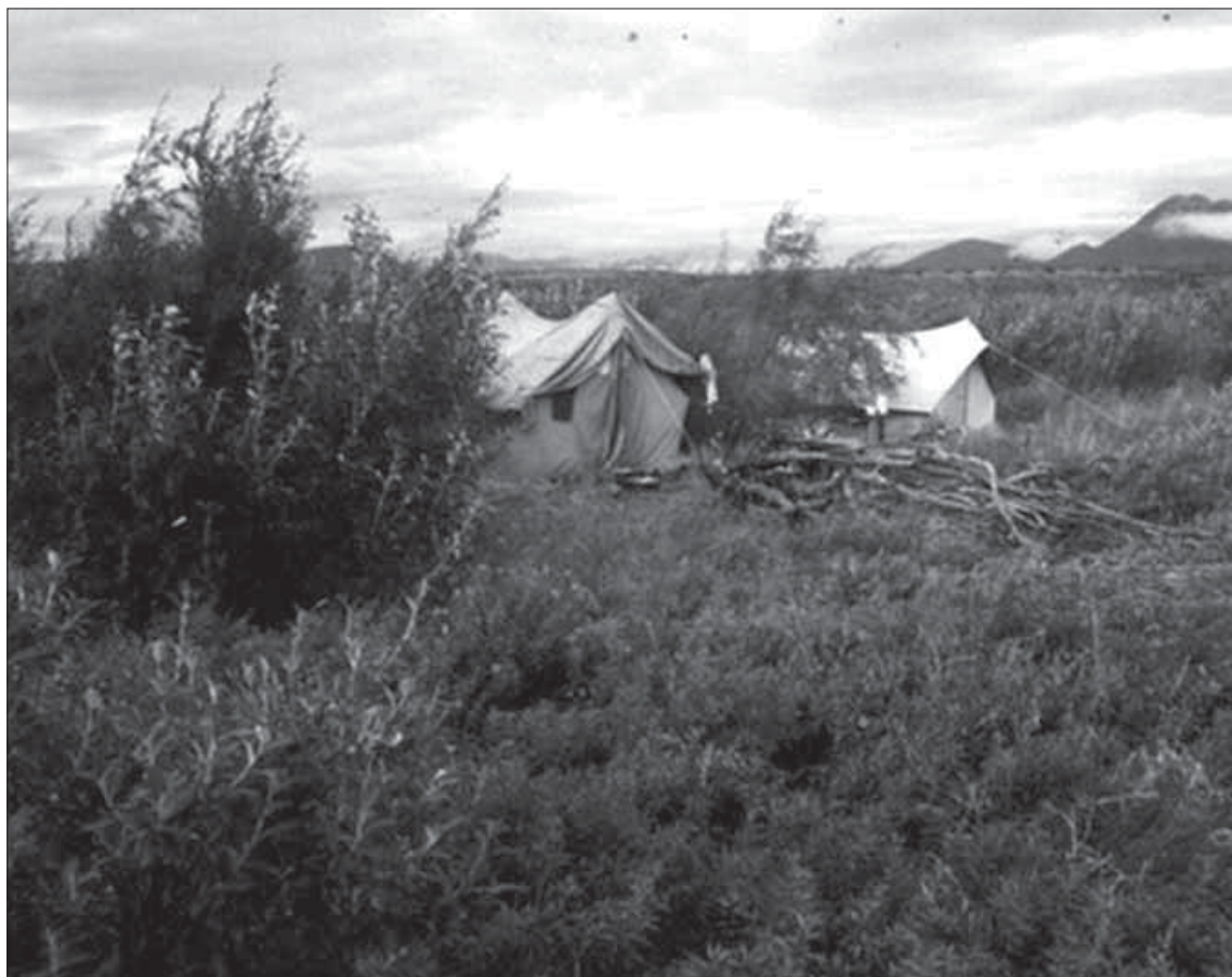
Полярная, или аляскинская, ива на фоне хребта Хэнка-Бырранга

Все дальше проникает пустыня в души человеческие, и нет ответа полярной иве.