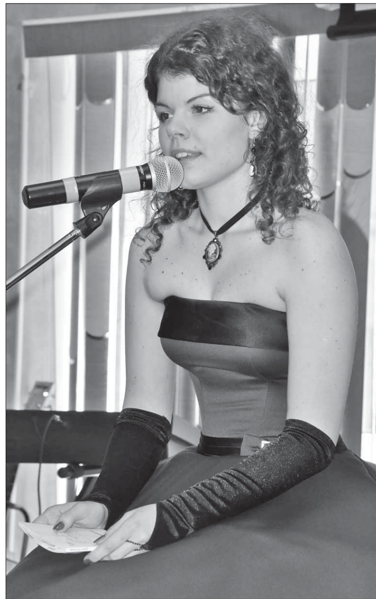
Выступать на сцене – сбывшаяся детская мечта

– Первый сборник – это не первый шаг. Правильно сказать, это попытка поделиться с людьми