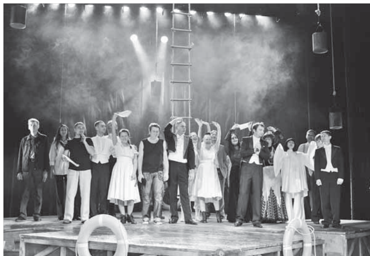
На маленьком плоту