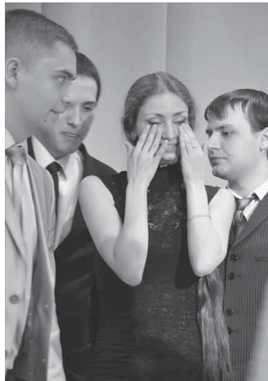
Не обошлось и без слез