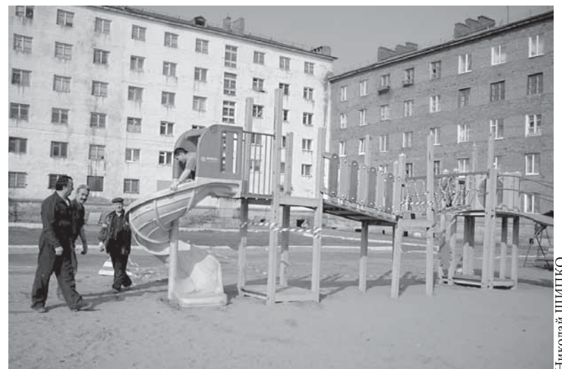
Таковую же детскую площадку НЖЭК построит на Комсомольской, 36

– Всего на нашей территории в Центральном районе функционируют 12 детских площадок, в их числе одна спортивная и зона отдыха, – рассказала "Заполярному вестнику" начальник общестроительного участка НЖЭК Марина Шнайдер. – Все они находятся в полностью исправном состоянии и активно используются. В скором времени будет построена еще одна игровая площадка на Комсомольской, 36.