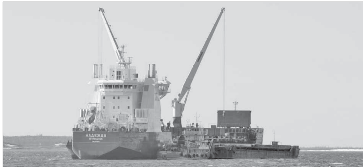
Заполярный транспортный филиал открыл летнюю навигацию – 2012

– К причальной стенке суда поставят, когда очистится оголовок причала, а уровень воды опустится до отметки 7,4 метра, – рассказал "ЗВ" заместитель начальника производственно-перезагрузочного комплекса №1 Андрей Вискунов. – Как только это произойдет, начнется приведение причалов в порядок – на территорию ППК выдвинутся бригады для восстановления автомобильных, подкрановых и железнодорожных путей и уборки от ила.