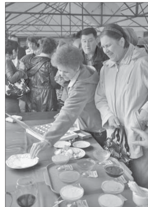
Продукция Краснодарского края пользуется спросом