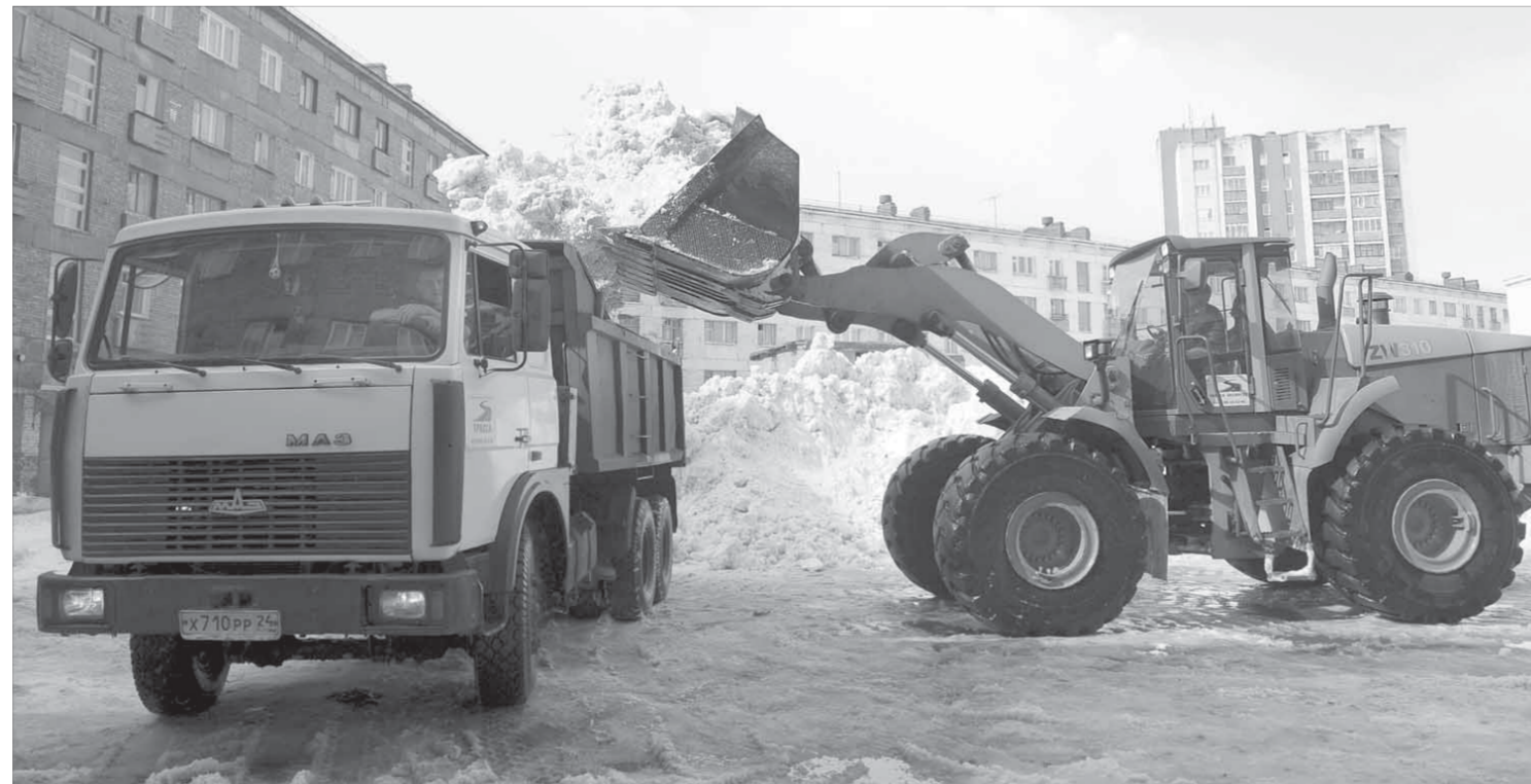
Снег изрядно надел и горожанам, и коммунальщикам

дворов и отправляются за город. Тут же, во дворах, очень сноровисто и быстро погрузчики заполняют кузова едва подтаявшим снегом. А МАЗы все подходят и подходят – снега хватит на всех. В период с 13 по 15