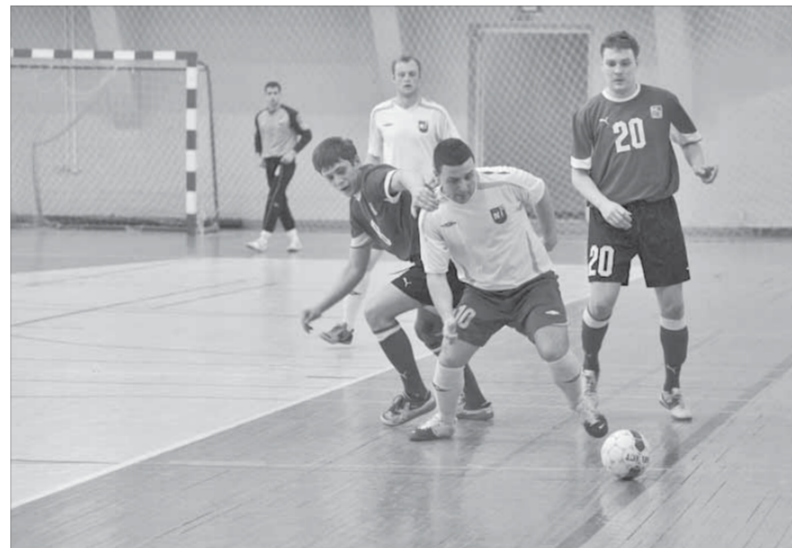
Борьба шла на каждом участке площадки

Второй тайм оказался богатым на события. Во-первых, ворота обеих команд подвергались мощному обстрелу. Во-вторых, обострилась борьба за мяч, что тут же отразилось на статистике фолов. Пара желтых карточек немного остудила пыл игроков. Какое-то мис-