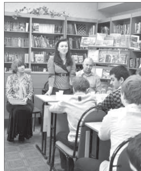
Ученые НИИСХ Крайнего Севера встретились со старшеклассниками города

Поумилявшись фотографиям юных овцебычков, сбившихся в защитное каре, и видеороликам с симпатичными оленятами, старшеклассники попрощались с сотрудниками института. Кто знает, может быть, один из сегодняшних слушателей когда-нибудь тоже будет носить гордое звание “научника”.