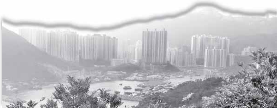
Современный Китай поражает воображение