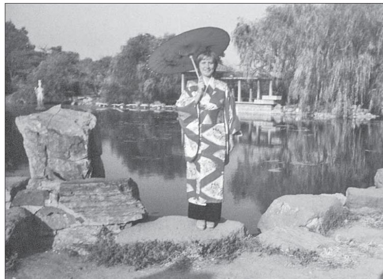
В таком наряде можно почувствовать себя настоящей китайкой

– Я уверена, что через несколько лет уровень команды “Шанхай КсюФан” будет гораздо выше. Китайцы действительно удивительная и работоспособная нация. Да и разве можно ждать иного от людей, которые живут в душевной гармонии с самими собой?