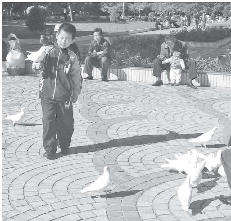
Сегодня не все китайские семьи хотят детей

– Я слышала такую концепцию, что время у китайцев имеет вертикальный характер движения, причем движение это осуществляется по направлению сверху вниз, – обращается к философии Анна. – Для меня это было удивительно. Если же говорить о менталитете... Современный Китай – это страна, где оптимизм, вера в светлое будущее ощущается на каждом шагу. Китайцы, несмотря на чрезвычайно быстрое экономическое развитие страны, чтут свои древние традиции, оберегают культуру. Они очень любят свою Родину и гордятся ей, но в то же время стремятся к новому. Максимум уважения здесь проявляют к иностранцам. С этим я столкнулась, когда поехала в Китай на стажировку.