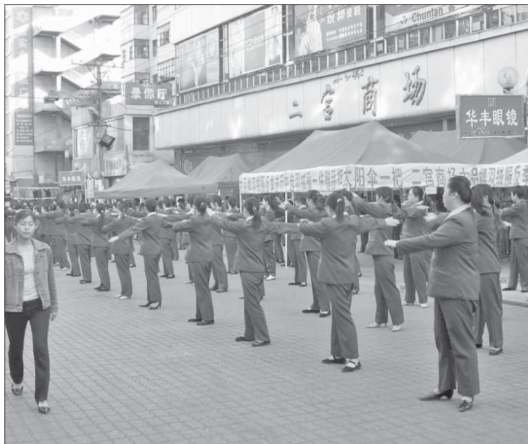
Каждое утро все китайские служащие делают зарядку