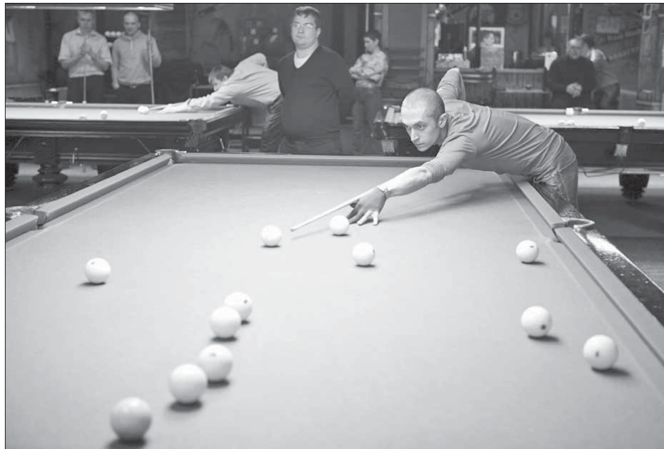
Бильярд учит думать

– Предел желаний – научиться играть в карамболь, одно из направлений бильярда, где не предусмотрены лузы на