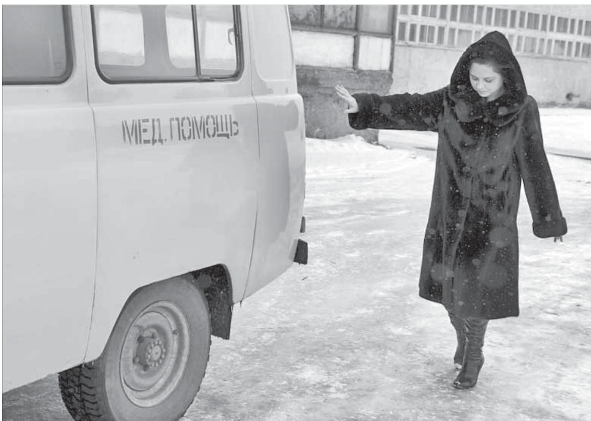
Май – травмоопасный месяц