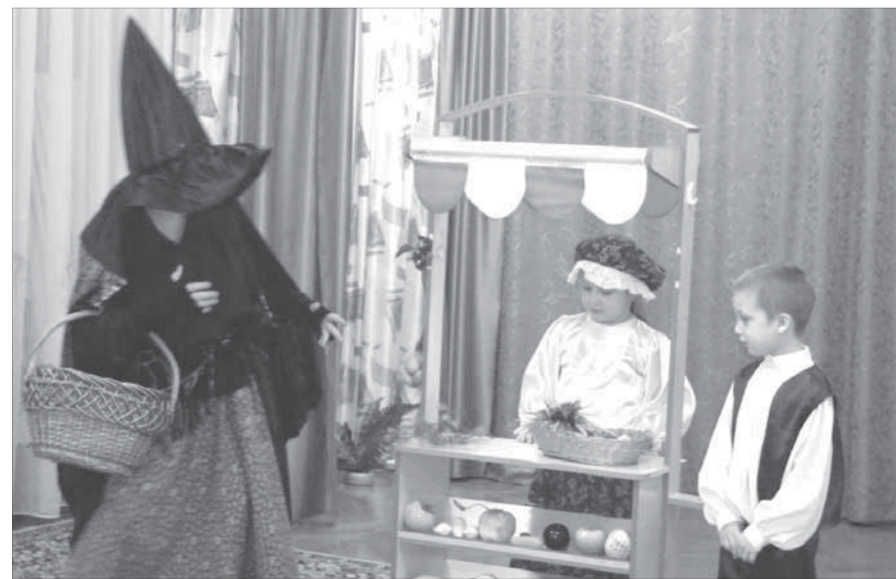
Сцена манит малышей

Каждую весну воспитанники детского сада №71 “Антошка” показывают для воспитателей и родителей театрализованные представления. В этом году выбор пал на сказку “Карлик Нос”.