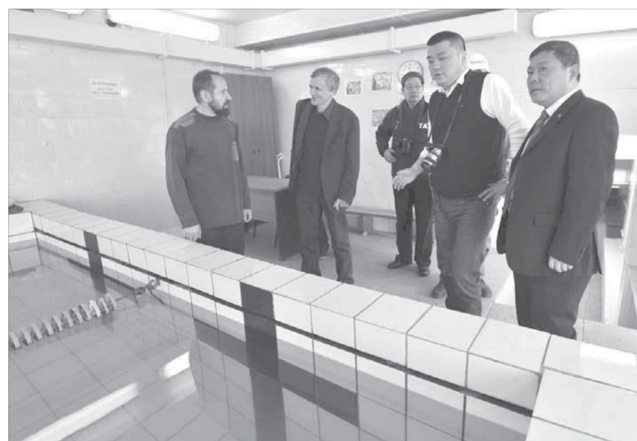
Увидеть бассейн на восьмом этаже гости не ожидали