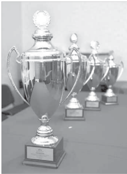
Награда, которая достанется сильнейшему

Закрытый для въезда иностранцев Норильск всегда вызывает большое лю-