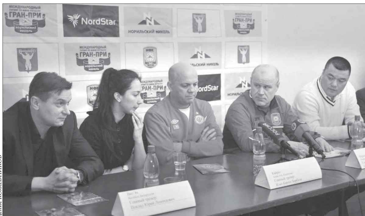
Чья команда возьмет в этом году Гран-при?

Вчера в Норильске стартовал международный турнир “Гран-при “Норильский никель”. А накануне главные тренеры команд-участниц рассказали о своих коллективах и поделились первыми впечатлениями о заполярном городе.