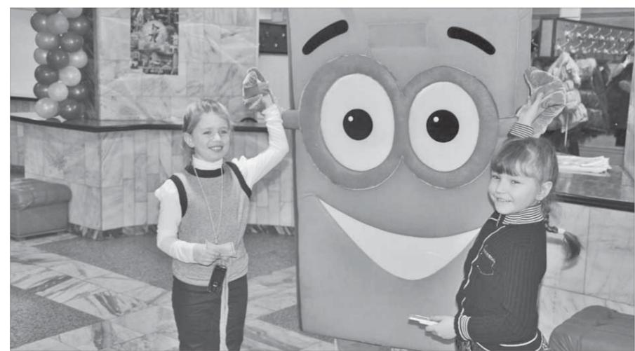
Книжкина неделя продлится в библиотеках города до 1 апреля

зобновить расследование. Странный черный цилиндр ненадолго привлек героев в замешательство, но вскоре с помощью зрителей они выяснили, что его обладателем мог быть только Безумный Шляпник. Впрочем, у этого подозреваемого было железное алиби — в момент пропажи книги он как раз устраивал свое ежедневное чаепитие. Кот и Алиса не отчаивались, а вот Королева Червей порядком устала от утомительных размышлений. Не обращая внимания на возмущение остальных "сыщиков", она, к большому удовольствию зрителей, решила сыграть партию в королевский гольф. Отличнее королевского гольфа от обычного состоит в том, что вместо маленьких мячиков используются воздушные шары (всем известно, что королевские особы не обязаны слишком тщательно прицеливаться).