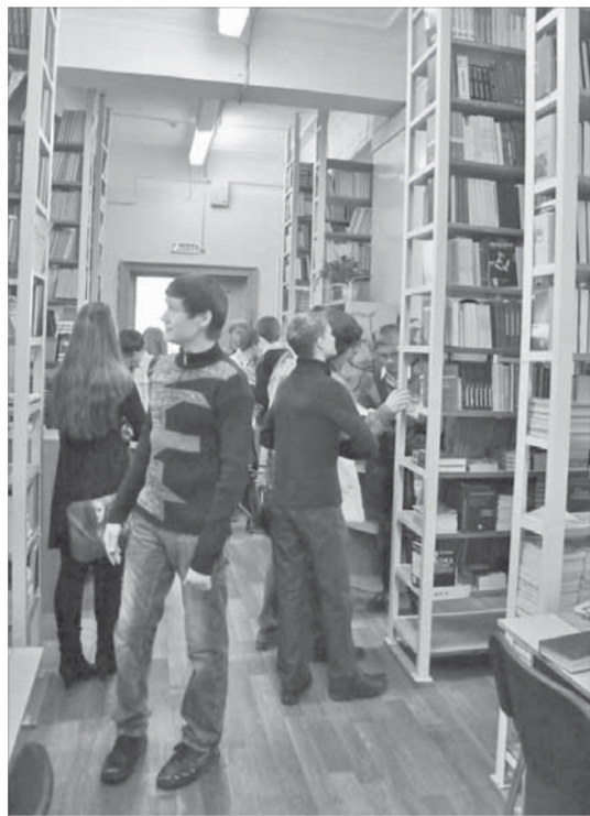
Посещение библиотеки НИИ — часть образовательной программы школьников

В лицее №1 организована школа физико-математического направления "Градиент", где ребята 8-9-х классов работают в лабораториях Норильского индустриального института и собственных лабораториях лицея и решают задачи, на которые во время учебного года не доходили руки. Физику и математику разбавят лекции по истории Таймыра и астрономии, психологический тренинг и математический КВН.