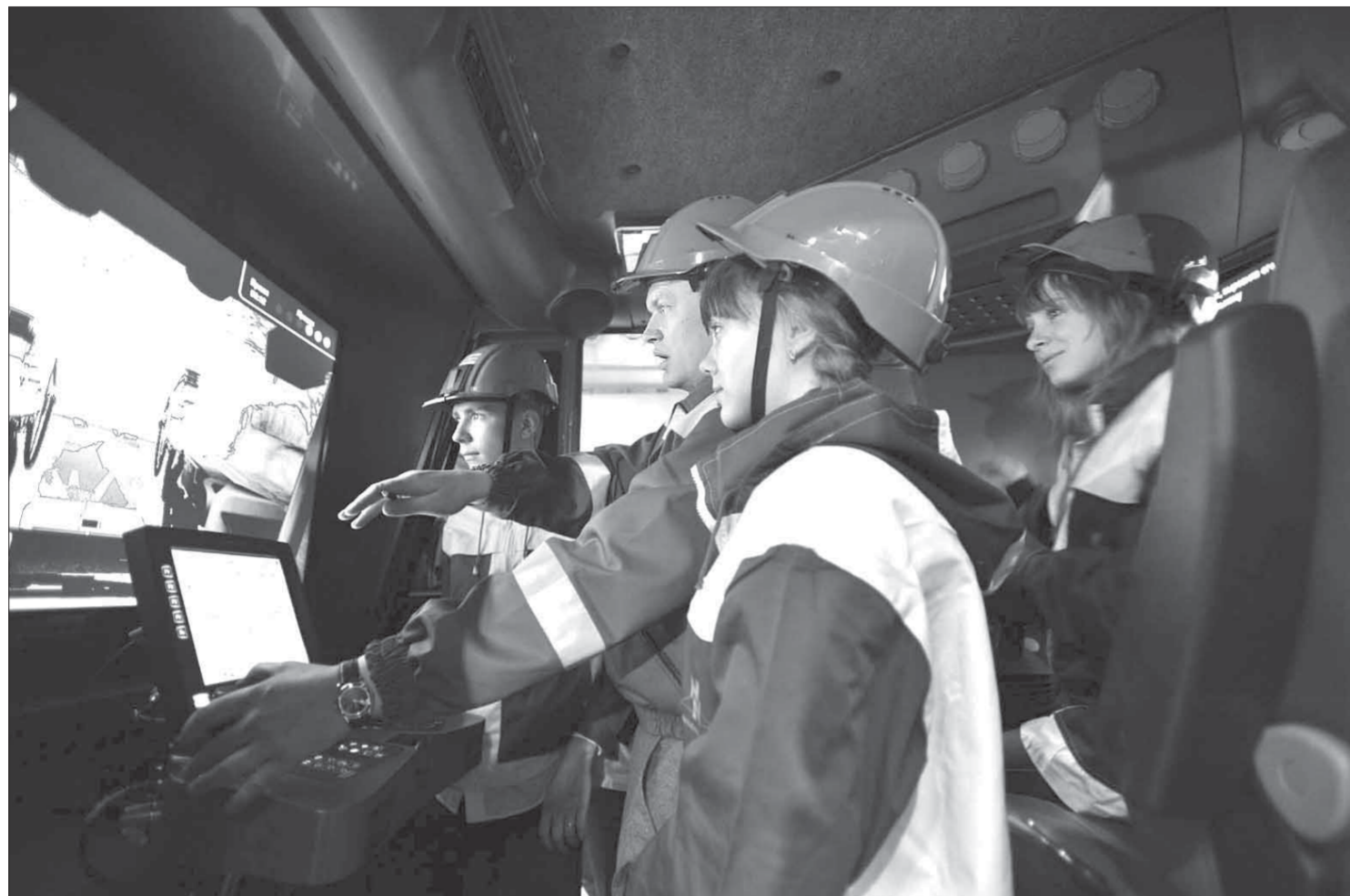
Иллюзия или реальное производство на экране?

Специалисты Росельхознадзора совместно с сотрудниками ГИВДИ остановили для проверки рефрижератор, в котором оказалось 20 тонн мороженой щуки. Позже выяснилось, что выданный на груз ветеринарный сертификат Таможенного союза оформлен с нарушениями, поэтому документ недействителен. В связи с чем весь груз был помещен в изолированное хранение до проведения экспертизы и подтверждения его ветеринарной безопасности. В отношении нарушителя возбуждено административное производство, сообщается в пресс-службе надзорного ведомства.