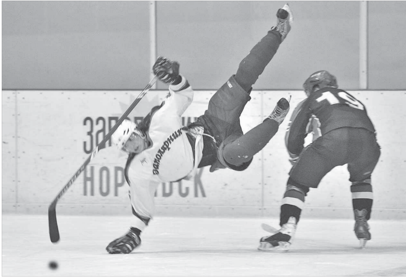
Кубиты настоящих мужчин