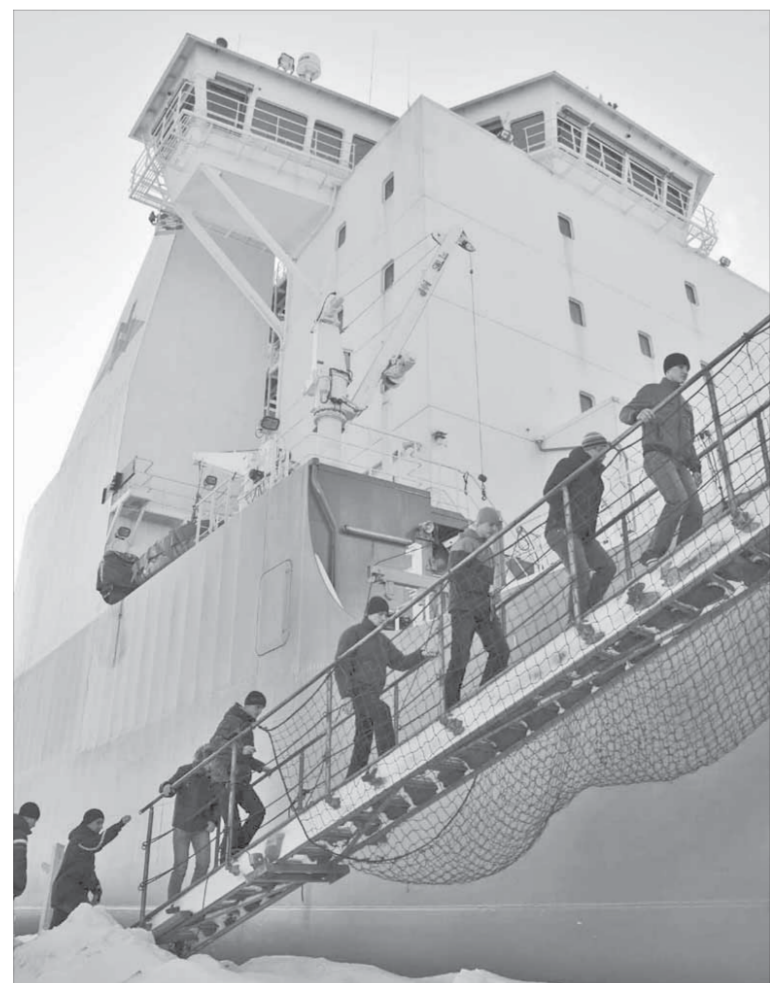
Во время подъема по трапу главное – не поскользнуться

Побывать на арктическом дизель-электроходе “Норильский никель” – настоящая удача. Просто так в подобное место не попадешь. Корреспонденты “ЗВ” вместе со школьниками из “норникельклассов” поднялись на борт уникального судна, чтобы изучить его изнутри.