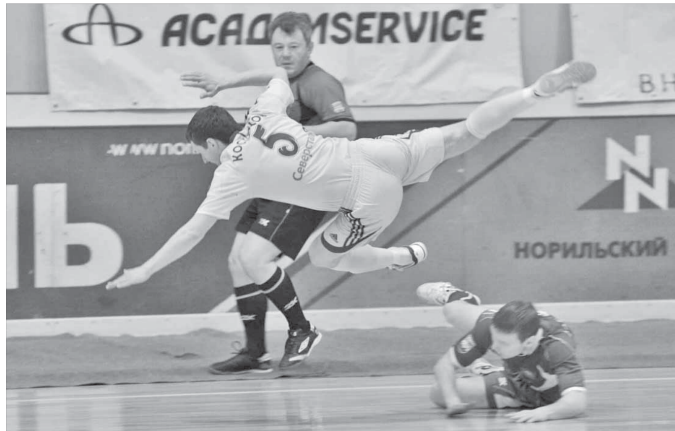
Удача пролетела мимо "Новой генерации"