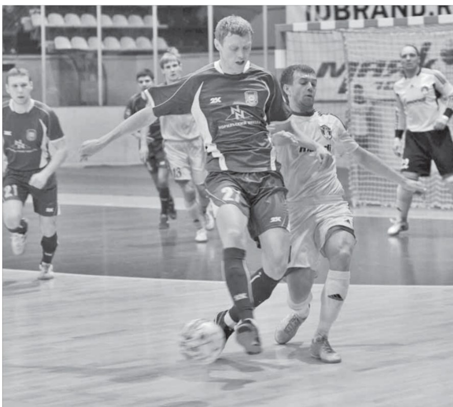
Норильчане были на голову выше противника

С восьмого места в турнирной таблице "Норильский никель" переместился на седьмое, потеснив "Новую генерацию". Впереди игра на домашней площадке с "Диной".