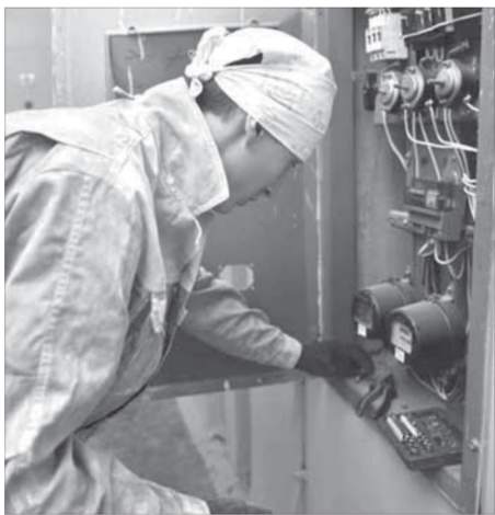
Внутридомовая система электрооснабжения тоже часть общедомового имущества

Это проблема не только Норильска: жилищно-коммунальное хозяйство уже давно называют третьей бедой России. Еще два года назад глава Минрегиона Виктор Басаргин заявлял, что основные фонды ЖКХ изношены на 60%, а в некоторых населенных пунктах – на все 90. Чтобы восстановить эту инфраструктуру, нужно не меньше шести триллионов рублей – в разы больше, чем каждый год тратится на ЖКХ из консолидированного бюджета субъектов РФ. Шесть трил-