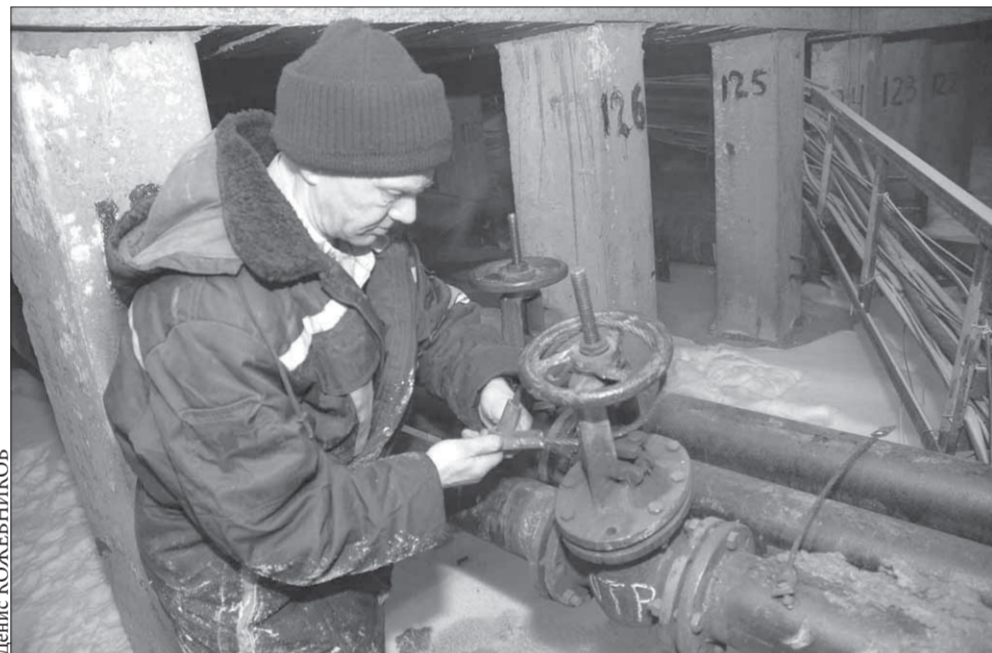
Чей вентиль, того и труба

Такие же правила распространяются на электрические сети: имущество жильцов начинается на входных зажимах квартирного электросчетчика. Замена проводки внутри квартиры, как и замена электросчетчика, – забота квартиросъемщика.