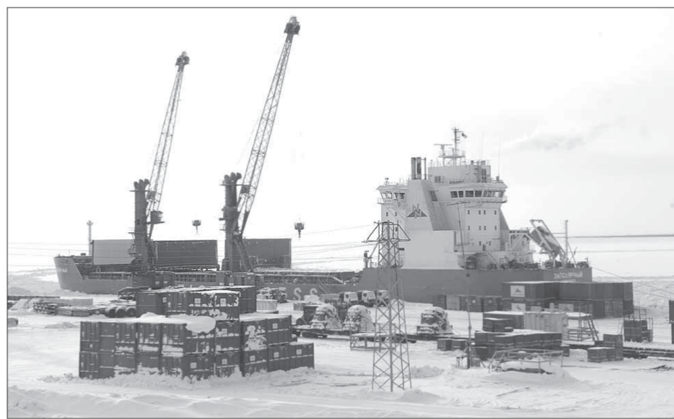
К паводку причалы порта опустеют