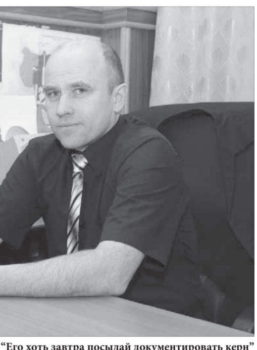
“Его хоть завтра посылай документировать керн”