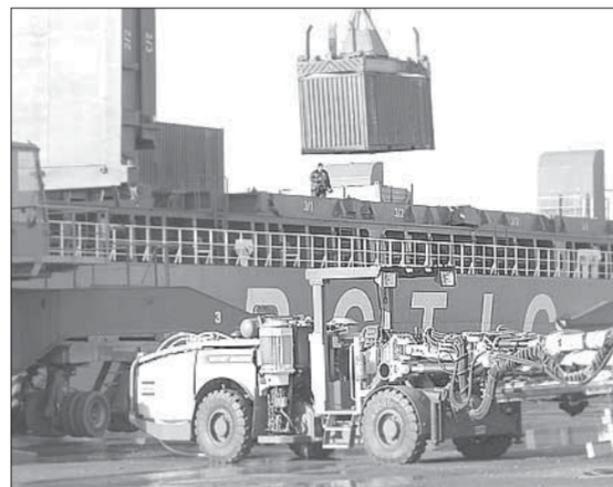
Флот передышек не дает

Первыми причалы покинут восемь порталных кранов, для погрузки вагонов останется лишь пара. Последними на незатопляемые отметки своим ходом уйдут мобильные краны Liebherr, которые будут обрабатывать суда в предпаводковый период, как говорят портовики, до упора.