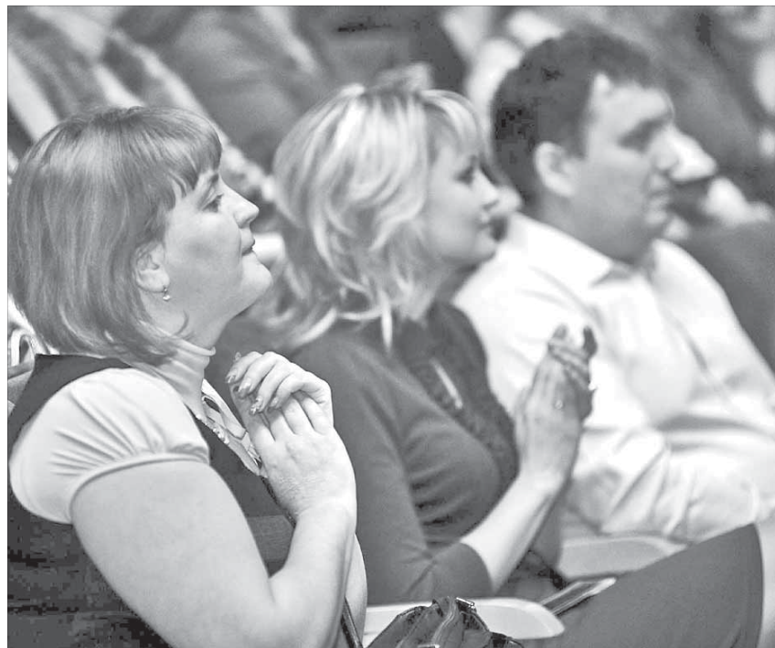
От музыкального подарка женщины в восторге

И большинство женщин, посетивших концертную программу, кажется, были с ней солидарны.