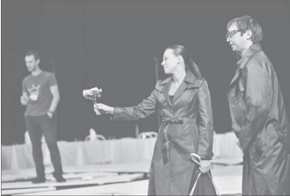
Спектакль по Вампилову отправится в Красноярск