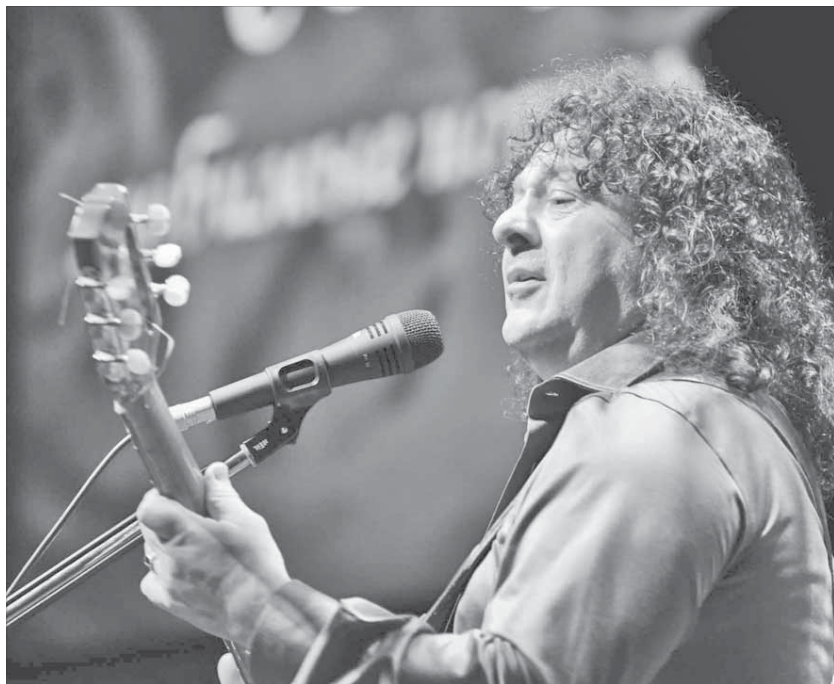
Не расстается с гитарой уже 40 лет

Армянин по происхождению, родившийся в Узбекистане, Игорь Саруханов в детстве переехал с родителями в Москву, где и началась его сольная карьера. В качестве гитариста, певца и композитора