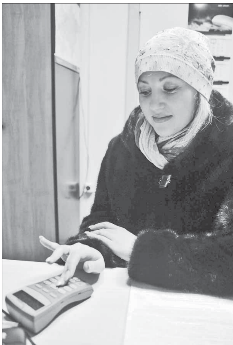
Решение проблемы было мгновенным