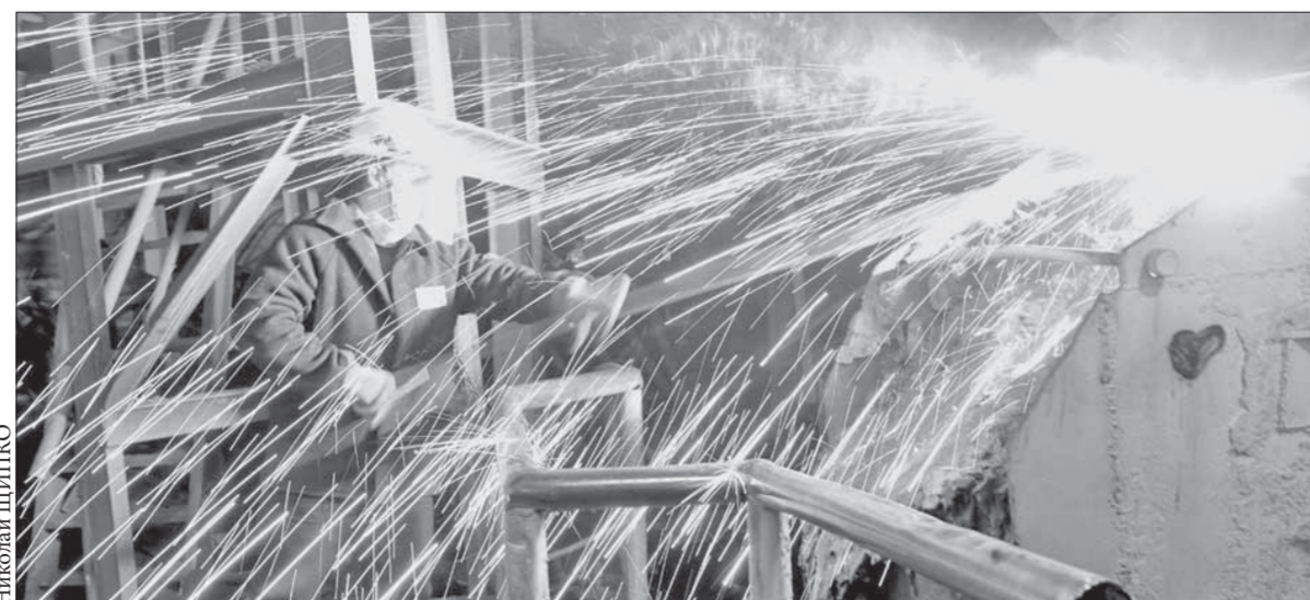
Металлурги в феврале поработали хорошо

В марте запланирован пятисуточный ремонт рудно-термической печи №5 плавильного цеха никелевого завода. На Талнахской обогатительной фабрике будет вестись плановый ремонт парка мельниц. На Надеждинском металлургическом заводе приступят к реконструкции обеднительной электропечи №2.