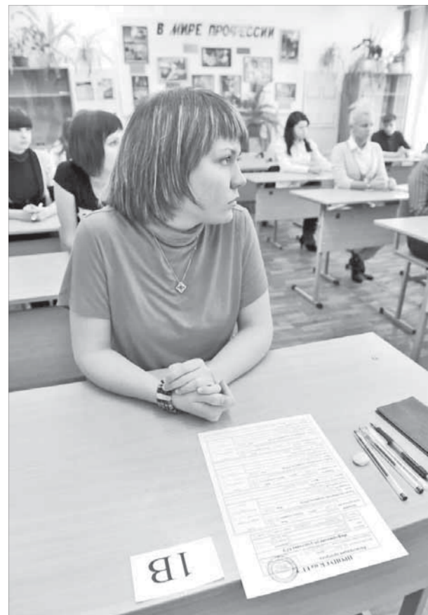
ЕГЭ – дело непростое