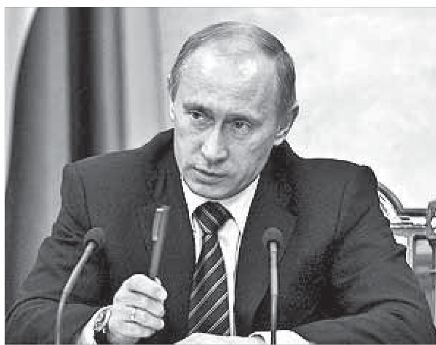
Владимир Путин: «Россия имеет мощный потенциал»

В последние годы российская дипломатия, наши деловые круги стали уделять больше внимания развитию сотрудничества со странами Азии, Латинской Америки и Африки. В этих регионах по-прежнему сильны искренние симпатии к России. Вижу в качестве одной из ключевых задач на предстоящий период наращивание с ними торгово-экономического взаимодействия, реализацию совместных проектов в