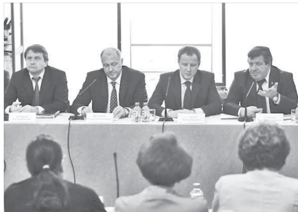
Участники круглого стола высказались за сохранение стабильности