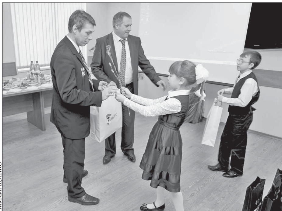
Подарки из рук подшефных ребят особенно приятны

В ОАО "Норильскгазпром" прошло ежегодное чествование воинов-интернационалистов. Всех, кто в разные годы участвовал в боевых действиях и локальных конфликтах, а ныне трудится в НГП и компании "Таймырغاز", еще раз поблагодарили за силу и мужество.