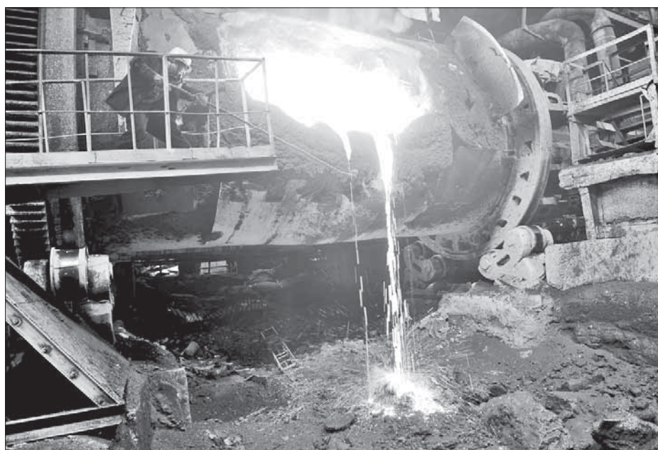
Конвертерщик отбирает пробу для определения готовности фанштейна