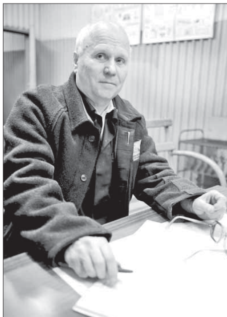
На него всегда можно положиться