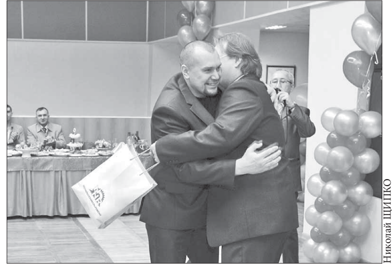
Слова благодарности – участникам боевых действий

Участницы "Женского взгляда" поют о верности и о любви. К своим близким, к родному Норильску. И столько драйва и искренности в их исполнении, что в какой-то момент воины не выдерживают. Выходят на импровизированную сцену, приглашая милых дам танцевать. Настроение в зале меняется. Понять, как