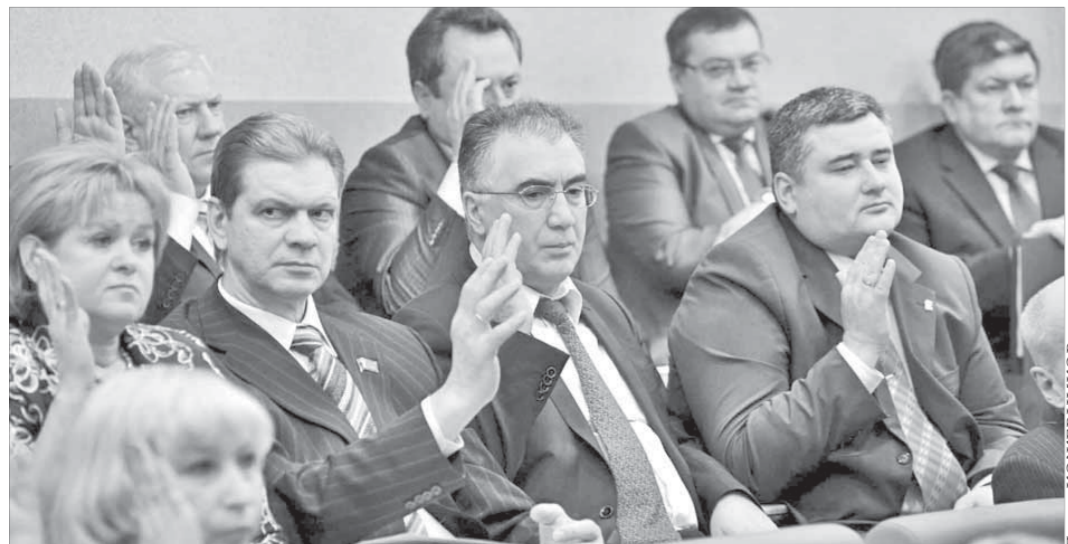
Последняя сессия депутатов третьего созыва приняла решения почти по 30 вопросам

Как сообщает Восточно-Сибирский центр продаж ЧТЗ, заказчик приобрел на челябинском тракторном заводе один такой же ДЭТ. Он уже собран и в ближайшие дни будет отгружен.