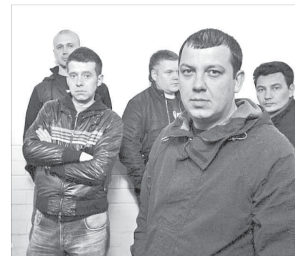
"Глюки" поздравят норильских мужчин