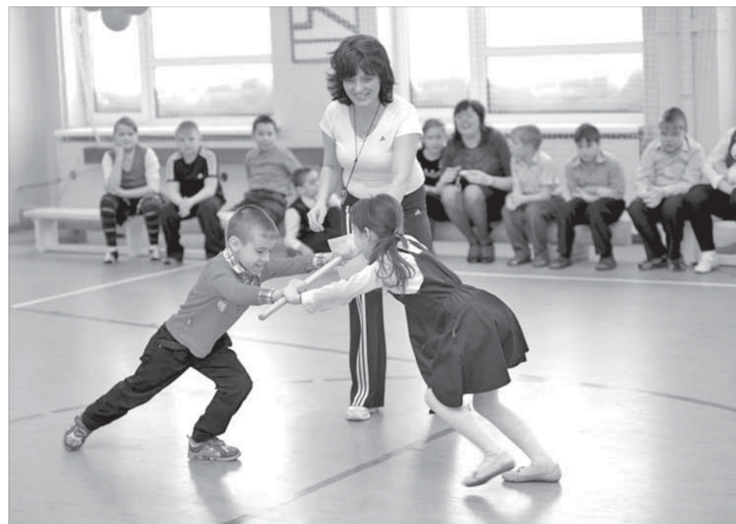
Игры северных народов порадовали особенно

Мне, жительнице Норильска, всегда интересно узнать что-то новое о народах Севера, об их быте и культуре. В эту пятницу в специальной коррекционной школе-интернате VIII вида прошел праздник Сань Юри, что в переводе с нганасанского языка означает "я вижу красоту".