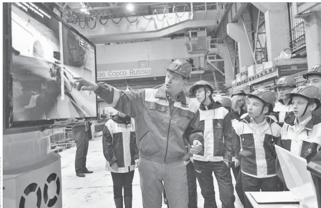
На экране можно увидеть то, что происходит в кабине

– Я представляю Норильский шахтостроительный трест, которому 1 апреля этого года исполнится 40 лет. В НШСТ сегодня работает 3,5 тысячи человек. Только под землей на строительстве объектов занято 110 единиц импортного самоходного оборудования. Наше предприятие является генеральным подрядчиком на строительство всей сырьевой базы. Выполняя стратегию, принятую ГМК "Норильский никель", трест за последние несколько лет значительно увеличил объемы по отбойке горной массы. Если три года