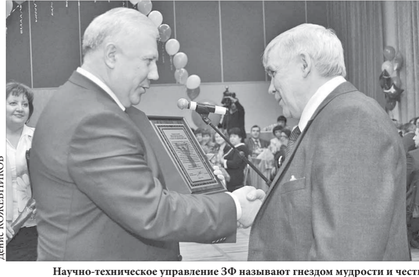
Научно-техническое управление ЗФ называют гнездом мудрости и чести