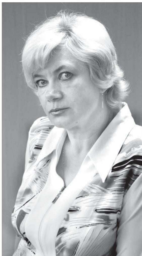
Она из тех мест, где не принято говорить: “Я устала”