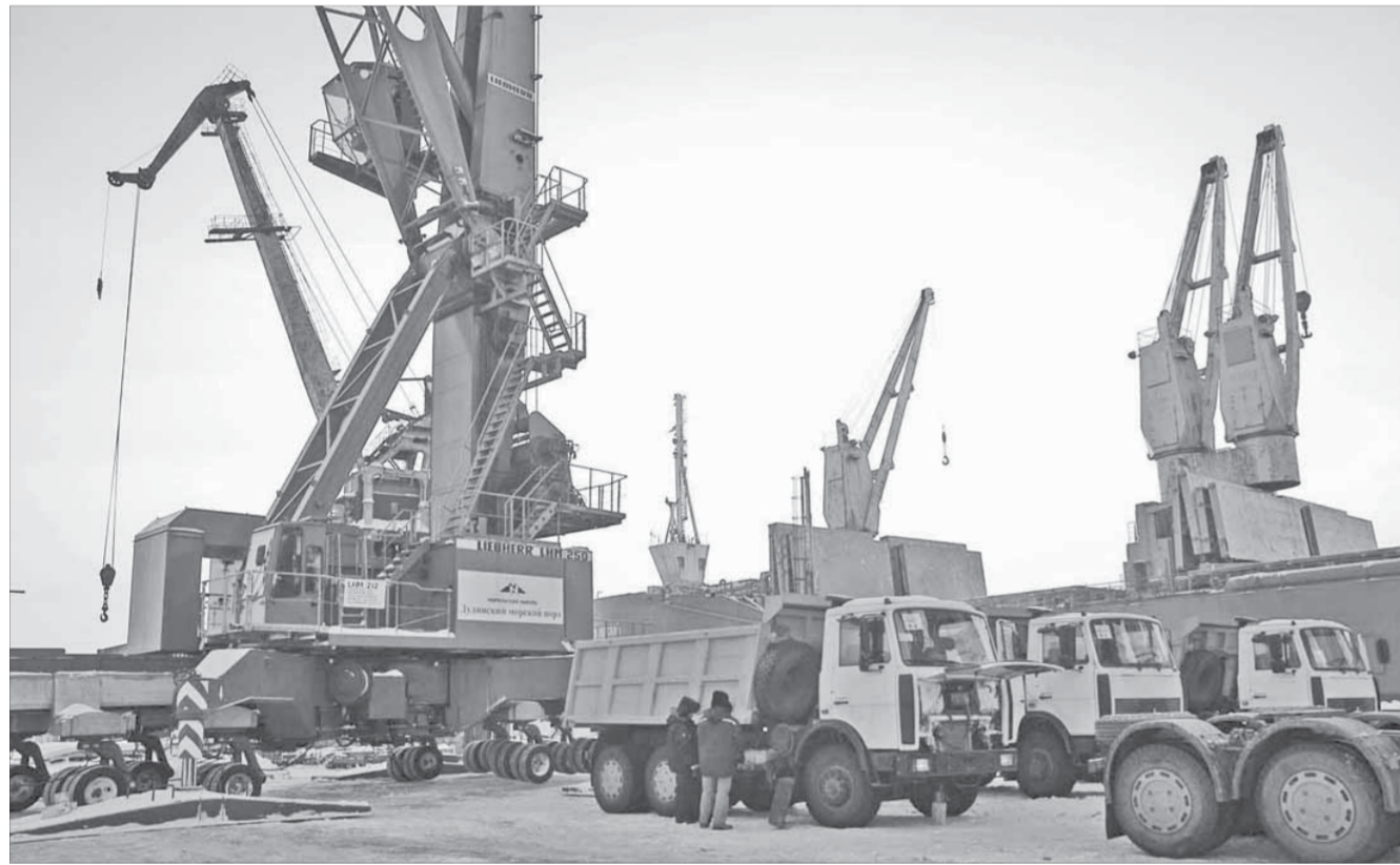
Новые суда и техника – в приоритетах ЗТФ

До 2016 года в Заполярном транспортном филиале запланирована реализация 13 инвестиционных проектов.