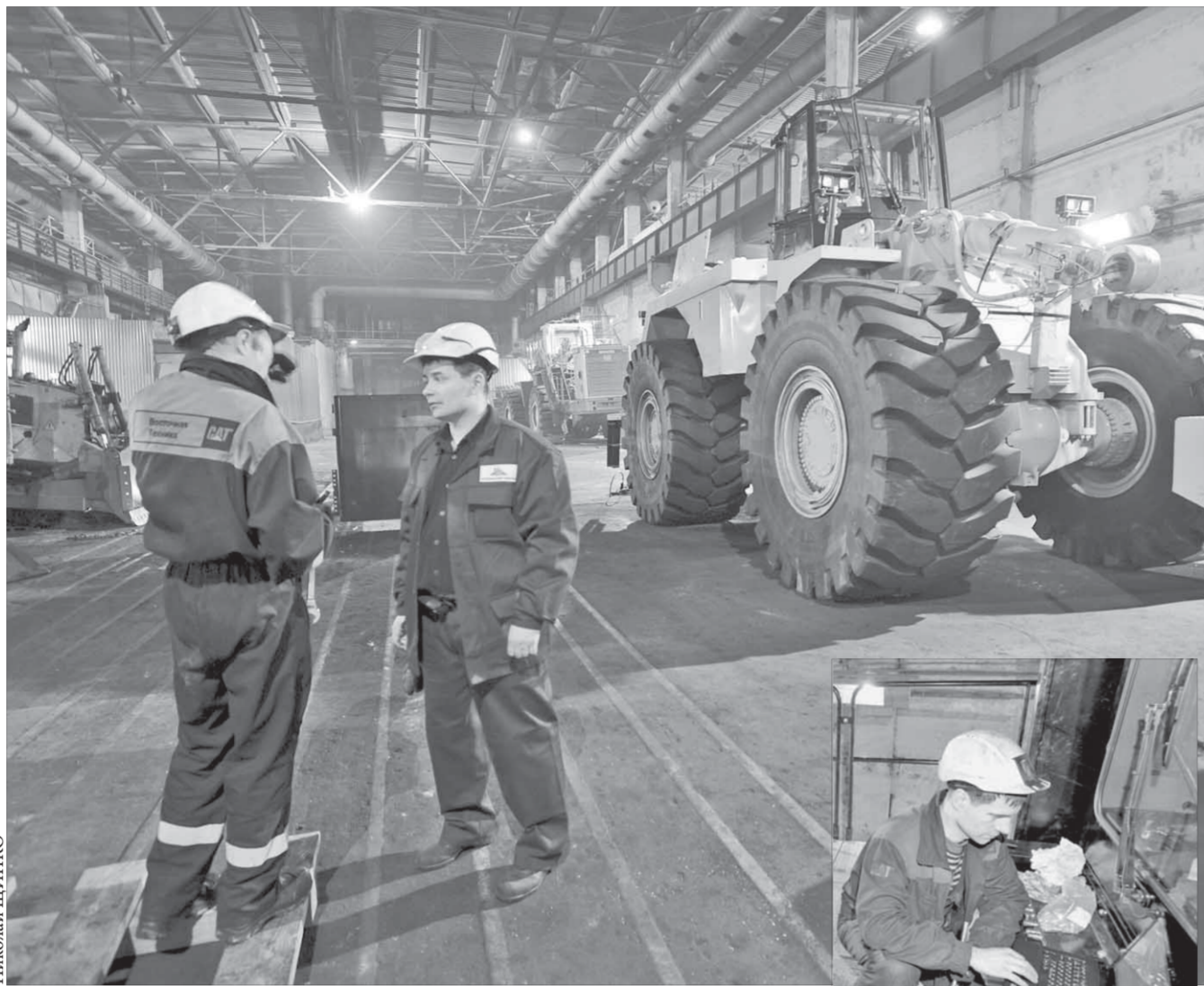
Новые погрузчики выполнены по спецзаказу "Норильского никеля"