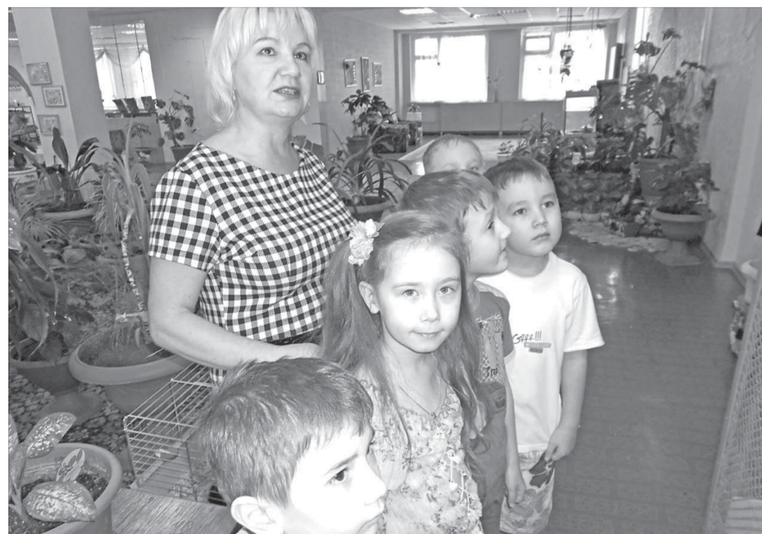
В детских глазах – искренний интерес

Конечно, когда я подросла, то обо всем догадалась. Но насколько не расстроилась, поняв, что дедуле удавалось долго водить меня за нос. Наоборот, я благодарна ему. Он научил меня верить в чудо. Потом мы всей семьей переехали в Россию, а дед, бабушка и верный Петрайка остались в Казахстане. Он стал для всех нас настоящим членом семьи. И я до сих пор уверена, что он понимал о нас больше, чем мы предполагали.