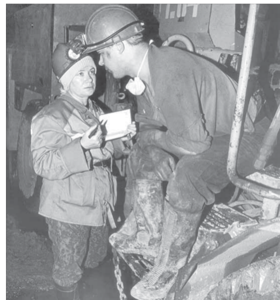
После украинских полей она истоптала ногами весь НПР