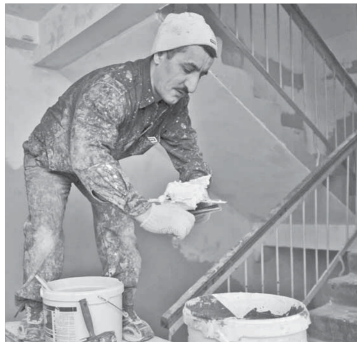
Мастерски владеет мастерком

листы в данном случае руководствуются простыми соображениями – с плохой штукатуркой одну и ту же работу придется делать дважды. После каждого рабочего дня Актай с коллегами выметают с места своей работы строительный мусор, складывают его в мешки и выносят на улицу. Позже мешки увозит погрузчик. У жильцов, чьи тамбуры в квартирах отгорожены металлическими дверями, обязательно спрашивают, нужно ли им там делать ремонт. С многочисленными коммуникациями кабельных сетей обращаются аккуратно. Прежде чем приступить к работе, из ЖЭКа в подъезд отправляется электрослужба, которая приводит проводку в порядок. Правда, владельцы кабельных сетей подчас мало прислушиваются к рекомендациям коммунальщиц и позволяют себе даже ломать замки на чердак и крышу, если