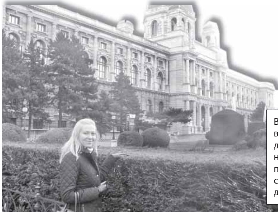
Гулять по Вене одно удовольствие