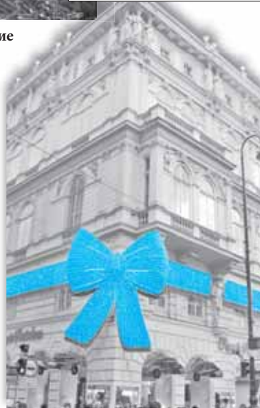
Иллюминация заслуживает восхищения

Мое мнение о венцах как людях, способных на экстремальные поступки, укрепилось в тот день, когда мы спустились в метро. К слову, пару раз за время пребывания в Вене мы позволили себе прокатиться в метро зайцем. (1,80 евро – в