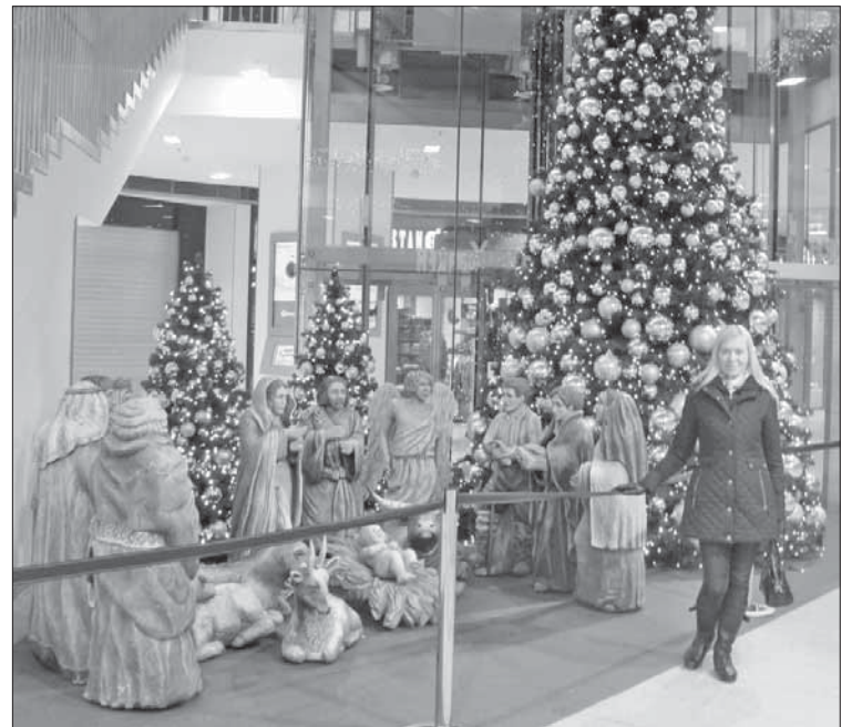
Рождественские темы повсюду