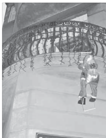
На многих балконах можно увидеть Санта-Клаусов

Мы решили проехаться по историческим улочкам и новым районам города на автобусе. В России Пушкин – это наше все. В Австрии – Моцарт. Большая часть достопримечательностей, а также сувениров связана с именем гениального композитора. Каких только историй не рассказывают про него австрийцы! Вот здесь он какое-то время жил. Вот в этой церкви Моцарт сочетался браком со своей возлюбленной... Кстати – не падайте в обморок, русские невесты! – известно, что во время церемонии Моцарт от избытка чувств заплакал. Понятное дело, после этого не смогла сдержать слез новобрачная. Следом за женихом и невестой заплакал священник.