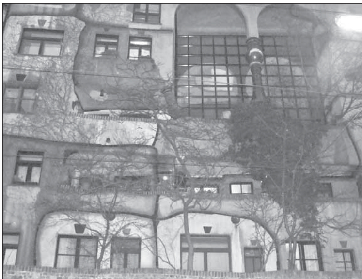
Дом Хундертвассера заметен издали

Словом, приходится выбирать. Вот и выбирайте – какая Вена ваша.