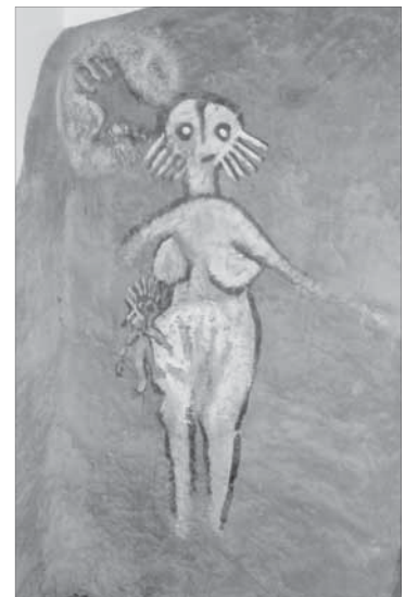
Австрийцы очень раскрепощенный народ

Однажды, выйдя из вагона поезда, мы стали свидетелями сногшибательной сцены. В центре зала, у скамьи, стояла женщина. Все было ничего, но... Кроме куртки и кепки на женщине ничего не было! Бомжиха? Не похоже. Балансируя на одной ноге (грязно же!), женщина надевала кружевные трусы и колготки и параллельно с этим разговаривала по мобильному. В отличие от меня Вера, сразу смекнув, что происходит, решила двигаться к