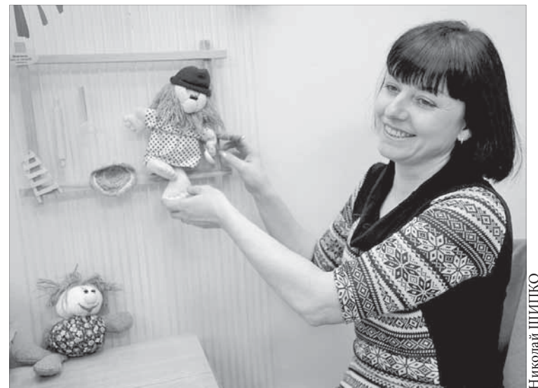
Их делают своими руками