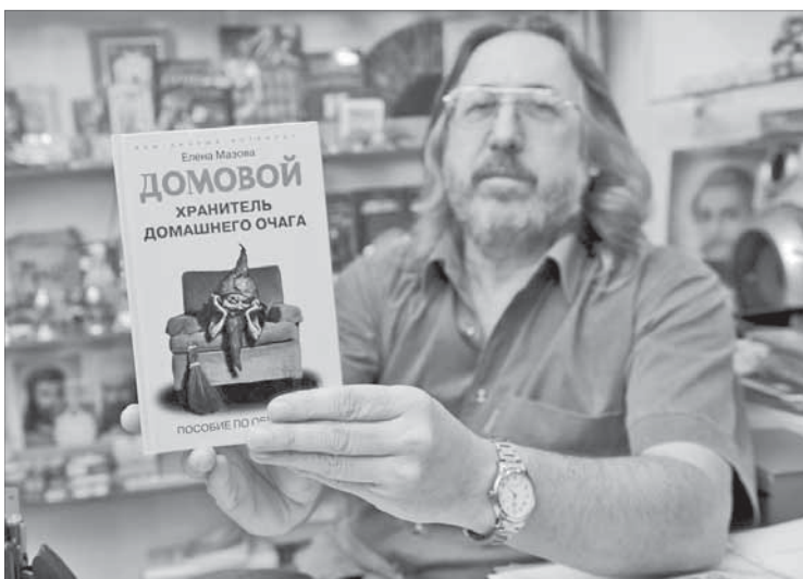
Про них пишут книжки