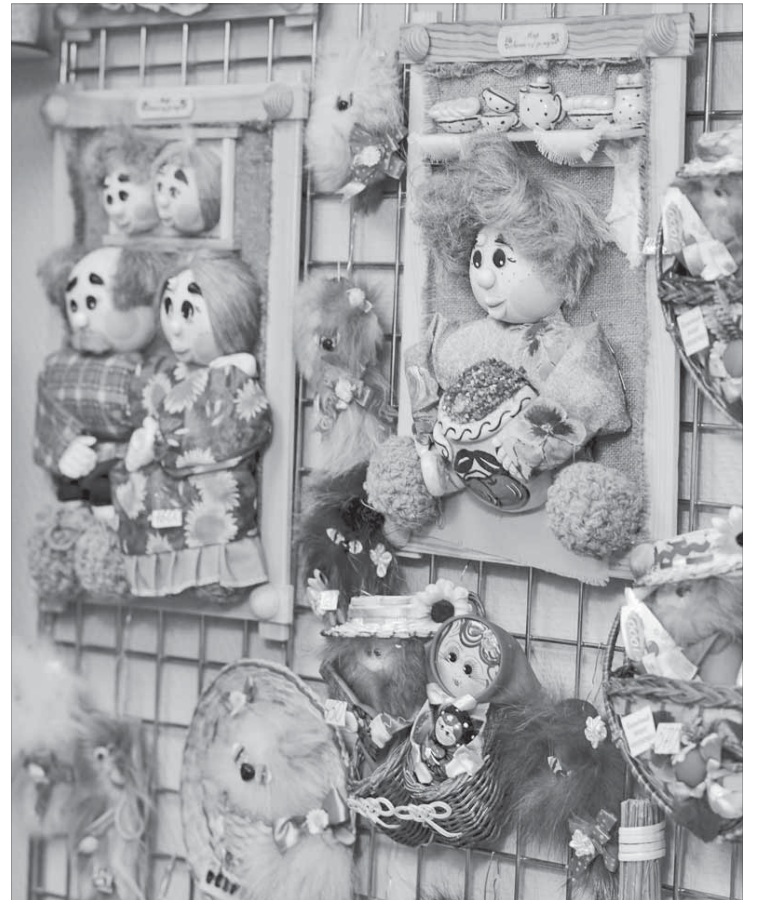
На полках магазинов они точно есть