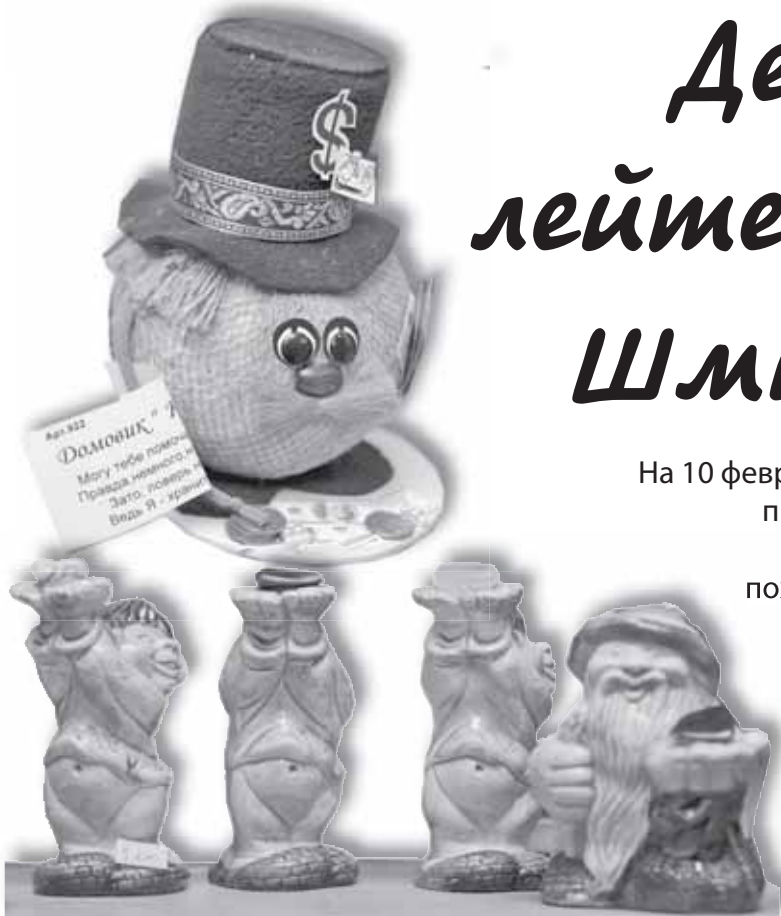
Дизайнеры видят их по-разному

На 10 февраля выпадает экзотичный праздник – День домового. Навряд ли кто-то может похвалиться, что здоровался с этим персонажем русской мифологии за руку. Но в городе есть места, где можно увидеть домовых в материализованном виде и услышать про них занятные истории.