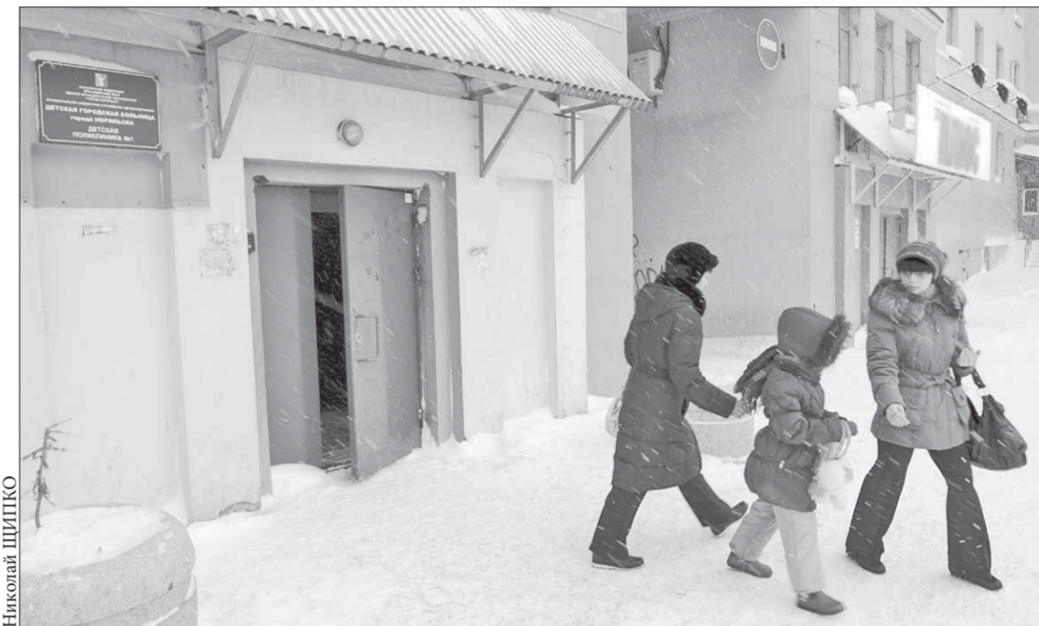
Февраль для тысячи маленьких норильчан начался с простуды

Курицам взрослым (и подросткам) не мешало бы бросить это вредное занятие. Давно известно, что курение оказывает негативное влияние как на общую сопротивляемость организма инфекционным заболеваниям, так и на местный защитный барьер – в слизистой носа, трахеи, бронхов.