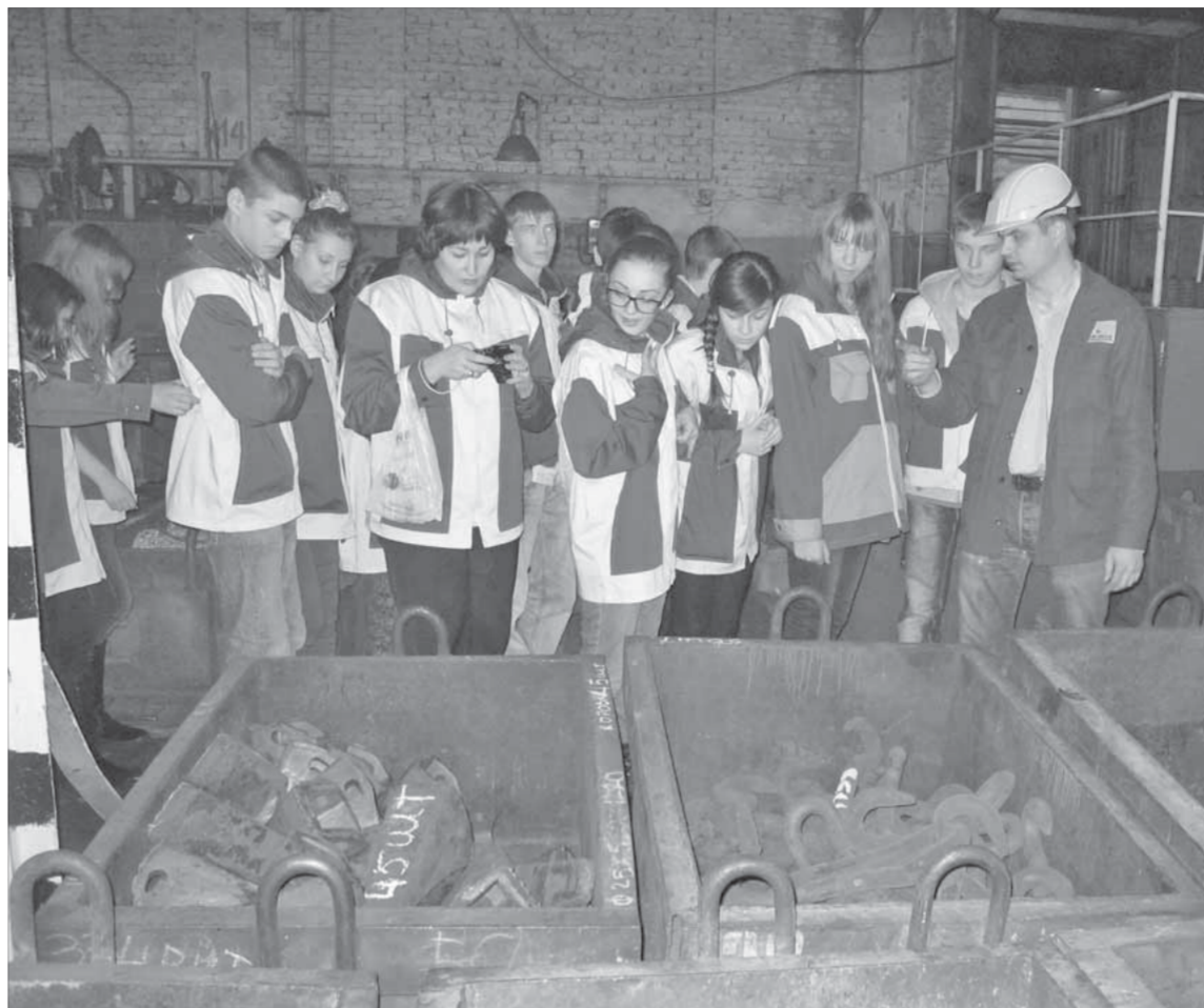
Каждый цех интересен по-своему

Организаторы уверены, что часть ребят всерьез заинтересовалась перспективой работы здесь. Если из 20 человек, посетивших механический завод, хотя бы несколько станут в будущем его работниками, значит профориентационная работа дает результаты. В любом случае мероприятие останется в памяти ребят как яркое и важное событие. Механический настолько впечатлил старшеклассников, что они пообещали еще вернуться сюда.