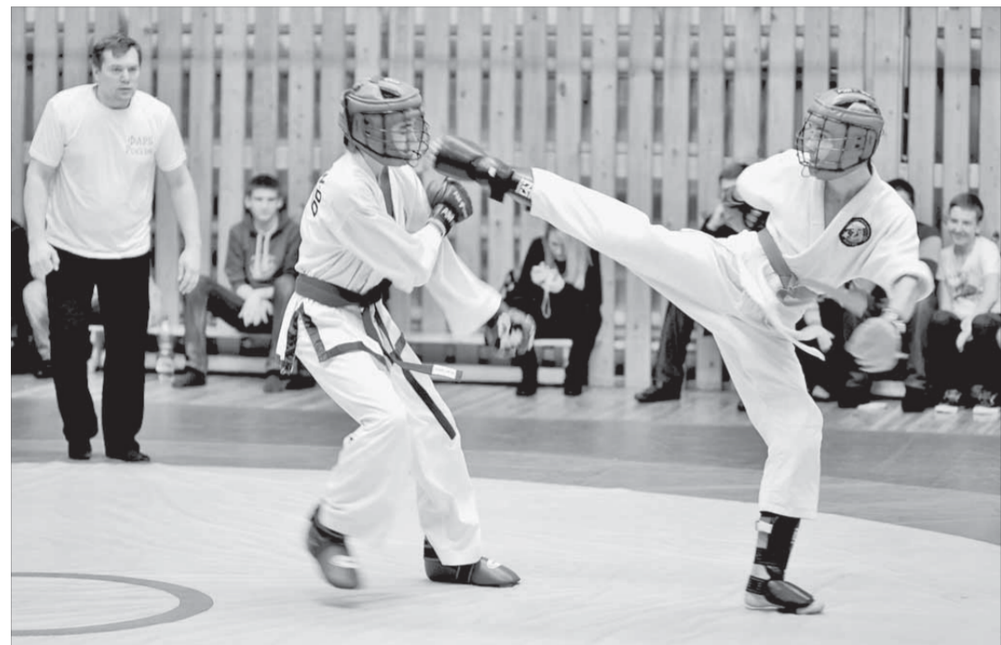
Каждый участник стремился продемонстрировать свое мастерство

собствуя подготовке к поступлению в вузы, и не только военные. Не менее важно то, что благодаря занятиям АРБ парни вырабатывают активную жизненную позицию, изолируя себя от пагубного воздействия улицы.