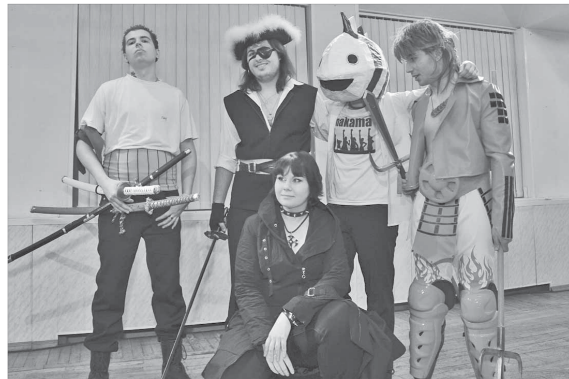
Человек-рыба и его друзья