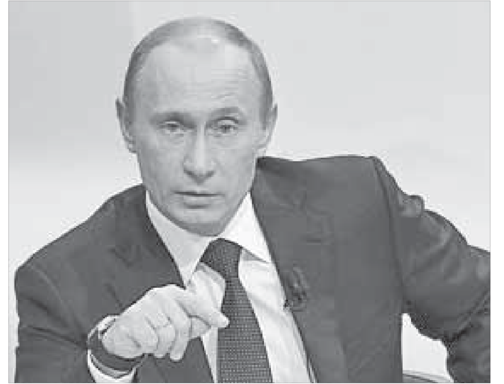
Владимир Путин: «Наше место в будущем мире зависит от того, используем ли мы свои возможности»

Российские исследовательские университеты должны получить ресурсы на научные разработки в размере 50% от своего