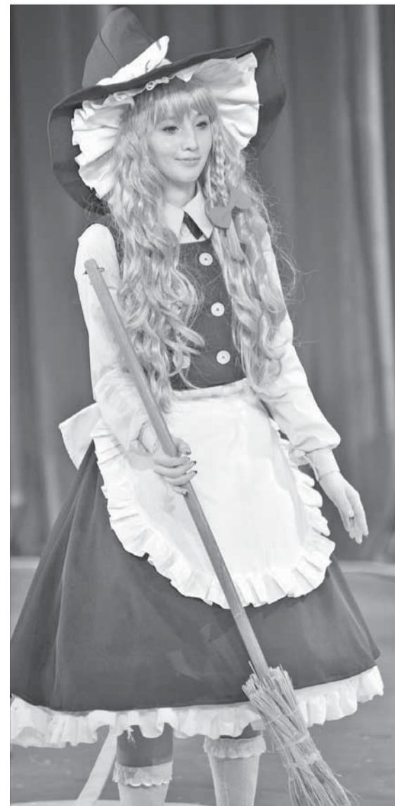
Ведьмы могут быть милшками