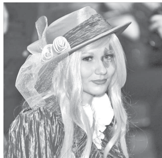
Какой косплей, какие шляпки!

– Моей десятилетней дочери косплея очень понравился, она не хотела уходить, а я, честно сказать, поняла немного, так как аниме не ув-