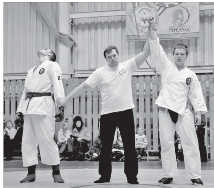
Победа и поражение ходят рядом