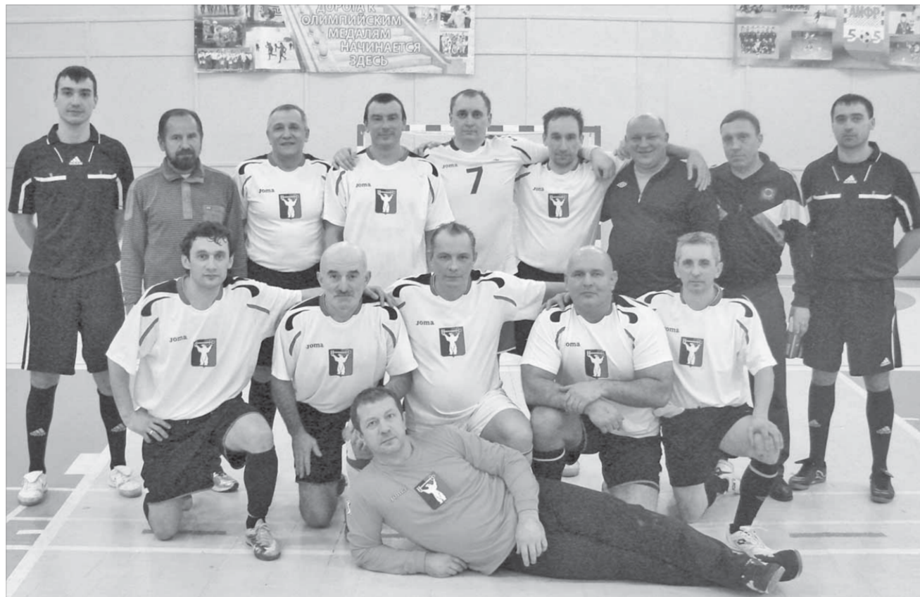
Собрать ветеранов вместе случается нечасто

Следующий тур Кубка стартует 3 марта. Игры пройдут в Талнахе.