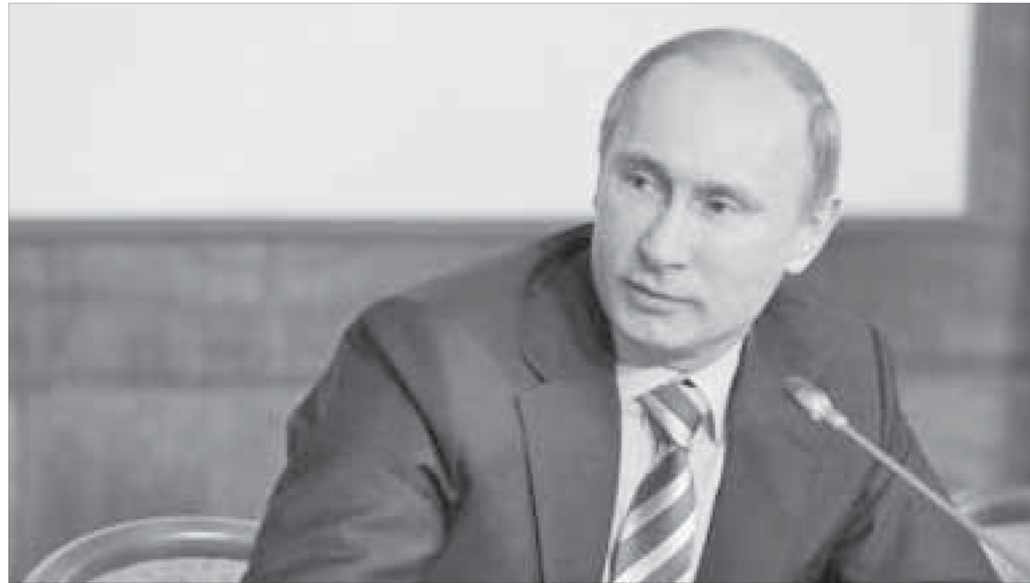
Владимир Путин: «Российский опыт государственного развития уникален»

В одном из самых ранних русских философско-религиозных трудов «Слово о законе и благодати» отвергается сама теория «избранного народа» и проповедуется идея равенства перед Богом. А в Повести временных лет так описан многонациональный характер древнерусского государства: «Вот только кто