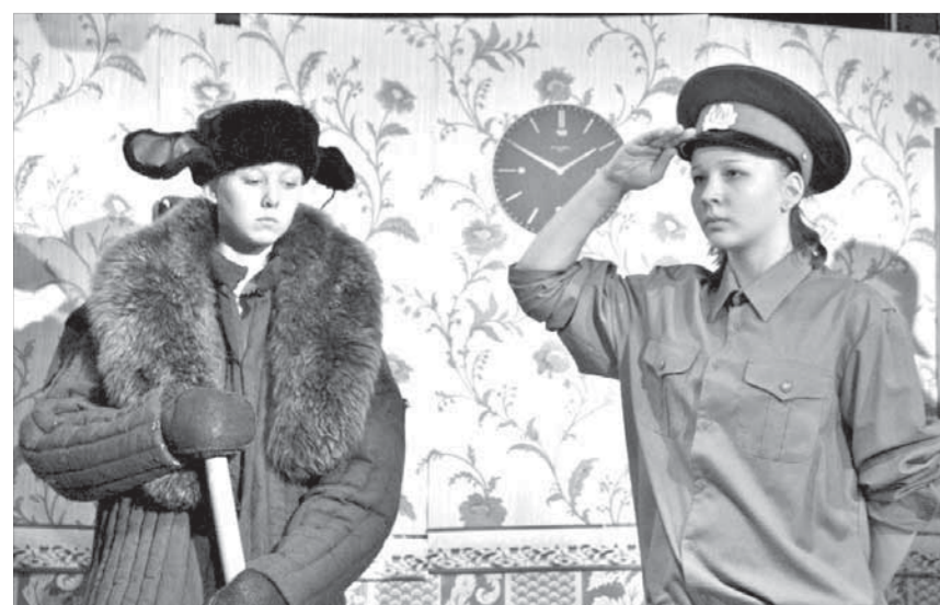
Советский дворник и советская милиция? Абсурд, но!

Дебют вышел на славу. В качестве зрителя подтверждаю.