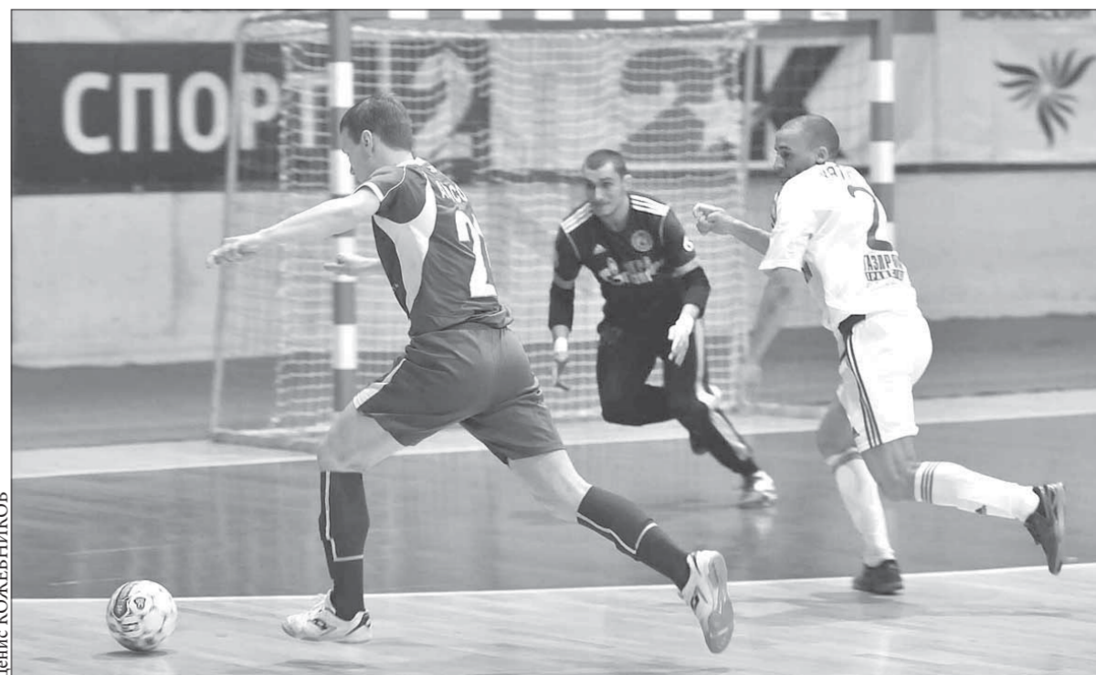
На поле норильчане смотрятся отлично, в таблице – хуже

Курс акций ОАО «ГМК «Норильский никель» – 5813 рублей. ОАО «Полюс Золото» – 1024,3 рубля.