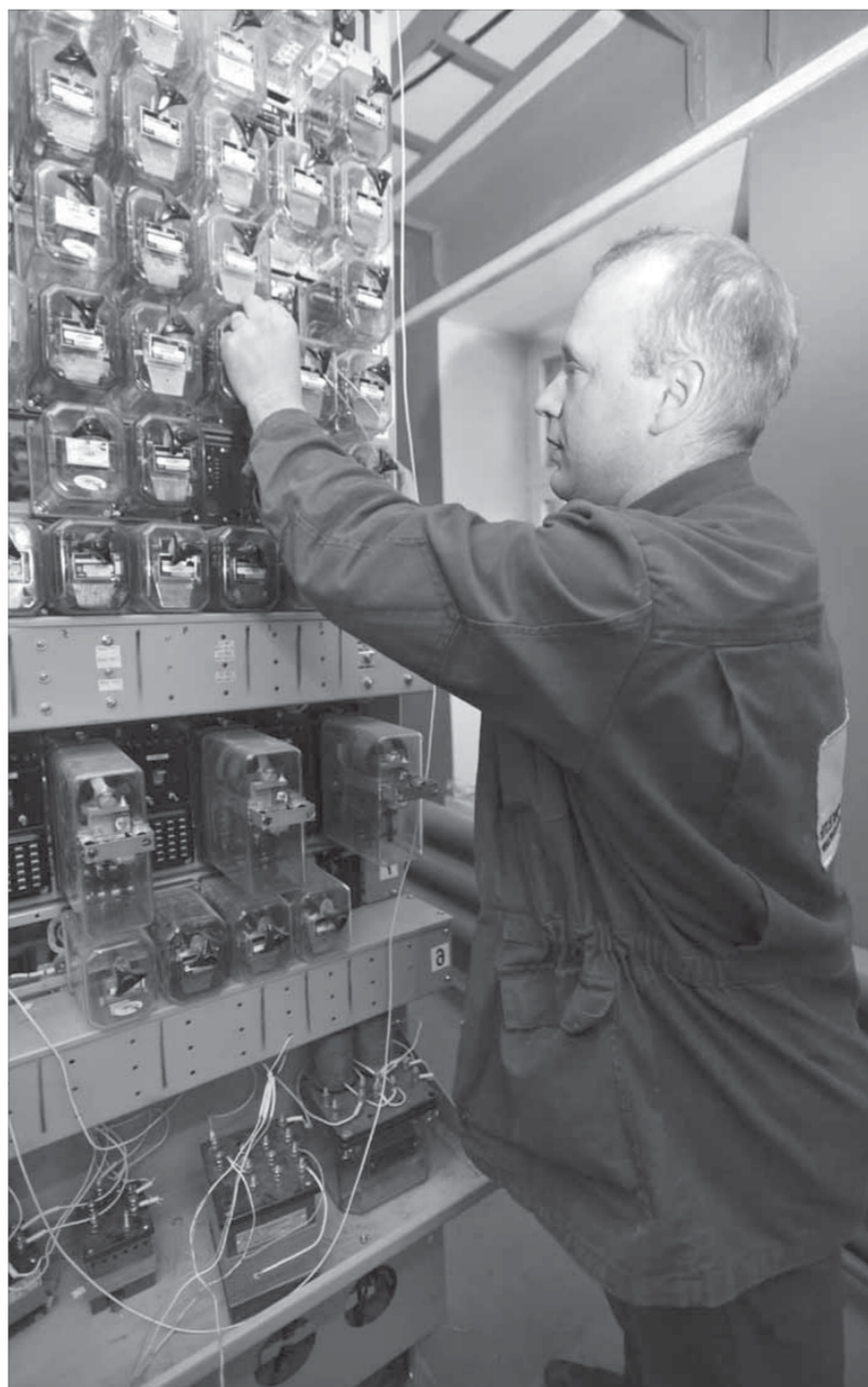
Современные технологии – это новое отношение к труду