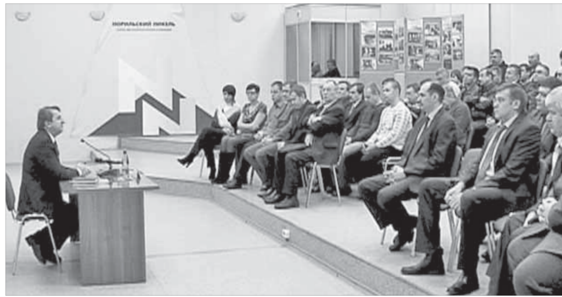
На встречах с директором ЗФ работники поднимают важные для них проблемы

вашем рынке, не может особо радовать, – высказал директор мнение, с которым согласятся очень многие норильчане.