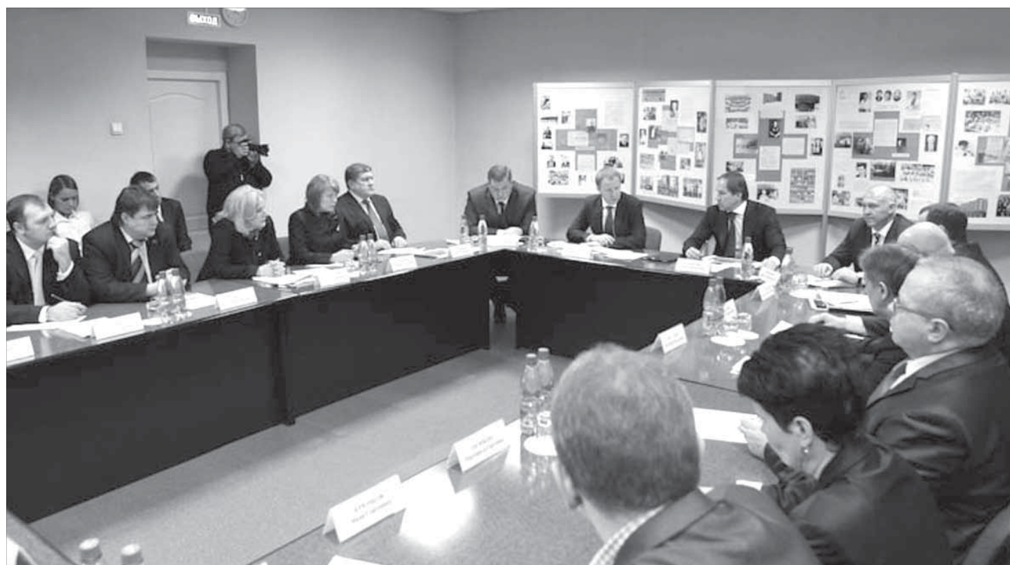
Как сделать так, чтобы здравоохранение было безупречным?