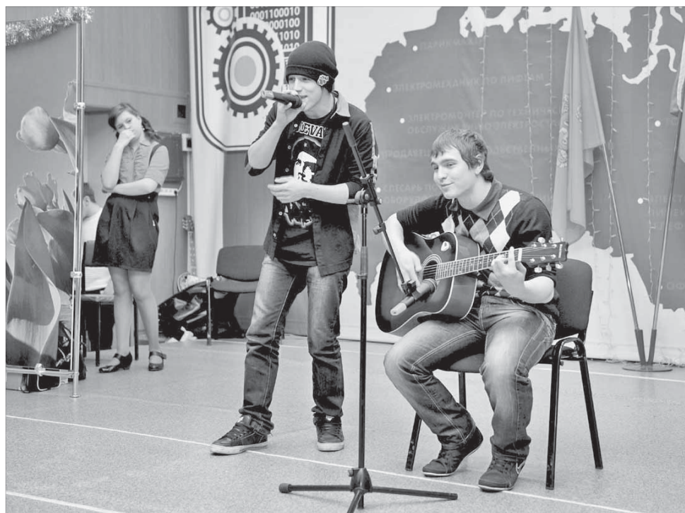
А как для Татьян пели!