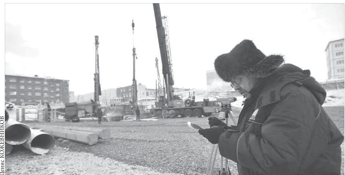
Всё точно – по приборам