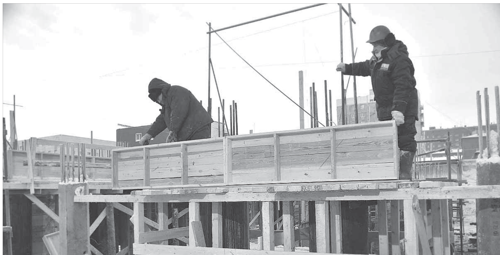
За опалубку, не мешкая