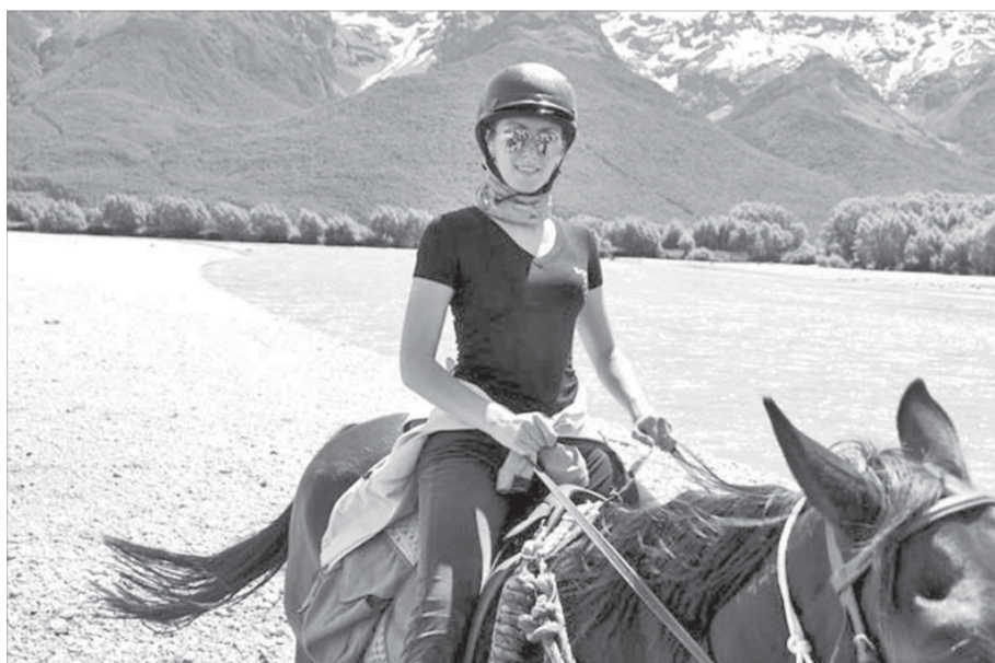
Оседлать коня и помчаться наперегонки с ветром – вот это удовольствие!

Поскольку очень хотелось посмотреть на символ Новой Зеландии