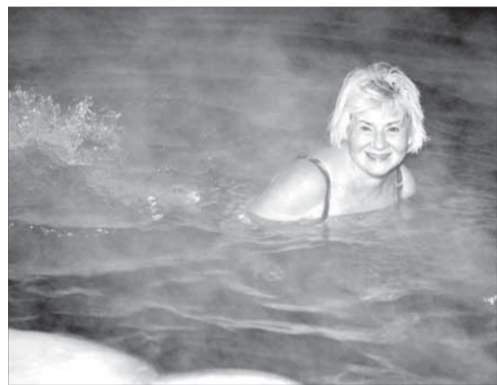
Холодная вода – здоровье