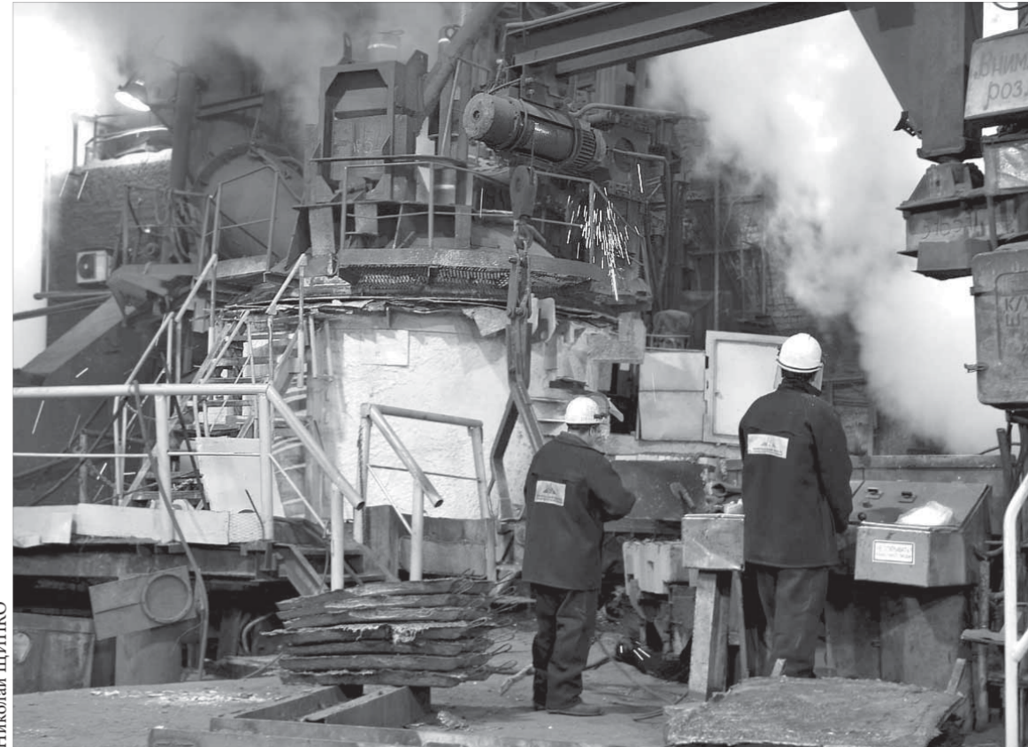
Большая рудная наклонная печь на ОПУ-2 оснащена в прошлом году центральной загрузкой

В конце 2011 года эти приборы были закуплены, и сейчас проводится обучение инженерно-техни-